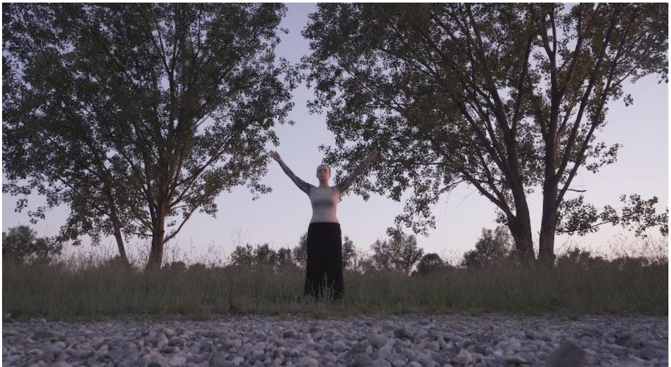
Lice prirode, 2024., detalj

Prikazujem svoj odnos prema prirodi, stablima i prostoru. Smjestivši se u sredinu između dva stabla. Svoje ruke koje su oslikane lišćem širim kao grane, simbolički povezujem s dva stabla između kojih stojim te označavam mogućnost novog odnosa prema prirodi, izražavam simbiozu jedinstva prirode i sebe.