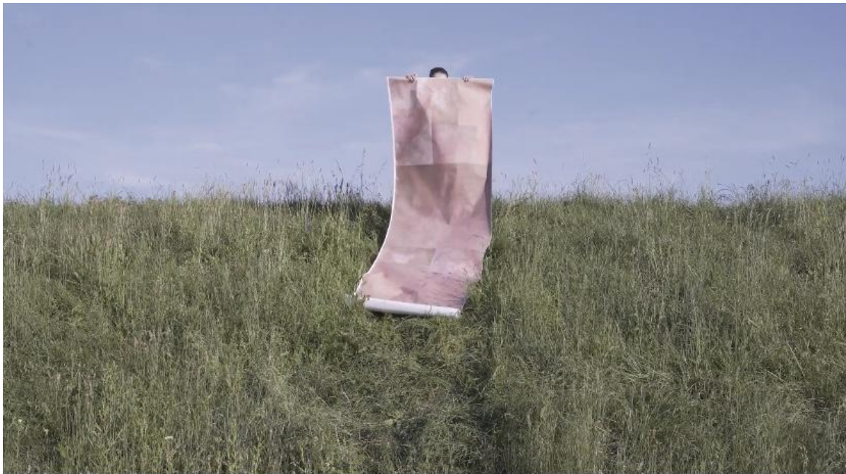
Lice prirode, 2024., detalj.

Odlazim na vrh nasipa. Uzimam rolu na kojoj su isprintani povećani dijelovi moga lica s oštećenjima na koži izazvanim alergijskom reakcijom na travu. Jednim potezom je pustim da se odrola niz nasip i tamo je ostavljam.