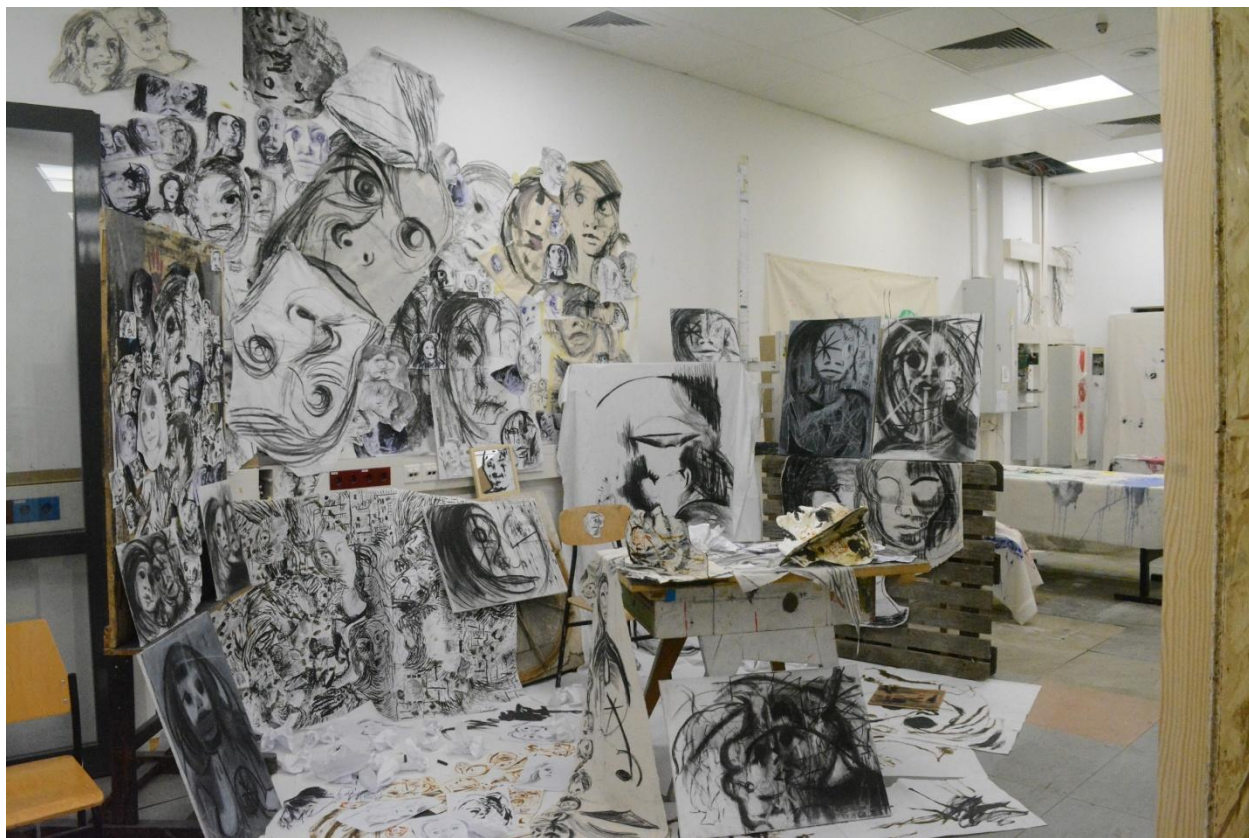
Ja i moj svijet, 2024. Kombinirana tehnika (papier, platno, ugljen, grafit, akril), dimenzije primjenjive