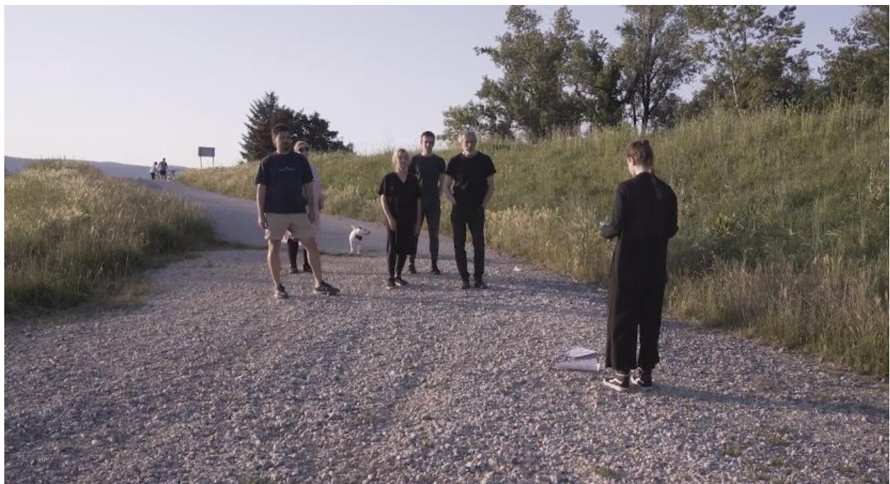
Lice prirode, 2024., detalj

„Hodanje do određenih puteva daje mi priliku da usporim, da se vratim u svoje tijelo kroz intiman odnos prema prirodi. Kuda idem slijede me gorki koraci, donosi nemir. Sve se rumeni i crveni, neprestano i ne prestaje, emocionalno boli i boli. I sada lice vraćam u život, treba da cvjeta.”