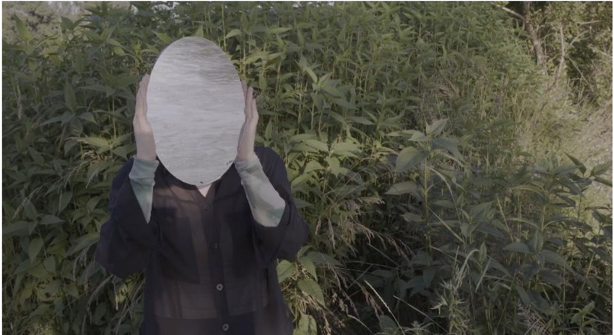
Lice prirode, 2024., detalj

Hodam kroz visoku travu i dolazim do rijeke gdje stavljam ogledalo ispred svog lica u kojem se reflektira odraz rijeke Save, njezin tok i kretanje vode. Spuštajući se niz stepenice sjedim okrenutih leđa gledajući u rijeku te čitam citat: „ Gdje čovjeku srce gleda, to oči ne vide, što čovjeku dušu dirne to ruka ne dotiče “.