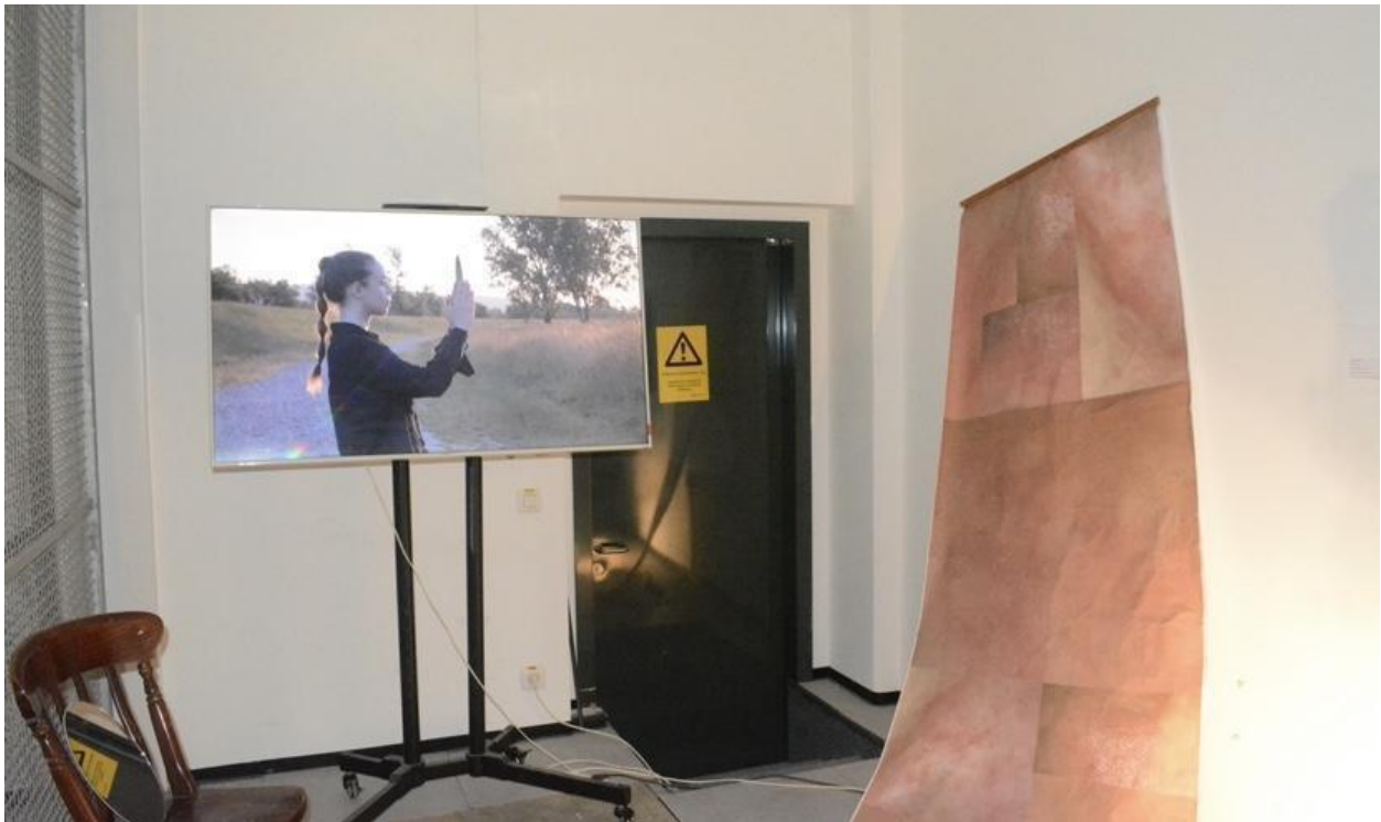
Lice prirode, 2024. Video instalacija u prostoru

Svi ovi performansi izvedeni na savskom nasipu, snimani su video kamerom i kasnije montirani (snimatelj i montažer: doc. art. Goran Škofić) Forma video performansa najbolje je odgovarala potrebama ovog rada jer sam ih tako dokumentirane mogla najvjernije predstaviti na drugom mjestu. Tijekom završne izložbe rad je bio postavljen kao prostorna video instalacija. Na monitoru su se u loop-u prikazivale sve izvedbe jedna za drugom, a u prostoru su kao eksponati bili postavljeni rekviziti iz svih performansa: ogledala, rola s printevima mog lica i majica s oslikanim rukavima.