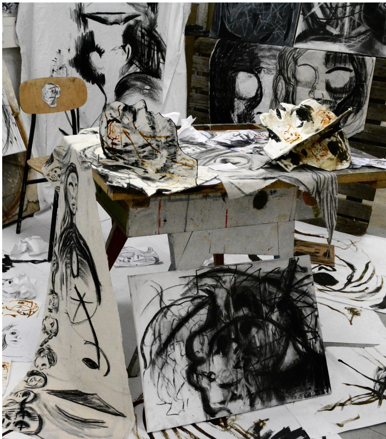
Ja i moj svijet, 2024., detalj.