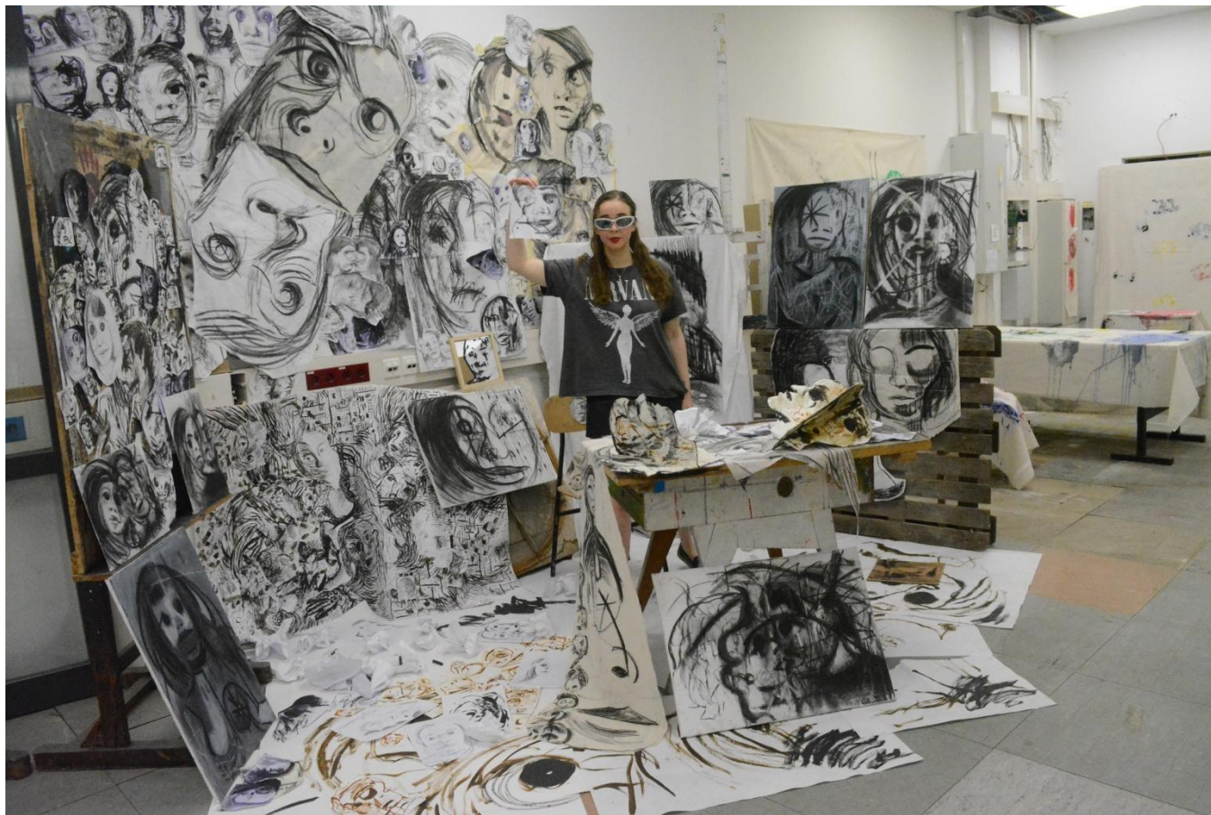
Ja i moj svijet, 2024. Kombinirana tehnika (papir, platno, ugljen, grafit, akril), dimenzije primjenjive