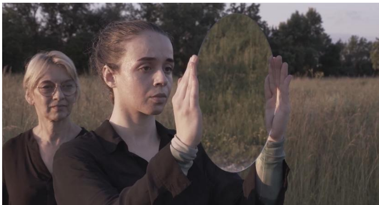
Lice prirode, 2024., detalj

Nastavljam hodati ravno i zstanem na sredini, okrećem se prema desnoj strani okomito dok mi stražnja strana pogleda prikazuje šumu. Tu stojim i držim dva leđima spojena ogledala. Gledam se u ogledalo s jedne strane dok ljudi hodaju oko mene promatrajući s jedne strane ogledala odraz moga pocrvenjelog lica, a s druge strane, odraz prirode i samih sebe u ogledalu. Ogledala koristim kao rekvizite za transformaciju prostora i kao sredstvo za istraživanje reprezentacije. Prikazujem svoje lice u ogledalu. U krupnom planu kao motiv bolne točke, predstavljam zabrinutost, nelagodu i strah.