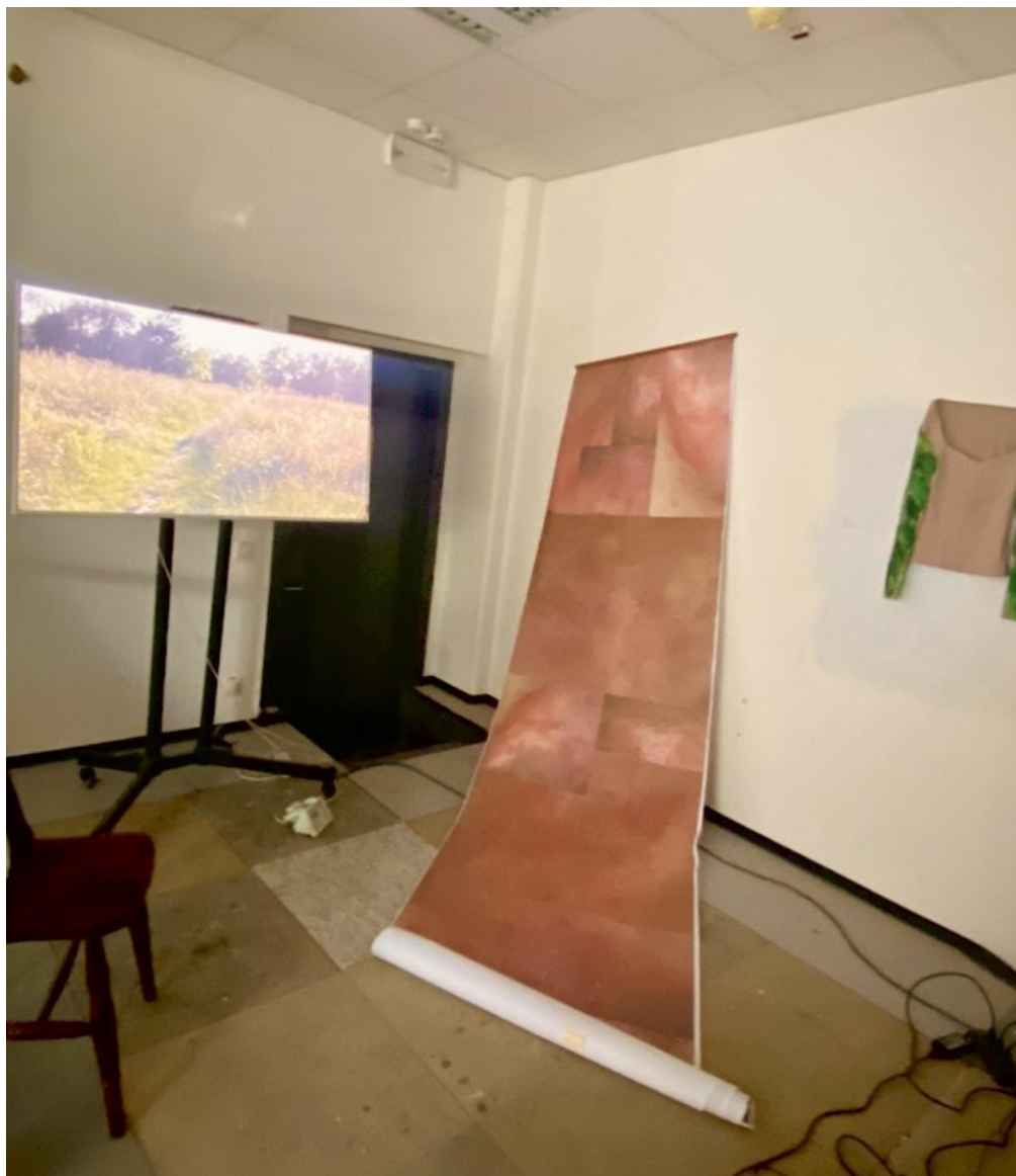
Lice prirode, 2024. Video instalacija u prostoru