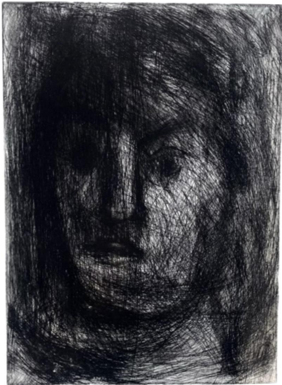
„Novi pogled na portret”, suha igla i bakropis, 2024.