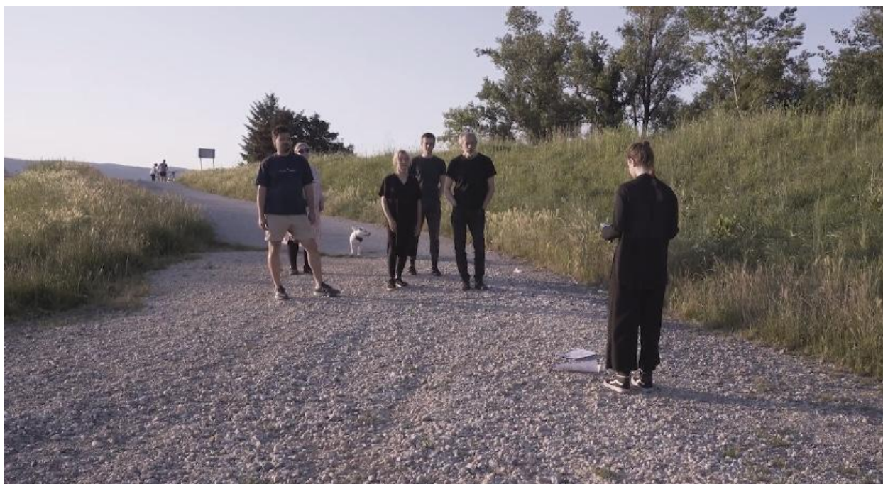
Lice prirode, 2024., detalj

„Hodanje do određenih puteva daje mi priliku da usporim, da se vratim u svoje tijelo kroz intiman odnos prema prirodi. Kuda idem slijede me gorki koraci, donosi nemir. Sve se rumeni i crveni, neprestano i ne prestaje, emocionalno boli i boli. I sada lice vraćam u život, treba da cvjeta.”