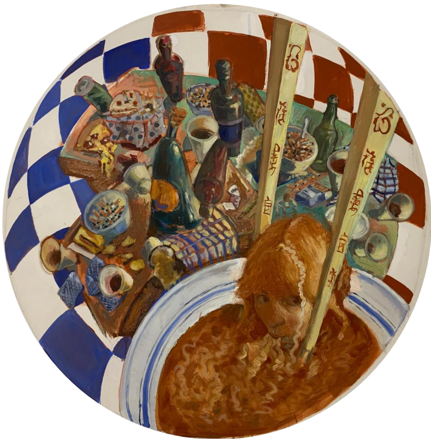
„Stol uvijek mora biti čist“ (150x150)