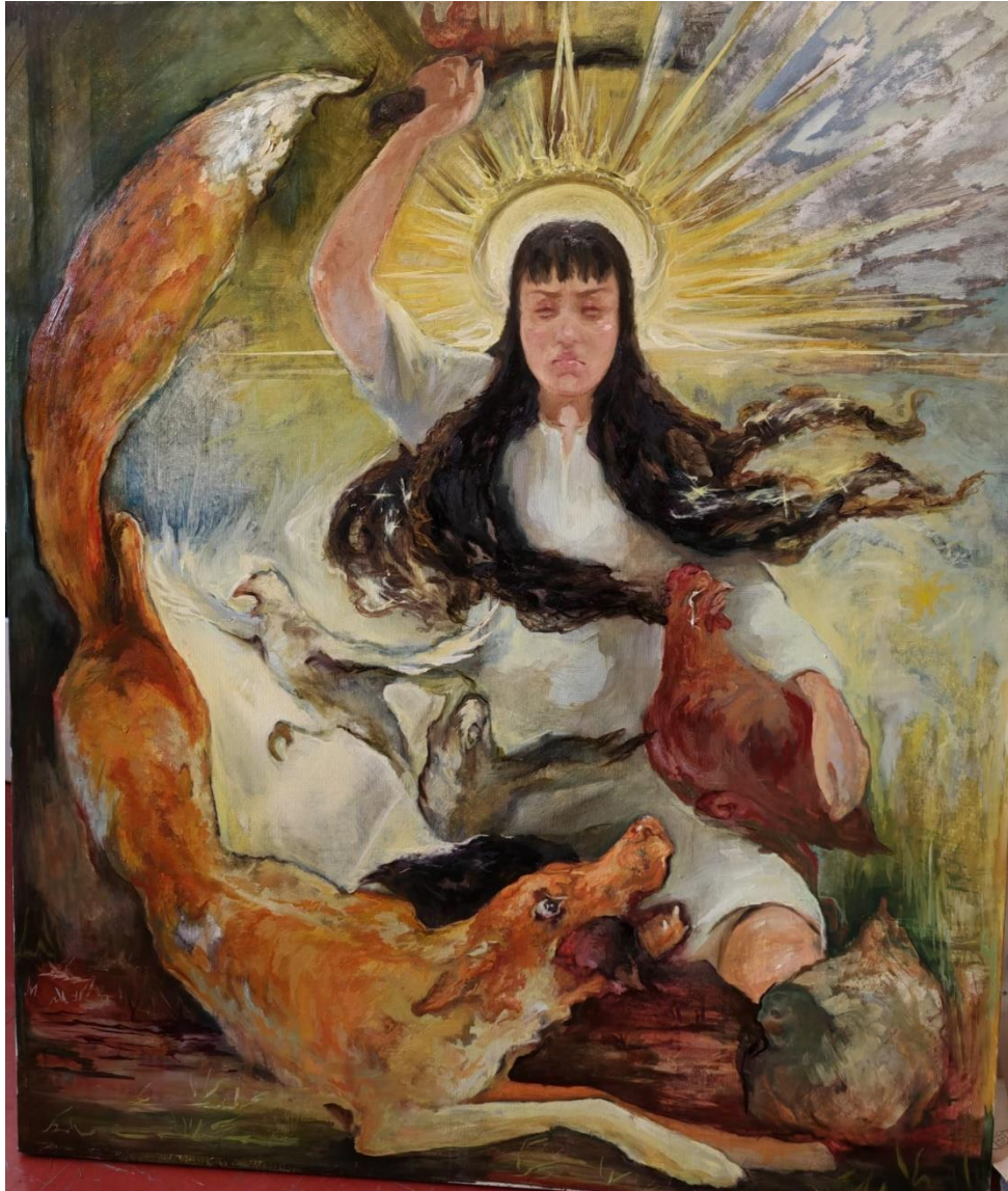
„All for a bright future“ 2024.,108×128, ulje na platnu