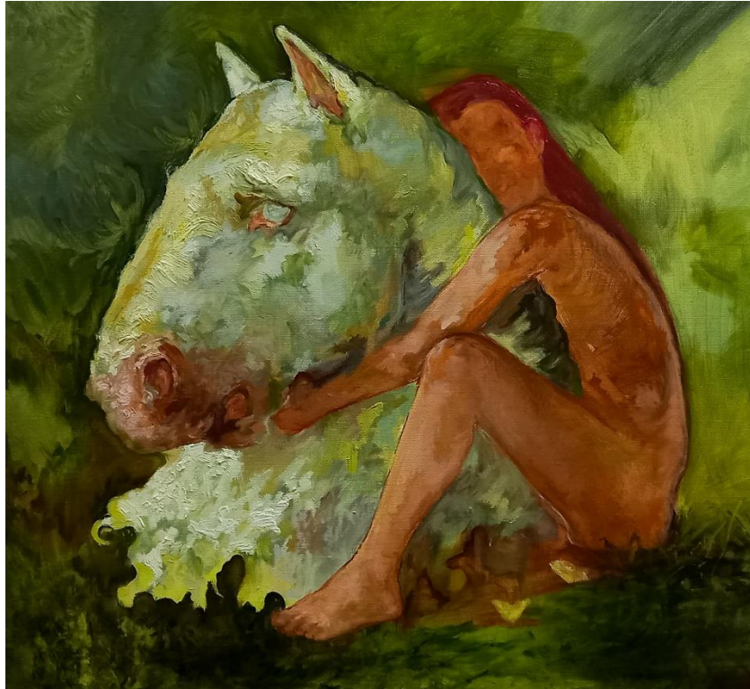
„Fear no more“ 2024.,ulje na platnu