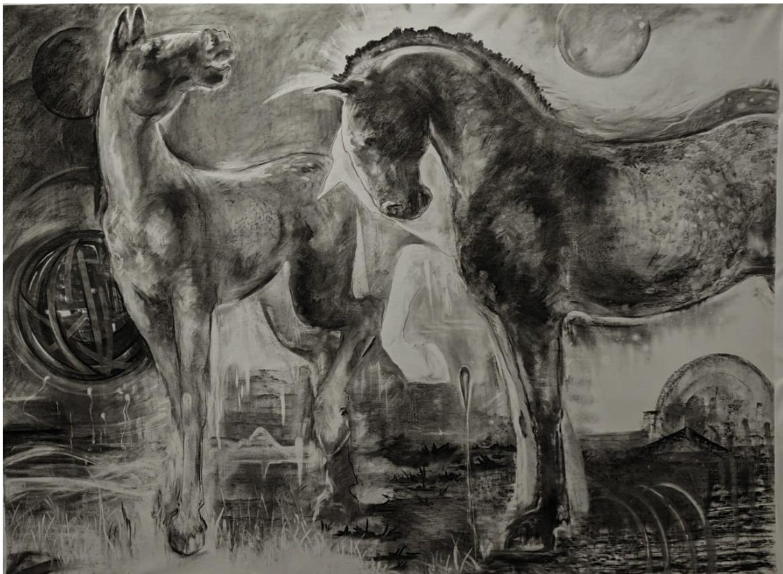
„Never End“ 2024.,140×196, ugljen na platnu