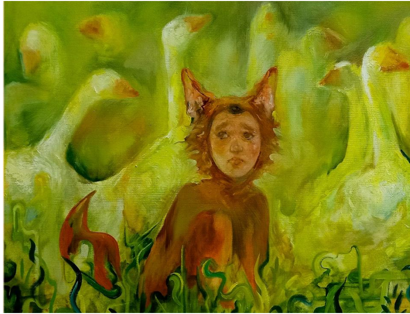
„Don't cry“ 2023.,akril i ulje na platnu