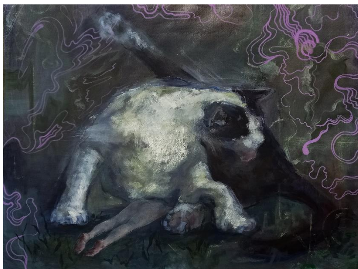
„Pure“2023.,akril na dasci