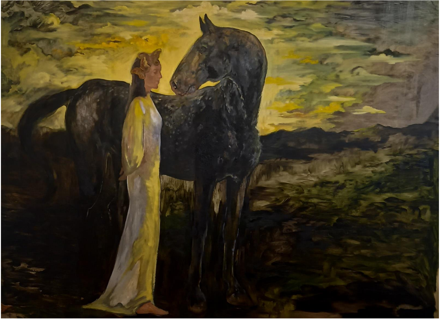
„U potrazi za srećom“ 2024.,188×228,ulje na platnu