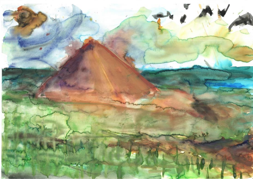
Slika 2: „Priroda stvari“