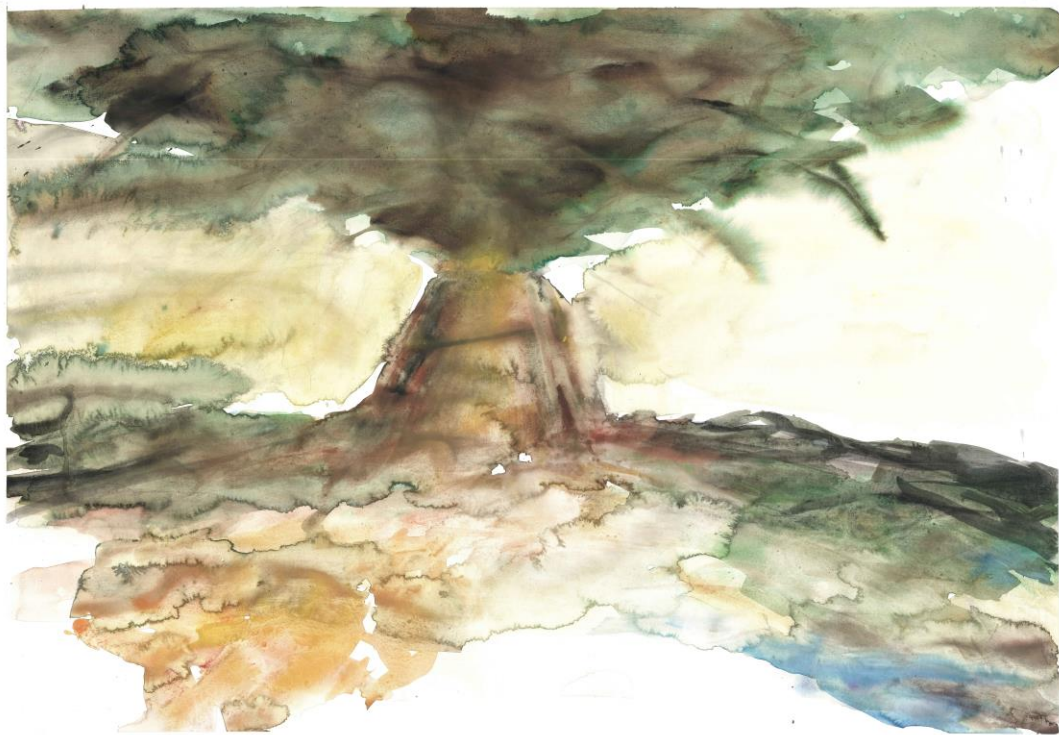
Slika 3: „Emisija hrbarosti“