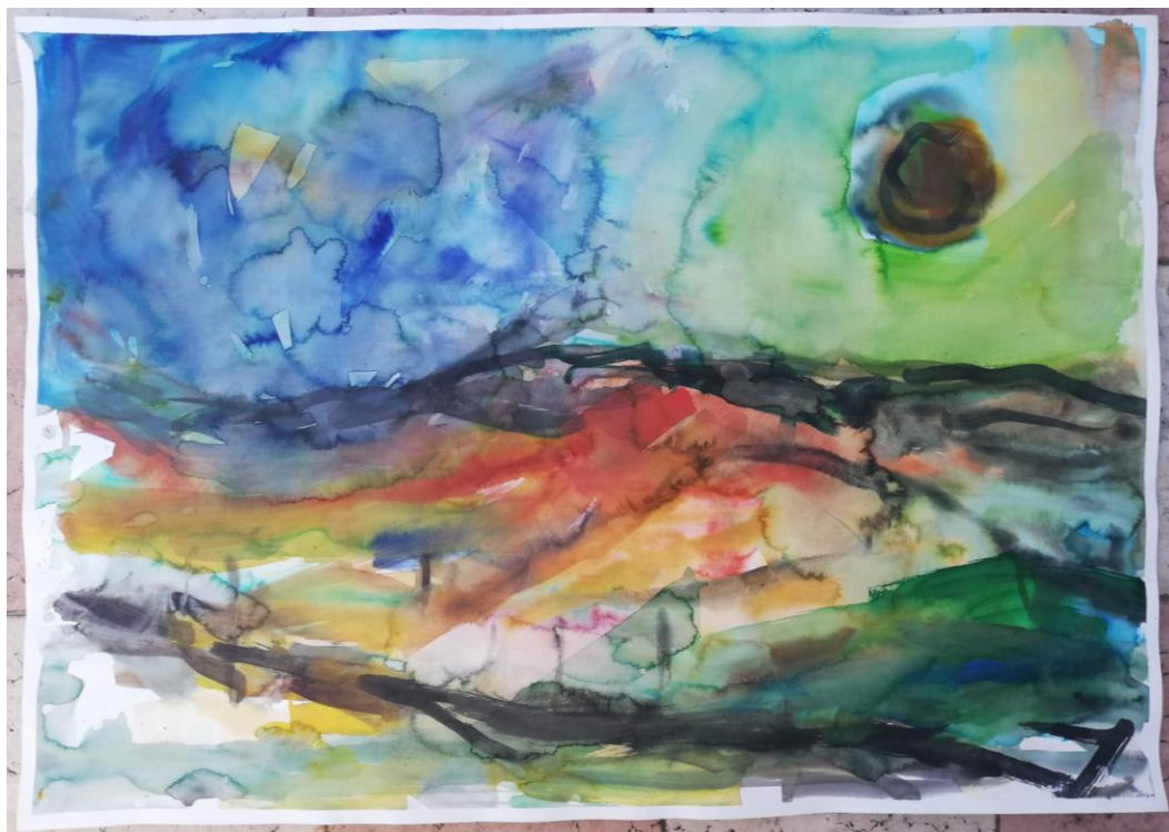
Slika 4: „Iskustvo“