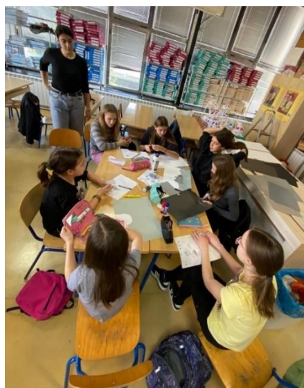
Fotografija 2: Izrada kolaža, prvi susret