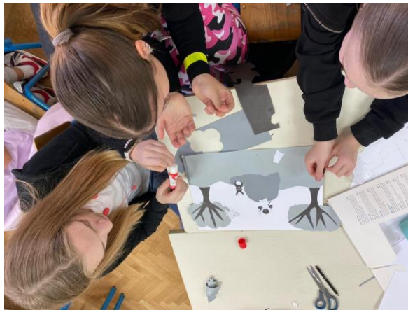
Fotografija 3: Dovořavanje kolaža, drugi susret

Drugi je susret započeo prezentacijom te uvodnim slajdom na kojemu su sadržane informacije o tome što se od učenica očekuje. Učenice su dovršile predloške u kolažu, a završeni su predlošci fotokopirani i isprintani na papir A3-formata kako bi se originalni predlošci očuvali. S učenicama je potom provedena metoda oluje mozgova – potaknulo ih se na zajedničku suradnju, tj. na to da odluče kako spojiti dvije ideje u skladnu cjelinu s obzirom na to da su korištene različite perspektive. Učenice su se brzo zainteresirale i aktivno su sudjelovale. Posljednji se je zadatak ticao određivanja kromatske boje likova s predložaka kako bi se unaprijed što bolje pripremile za oslikavanje.