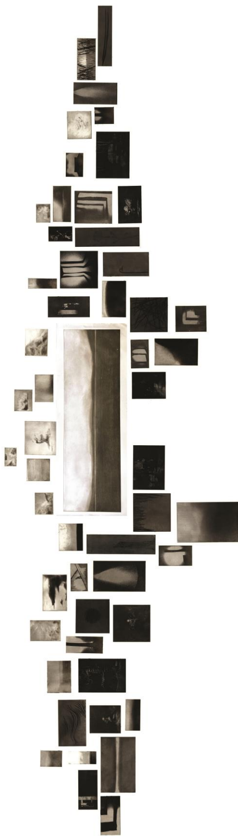
( slika 8., rekonstrukcija rada „Iz melankoličnog dnevnika“ )