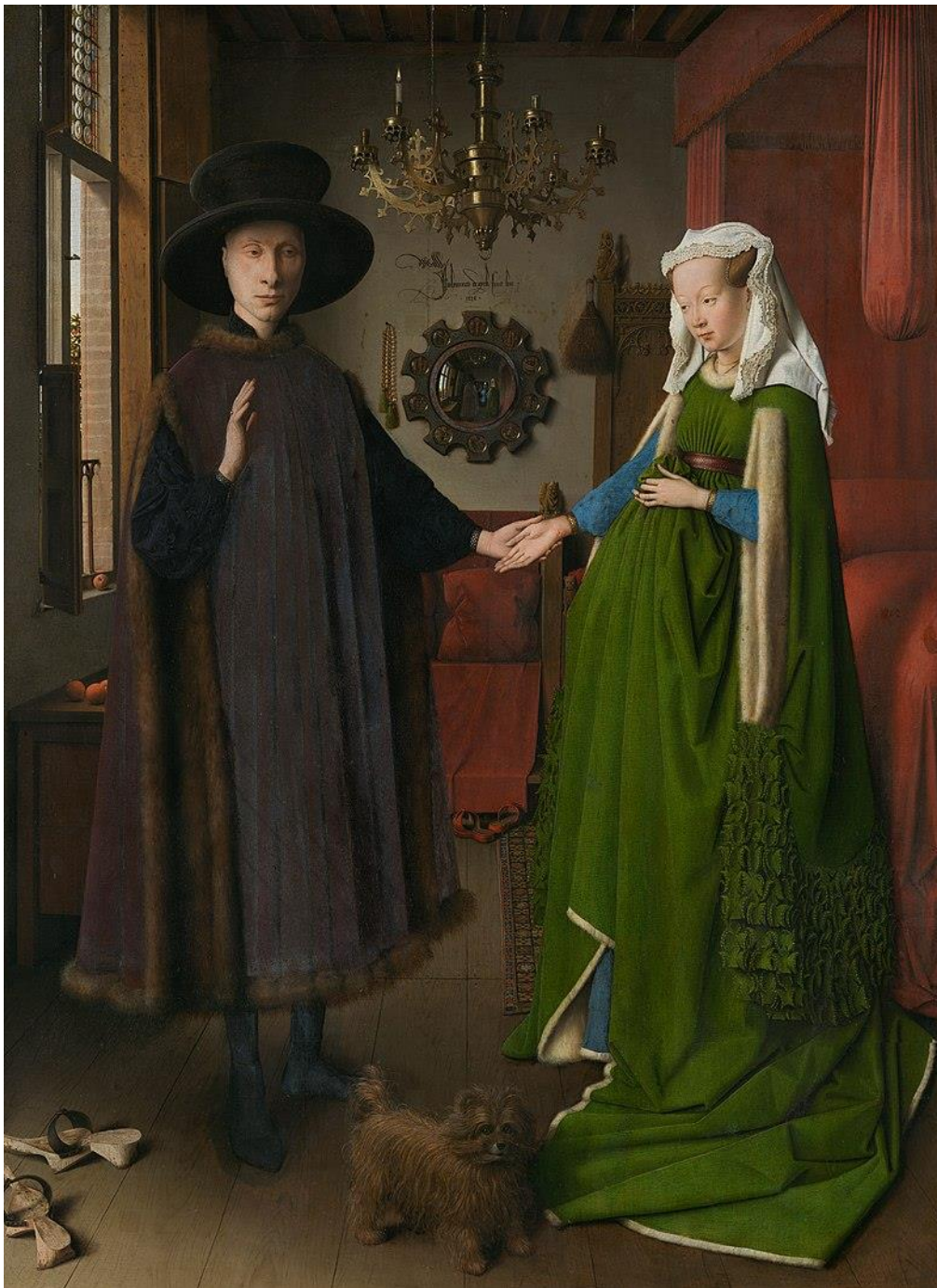
(slika 7. Jan van Eyck, Portret Arnolfinijevih , 1434., ulje na dasci, 82x60 cm, The National Gallery, London)

kao stvaran događaj u vremenu i prostoru. Iluzija bezvremenosti i nedefiniranog svijeta se urušava, slika postaje apsolutno stvarna. Odsutni likovni su gurnuti u postojeći svijet, fantazija postaje stvarnost i riječima koje su danas postale toliko prisutne u grafiti kulturi svijeta — „je bio ovdje“ van Eyck vapi za priznavanjem stvarnosti u slici, on ju nameće gledatelju. A što više zaziva melankoliju nego li protivljenje društveno priznatoj formi i propitivanje percepcije realnosti.