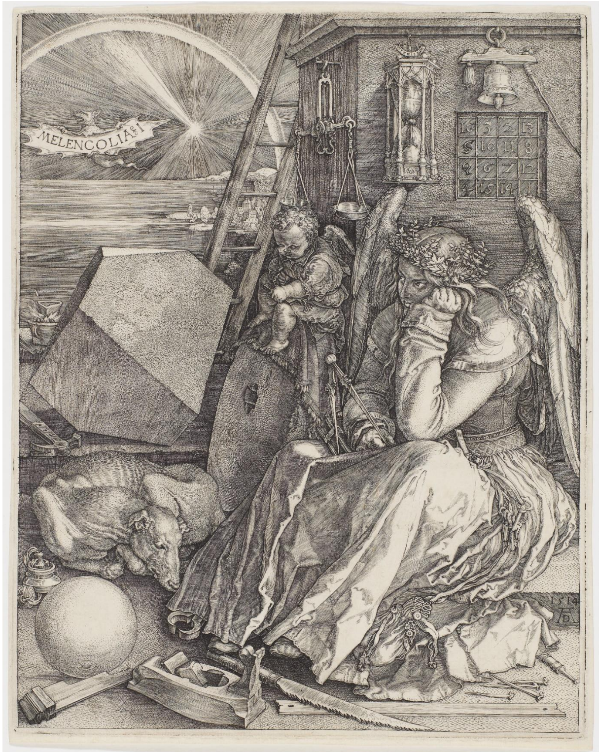
(slika 2. Albrecht Dürer, Melankolija I. , 1514., bakrorez, 31 x 16 cm, The Metropolitan art museum, New York)

propitivanja melankolika, stavili su ga na poziciju Boga, jer nisu prihvaćali njegovu svemoć (Földényi, 2016.).