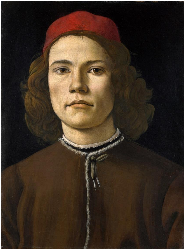
(slika 3., Sandro Botticelli, Portret mladića , 1480., ulje na dasci, 37,5x28,3 cm, National Gallery, London)

slabljenjem ideologije srednjeg vijeka i promjenom odnosa Bog-čovjek, pojam genij i mogućnost stvaranja počinje se pripisivati pojedincu, no on tada i prihvaća teret te riječi (Földényi, 2016.). Ljudi koji su obdareni genijalnošću nisu mogli izbjeći njegove neizbježne posljedice, postali su svjesni svojih neusporedivih vještina ali i svojih ljudskih slabosti i ograničenja. Nitko ih ne ograničava osim njih samih, postaju svoj najgori neprijatelj. Osjećaju se bespomoćno pred sobom i očaj koji to stanje izaziva navodi ih na samodestruktivno ponašanje. „Pravi genij uništava samoga sebe – obavezan je povezati se sa smrću. Genij dovodi čovjeka do samog ruba smrti i obrnuto: onaj tko dođe na sam rub smrti je za dlaku odvojen od genijalnosti.“ (Földényi, 2016. str. 146.). Jaka naklonost suicidu (koja se javlja i u antici i srednjem vijeku) među melankolicima govori o neprestanoj napetosti između kreativnosti života i konačnosti smrti. Onaj tko stvarno uvidi jedinstvenost postojanja, i dalje pokuša stati licem u lice sa smrću, neizbježno će postati genij. Renesansni melankolik postavio je temelje za tumačenje melankolije sve do danas (Földényi, 2016).