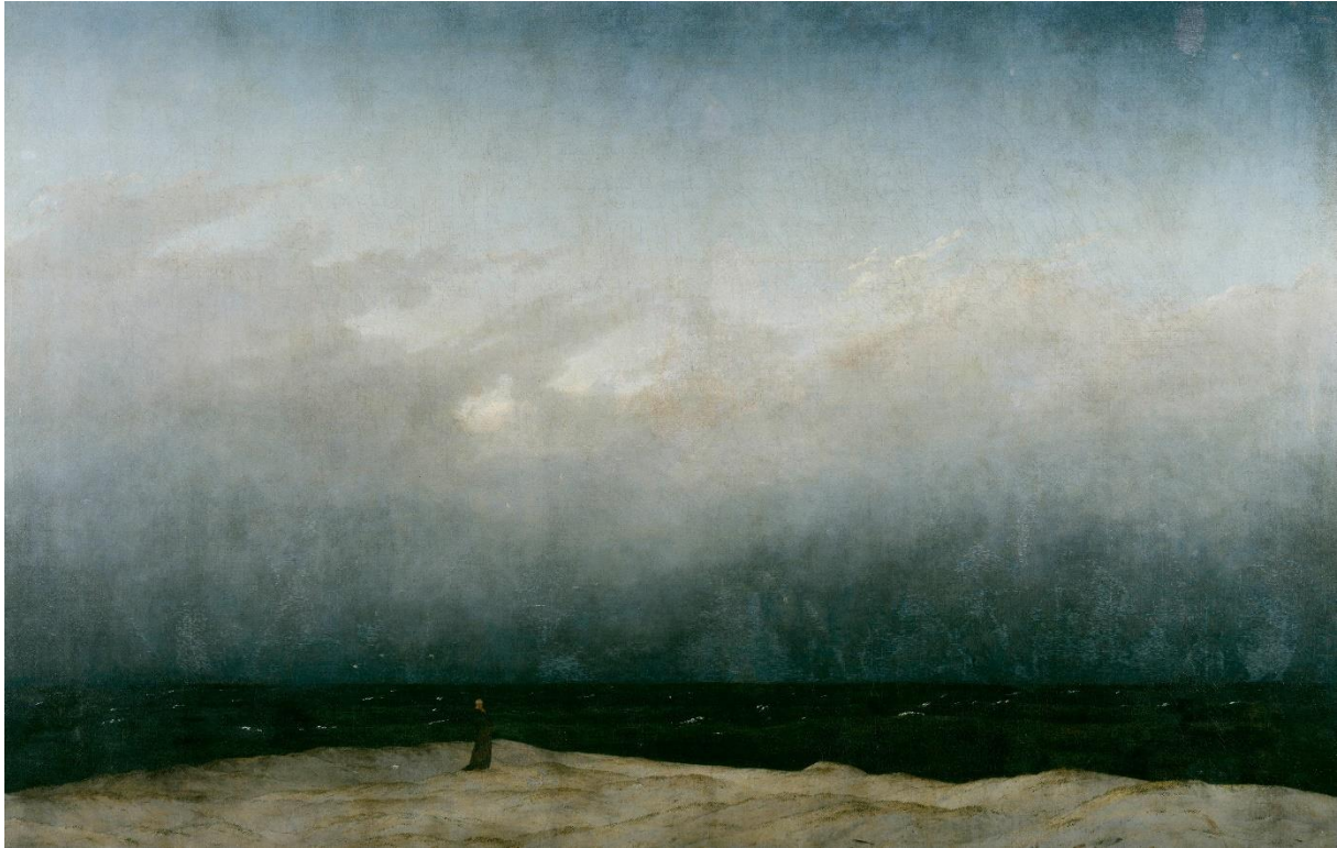
(slika 4. Caspar David Friedrich, Redovnik uz more , 1809.-10., ulje na platnu, 108x 170 cm, Alte Nationalgalerie, Berlin)