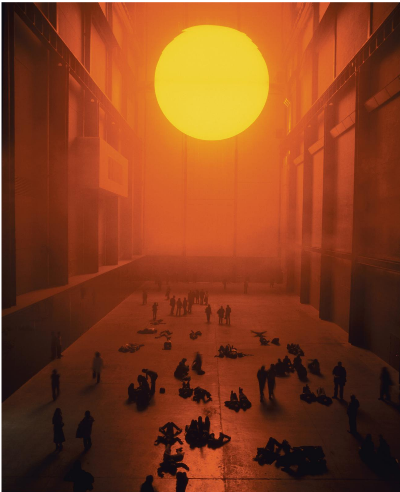
(slika 6. Olafur Eliasson, Projekt vrijeme , 2013., prostorna instalacija)