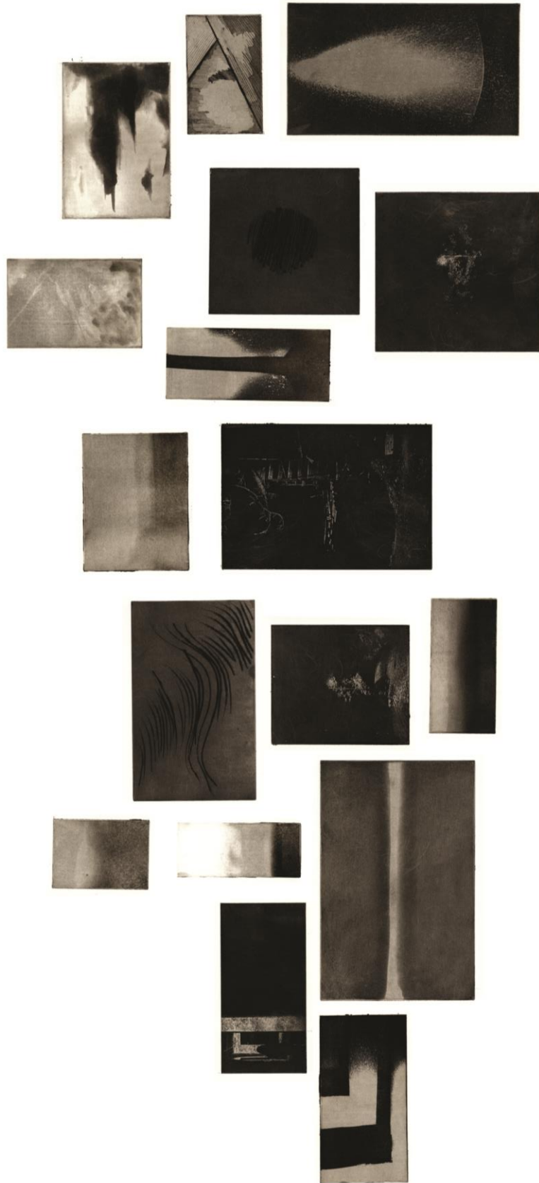
(slika 11. detalj lijevog dijela rada)