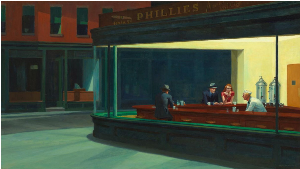
(slika 5., Edward Hopper, Noćne ptice , 1942., ulje na platnu, 84x152 cm, Institut za umjetnost Chicago)

melankolije. Melankolik ne želi biti definiran a težnja modernog društva prema definiranju i imenovanju svega rezultira s još više dosade, uklanja vrijednosti koje slučajnošću nastaju u stvarima, nastaje osjećaj ispraznosti (Földényi, 2016.). Sa slijepim prihvaćanjem definicija društvo postaje podložno represiji i samoobmani, gubi se mogućnost kritičkog promišljanja. Sve postaje dostupno svima, a melankolija kao stanje koje je omogućeno samo izabranim pojedincima postaje neprihvatljivo. Svijet tvrdi da sve probleme može riješiti u praksi, tako da i melankolija postaje samo još jedan problem na listi.