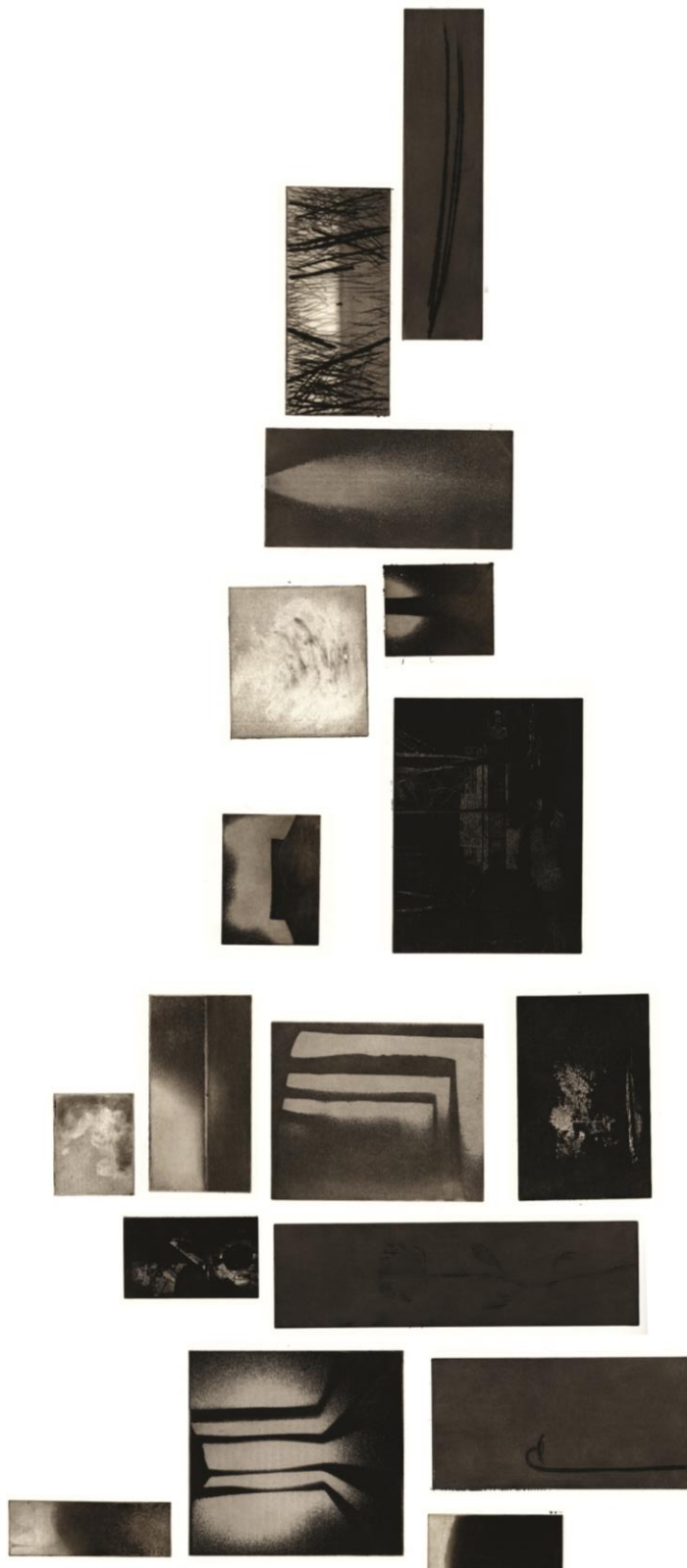
(slika 9. detalj desnog dijela rada)