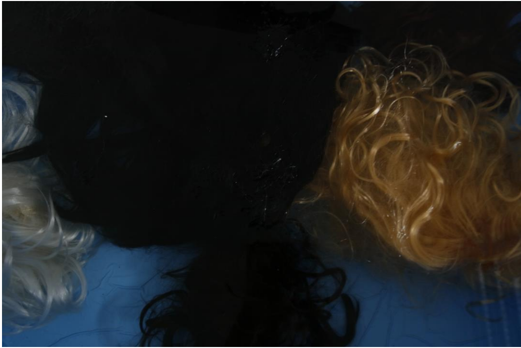
Sl. 4. Kiparska instalacija Skok su sebe , detalj