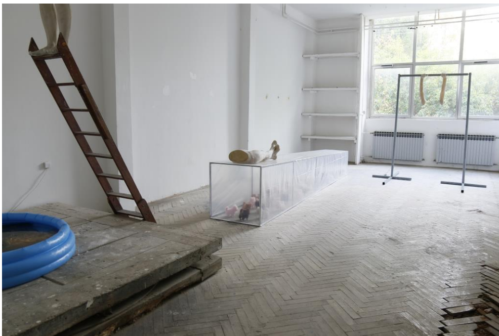
Sl. 12. Izložba Vertigo