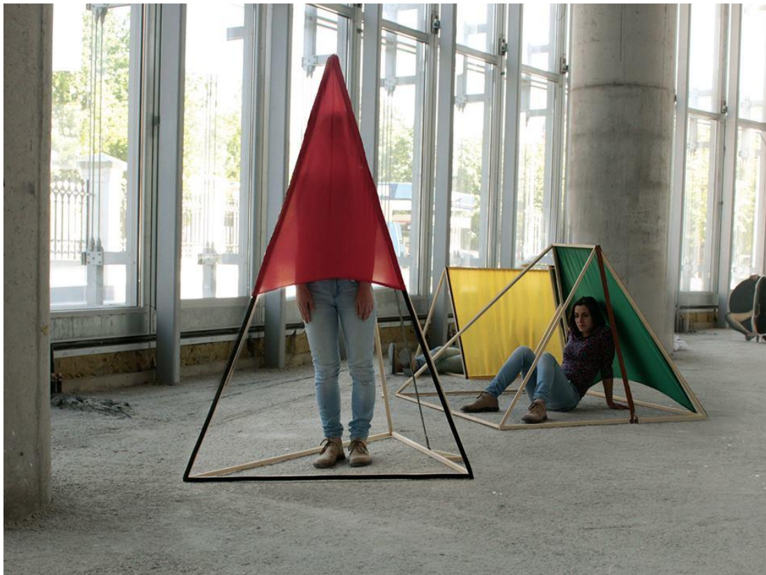
Sl. 2. Instalacija Moj kamp , galerija Kulturni centar, Eurodom, Osijek, 2017.

odvajanja od prošlosti. Igra perspektive je ponajviše izražena fotografijom koja pluta po bazenu i prikazuje pogled odozgo, pa gledatelj na taj način može promatrati i perspektivu onoga tko je gore, to jest mene. Na stropu iznad bazena se nalazi ogledalo čiji odraz upotpunjuje igru perspektive koja se referira na prošle, slikarske radove. Kosa je dio tijela koji se konstantno mijenja, raste, skraćuje se i otpada te je sastavni dio identiteta. Osim što je pokazatelj karakteristika i statusa pojedinca, ona, ovdje u formi vlasulja koje plutaju u bazenu odvojene od svojih vlasnika simbolizira moj identitet kao metaforu za rasulo integriteta i izgubljenosti.