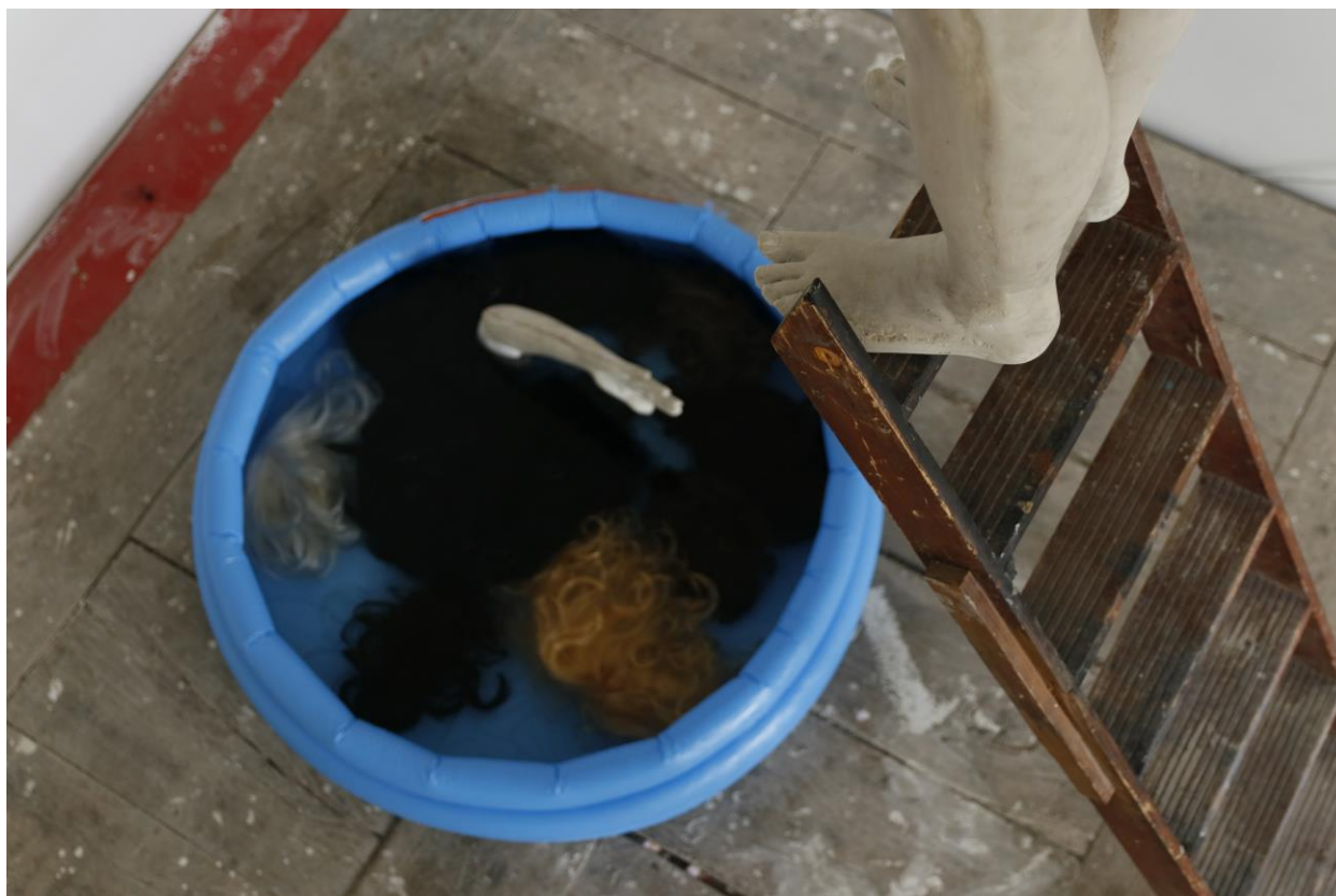
Sl. 6. Kiparska instalacija Skok su sebe , detalj, pogled odozgo