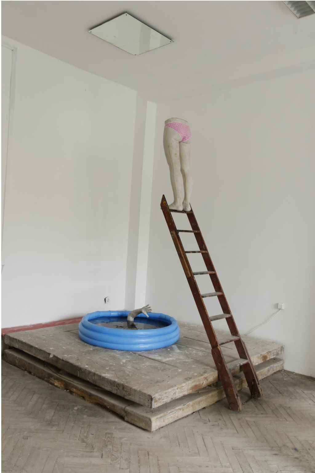
Sl.3. Kiparska instalacija Skok u sebe