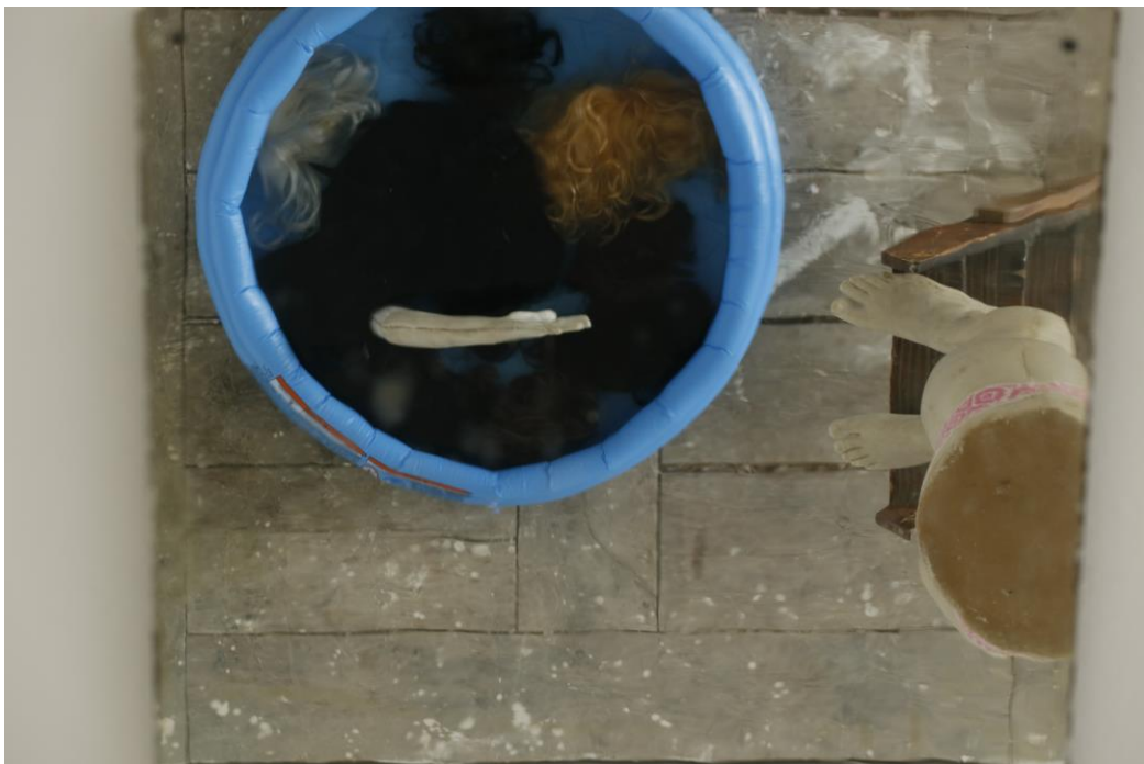
Sl. 5. Kiparska instalacija Skok su sebe , detalj, odraz u ogledalu