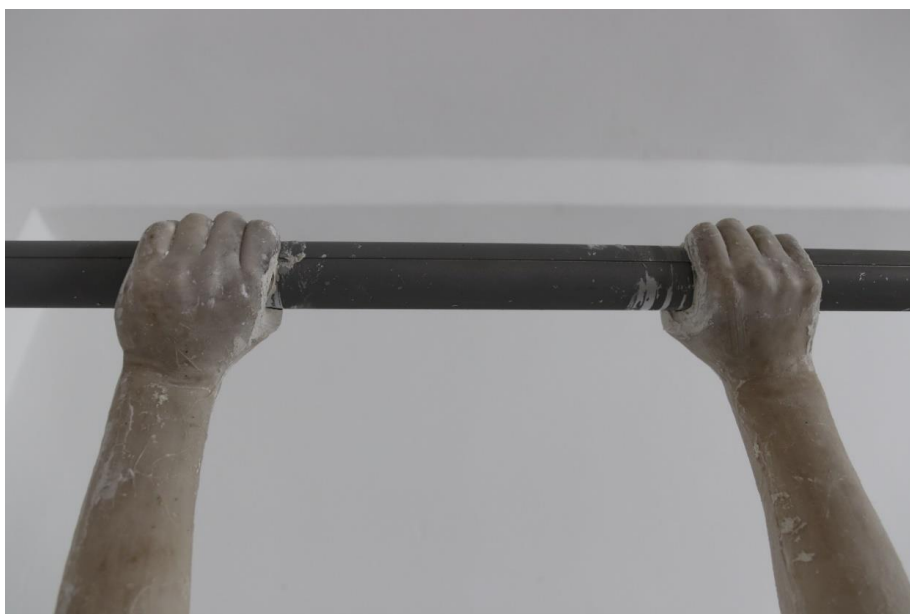
Sl. 10. Kinetička skulptura Vrtnja , detalj

Autobiografski elementi se pojavljuju i u ovom radu, referiram se na djetinjstvo u kojem sam provela niz godina trenirajući gimnastiku, pa rad asocira na gimnastičku spravu (dvovisinske ruče). Tako svoj identitet opet poistovjećujem sa stvarnim objektom koji evocira prošlost postavljajući na njega odljeve svojih ruku u neprekinutoj vrtnji. Nadrealnim prikazom sjećanja propitujem nesvjesno i potisnuto stanje u kojem se prošlost prepliće sa sadašnjosti i preobražava iz lijepih sjećanja u stanje neuroze. Radom negiram fizičke zakone i njegove odnose jer se prikazana radnja u stvarnosti ne bi mogla izvoditi na ovaj način te se ukazuje kao trag realnog.