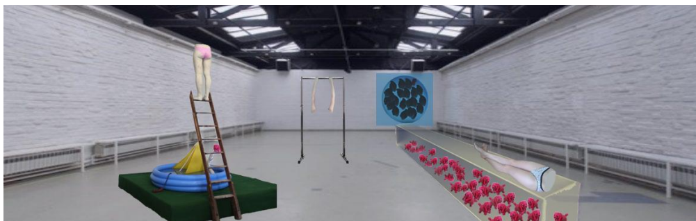
Sl.7. Digitalni prikaz u prostoru, fotomontaža

Odljev vlastitih nogu prisutan je i u instalaciji Potonuće (Sl.) no ovoga puta su one prekrižene u ležećem položaju i položene na dugačak prozirni podest. Podest je u dijelu na kojem se nalazi odljev nogu širi i viši, dok se prema krajevima sužava u nagibu. Naziv rada Potonuće se uprizoruje kroz manipulaciju perspektive same instalacije u kojoj dugačka pravokutna konstrukcija „tone“ te se smanjuje u svojoj visini. Unutar podesta zatvorenog prozirnog mutnim najlonom nalaze se igračke-psi koji laju i hodaju, sudaraju se međusobno i sa opnom od najlona. Psići simboliziraju moju agresiju, nervozu ali i zbunjenost, raspad sistema, gubljenje orijentacije i slična stanja. Unutrašnju napetost pokušavam odmaknuti od sebe te ju kanaliziram kroz objekte-psiće zatvorene u najlonski kavez. Iako je i dalje prisutna, pravim se kao da je nema. Moje mirno, opušeno tijelo koje leži na podestu u položaju koje asocira na čin odmaranja, postavljeno je u kontrastu na događanja ispod njega.