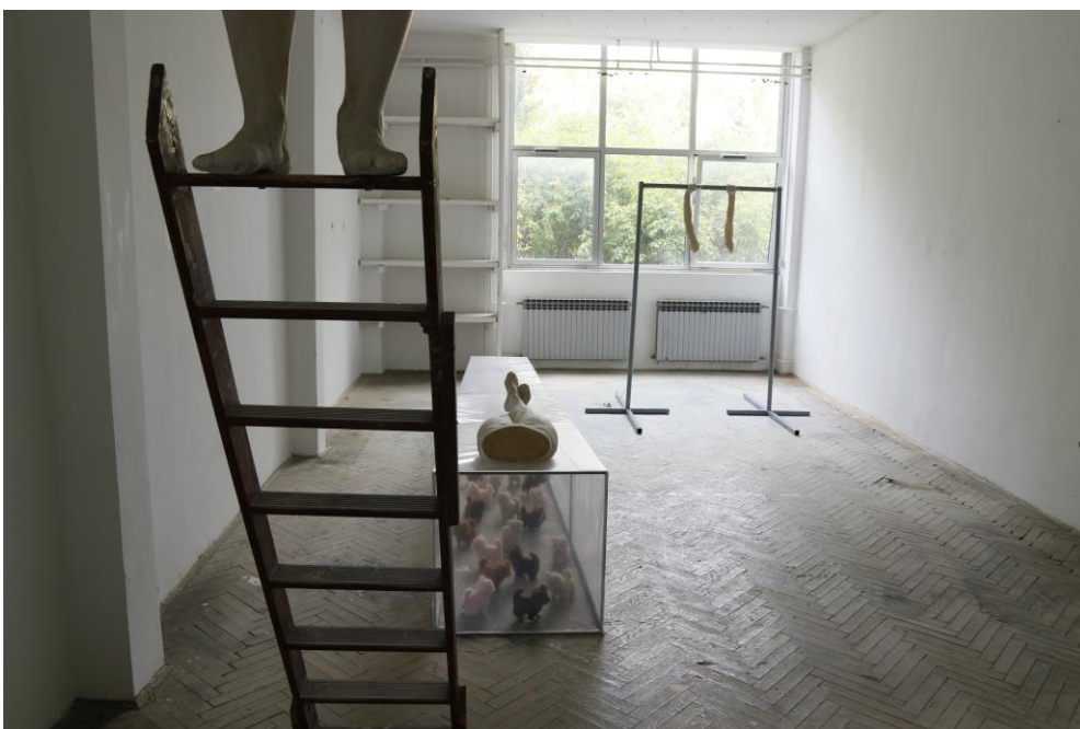
Sl. 13. Izložba Vertigo