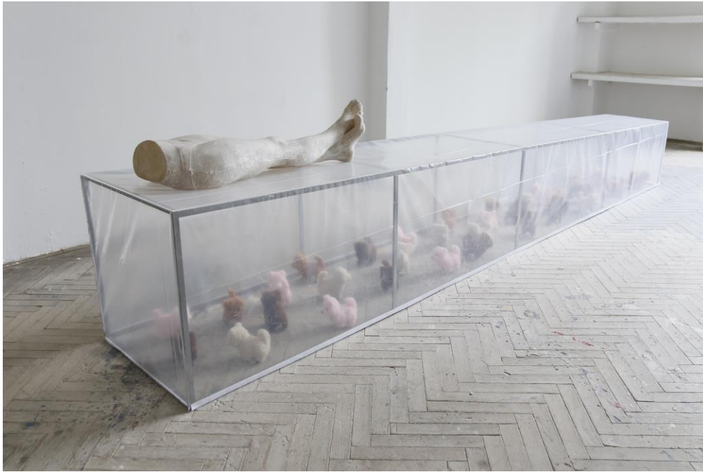
Sl.8. Kiparska instalacija Potonuće