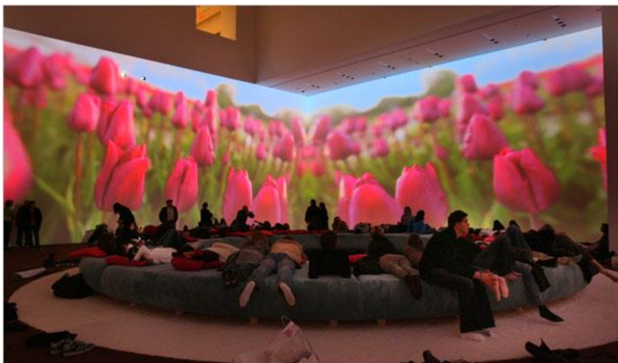
Sl.21. Pipilotti Rist, Pour your body out , 2008.

Švicarska umjetnica Pipilotti Rist koja se ponajviše bavi istraživanjem medija videa za kojega tvrdi da može imati i slikarske kvalitete, što možemo primjetiti u njezinim radovima koji su puni boja i razigranosti ali i nadrealnih prizora. Site specific instalacija Pour your body out 9 , veličine 7354 metara kvadratnih, umjetnica je napravila u atriju Muzeja za modernu umjetnost, Manhattan, u kojem na provokativan način spaja fantaziju i stvarnost.