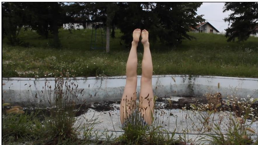
Sl. 14. Isječci iz filma Vertigo