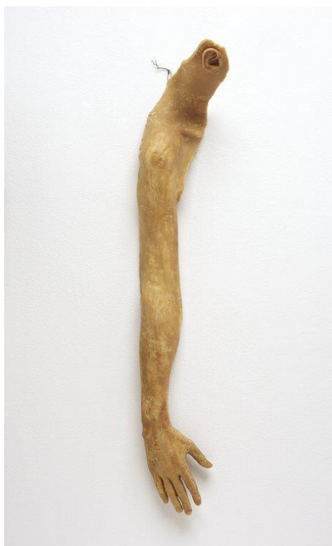
Sl.17. Bruce Nauman, From hand to mouth , 1967.

Bruce Nauman (1941.) je poznati američki umjetnik koji se osim kiparstva bavi i video medijem, grafikom, crtanjem i performansom. Umjetnik često koristi odljeve vlastitog tijela u svojim radovima kao što je From hand to mouth , 1967., reljefna skulptura lijevana u vosku, izuzetno fragilan rad sklon deformaciji. Autor na humorističan i doslovan način prevodi frazu „Iz ruke u usta“ čije se značenje definira kao zadovoljavanje trenutnih potreba u nedostatku novčanih sredstava. 5