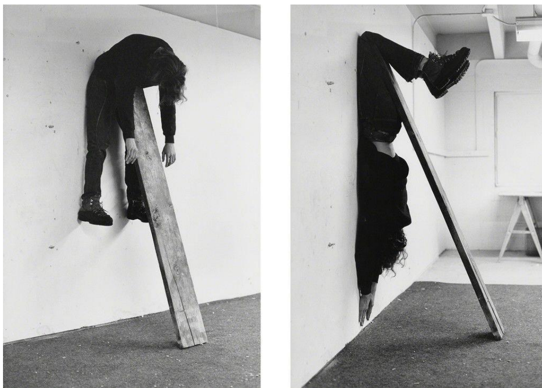
Sl.19.Charles Ray, Plank peace , 1973.

Charles Ray (1953.) američki kipar poznat po svojim neobičnim i zagonetnim skulpturama koje gledateljske percepcijske prosudbe dovodi u pitanje na neočekivane načine. Plank peace , (1973.) se sastoji od dvije crno – bijele fotografije velikog formata koje prikazuju umjetnika prikovanog na zid pomoću drvene daske. Umjetnik je stvorio djelo pomoću vlastitog tijela, eksperimentirajući s načinima kako postići ravnotežu bez dokaza kako je to postigao. 7