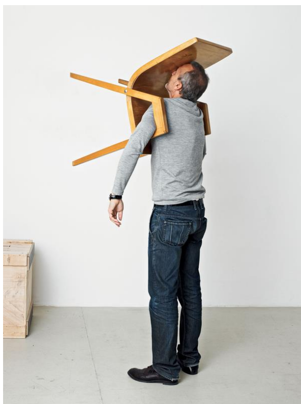
Sl.18. Erwin Wurm, Idiot II , 2003.

Erwin Wurm je umjetnik poznat po izražavanju u formi one minute sculptures koje je radio do kraja 1980-ih godina. U radovima je izvodio radnje u kojima umjetnik ili model na specifičan način komuniciraju sa svakodnevnim predmetima i te apsurdne trenutke je dokumentirao fotografijom i videom. Ispitivanje same definicije skulpture se ne odnosi samo na ljudska bića, već i na predmete s kojima interagira. 6