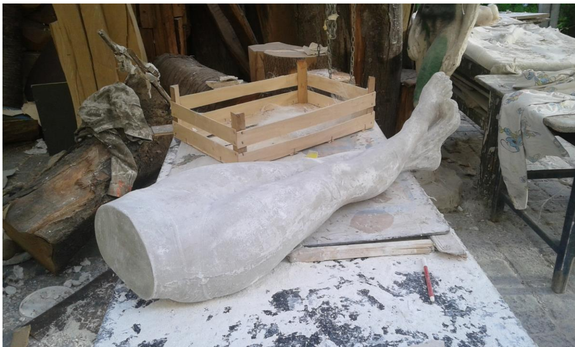
Sl. 15. Proces lijevanja