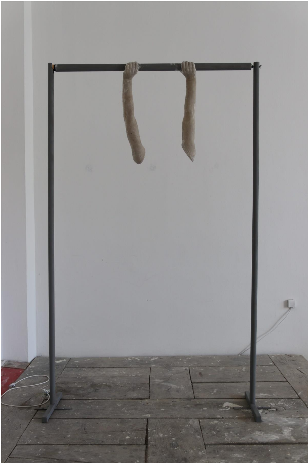
Sl. 11. Kinetička skulptura Vrtnja