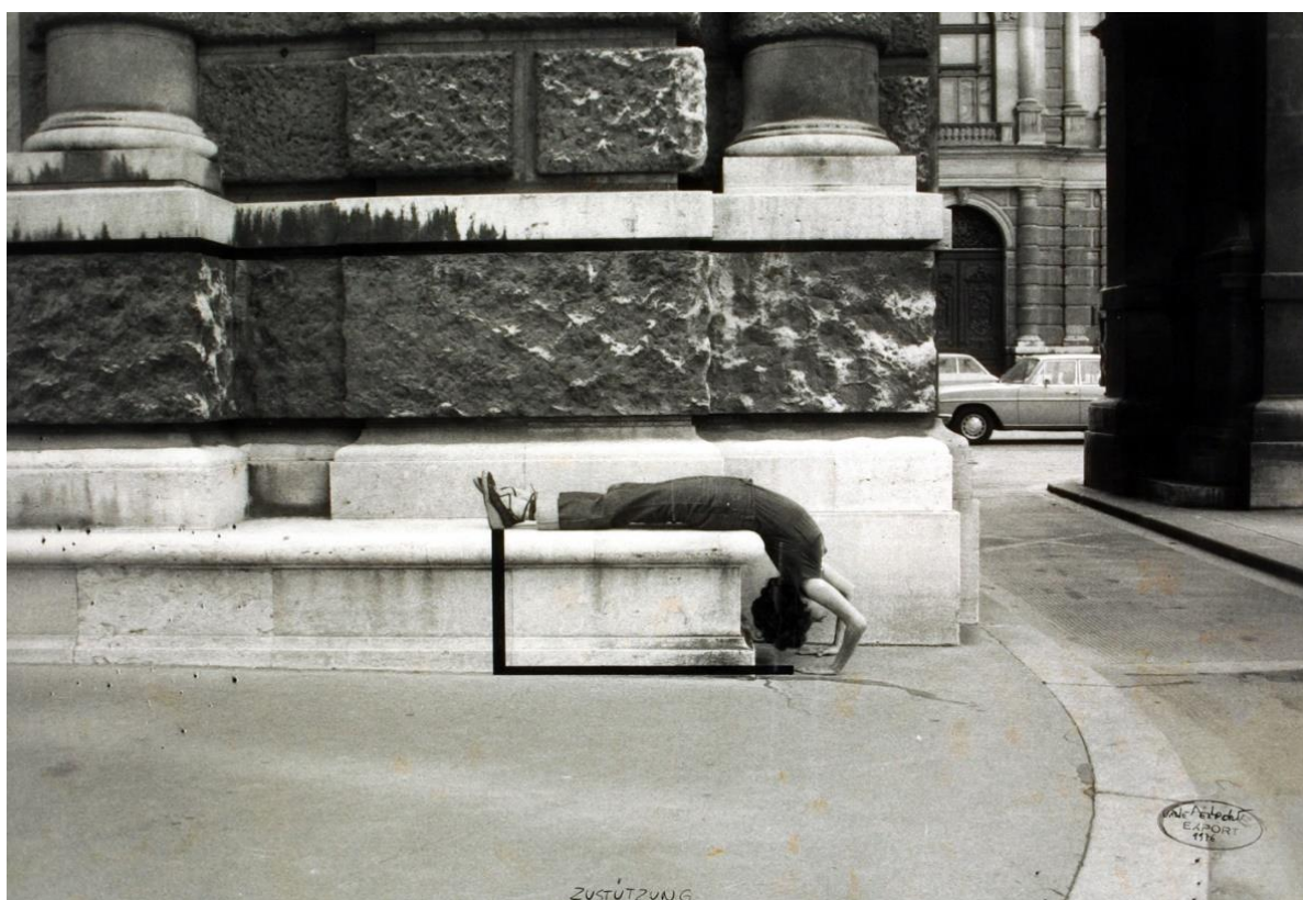
Sl.20.Valie Export, Body configuration , 1982.

Valie Export (1940.) suvremena je austrijska umjetnica poznata po svojim fotografijama i radikalnim izvedbama koje ulaze u javnost diskursom o ženskom tijelu i muškim pogledima. U seriji fotografija Body Configurations (1972.-82.) propituje mjesto žene u javnom prostoru i evocira odnos govora tijela i urbanog okoliša. Umjetnica svoje tijelo postavlja u određene položaje u gradu i postaje dio njegove arhitekture. 8