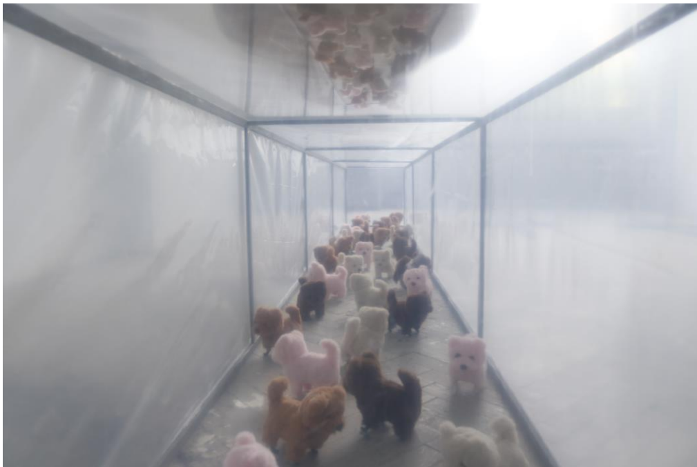
Sl. 9. Kiparska instalacija Potonuće , detalj