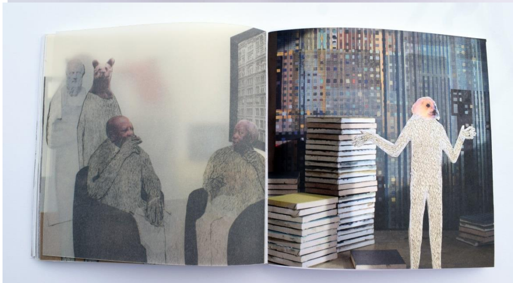
Homo Sapiens- Metamorfoze;

knjiga, 80 stranica, digitalni ispis; 150 g paus papir, 150 g ofset papir, 18 x 18 cm, 2017.