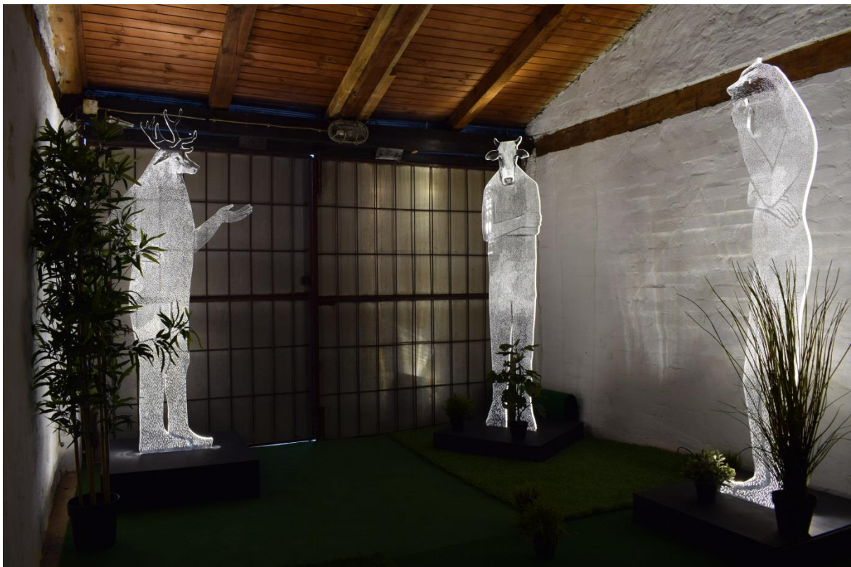
Homo Sapiens- Metamorfoze , instalacija; pleksiglas, mediapan, LED rasvjeta, umjetna trava, umjetne biljke; promjenjive dimenzije, 2017.

U radu Homo Sapiens- Metamorfoze prevladava ideja povratka prirodi, onom iskonskom, te proučavanje čovjeka i njegove uloge u svemiru. Povratak iskonskom, drevnom, odražava se i u plošnom, pomalo naivnom, načinu prikaza likova koji podsjećaju na umjetnost drevnog Egipta. Povratak prirodi, naivnom i iskonskom kontradiktorni su plastici i elektronicima od koje je rad načinjen. No, ideja rada nije nikakva kritika modernog doba niti noviteta koje ono donosi, već iskonski osjećaj za zajednicu, koja je u ovom slučaju čitav svijet sa svojom florom i faunom. U današnje vrijeme novih medija i digitalizacije gubi se neposredan kontakt čovjeka s prirodom što utječe na njegov duh.