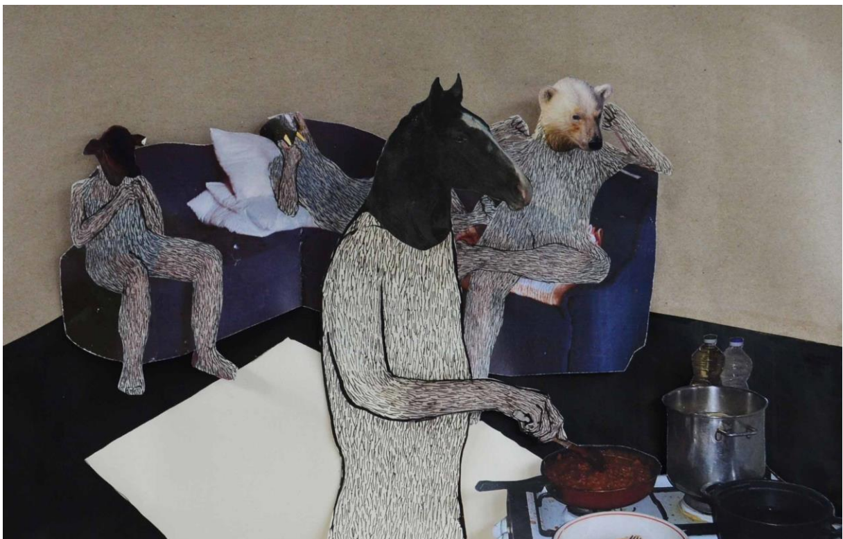
Ručak , kolaž, kombinirana tehnika, 28 x 20 cm, 2016.