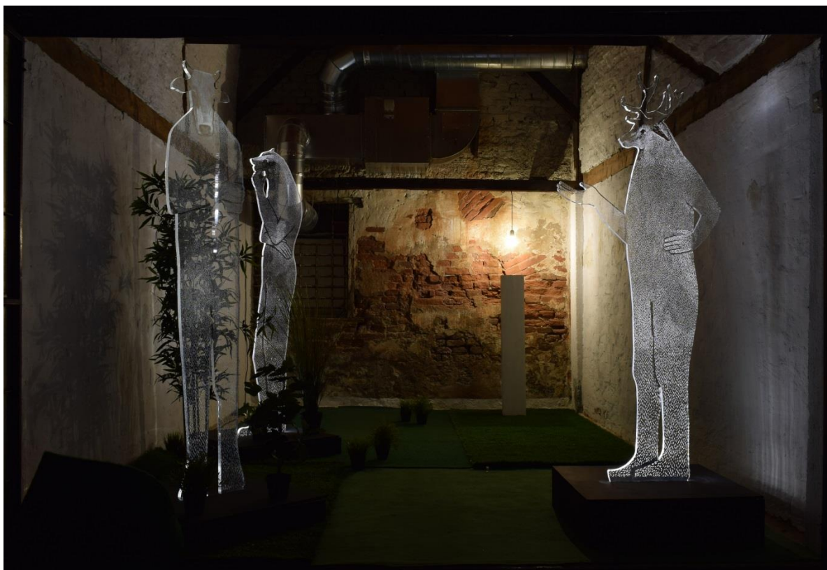
Homo Sapiens- Metamorfoze,

Ciklus radova započela sam malim kolažima koji su kombinacija fotografije i crteža. Iz starih časopisa izrezivala sam životinjske glave na koje sam nadocrtavala tijela i smještala ih u prostore. Isprobavala sam razne veličine formata, od minijatura do velikih kompozicija. Te kolaže stavljala sam u bijele kutije koje daju određenu intimnost prizorima ali su i odraz figurativnih kutija u koje se ljudi svjesno ili nesvjesno zatvaraju. Sada sam te radove uklopila u umjetničku knjigu koja je za mene neka vrsta ilustracije suvremenog društva. Knjiga koja se sastoji od printeva kolaža na pausu i fotografija zamišljena je kao slika grada, mjesta u kojem se čovjek često osjeća malo i izgubljeno u količini informacija, što je postignuto preklapanjima pausa. Cijela instalacija time zaokružuje sliku čovjeka, bića iz prirode koje je stvorilo kaotičan svijet, bez kojega bi suvremeni čovjek teško mogao preživjeti.