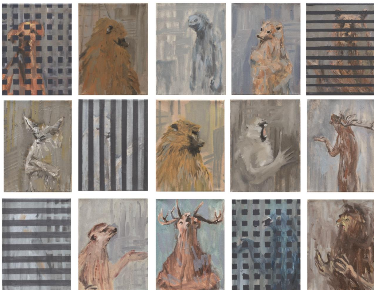
Communication breakdown , poliptih, ulje na platnu, 100 x 78 cm, 2016.

Proučavanje pojedinca u jednom trenutku postalo je istraživanje društva i njegovih struktura od kojih je neodvojiv. U slikama fokus mi se postepeno prebacio s životinjskih motiva na prostore u kojima se nalaze. Nastala je serija radova pod nazivom Distopijski prostori . Mnoštvo struktura koje se isprepliću u heterogenu masu oslikavaju današnji grad i društvo koje ga je stvorilo. Nizanjem pravilnih/nepравilnih oblika, njihovim preklapanjima i podudaranjem stvaraju se kaotični, distopijski prostori. Dok sam nizala strukture u likovnom smislu na umu sam imala primarno strukture društva. Ljudi su stvorili takve strukture koje su postale bića za sebe, poput Hobbesovog Levijatana, apstraktne organizacije u koje ljudi ulijevaju toliko povjerenja da je nemoguće zamisliti život bez njih te iako nekada nisu u službi pojedinca podilazimo im kako bismo ih održali na životu. Možda bi se moglo reći da današnje doba novih tehnologija sa sobom povlači neku društveno-humanističku krizu, a možda je to samo još jedna u nizu promjena koje su se oduvijek događale.