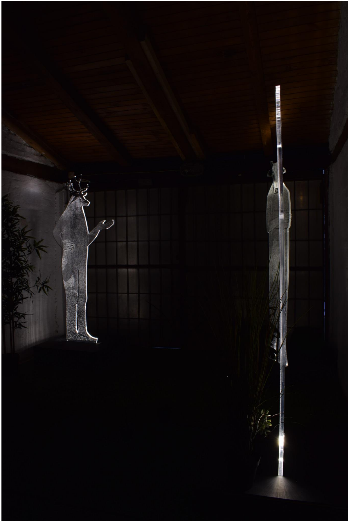
Homo Sapiens- Metamorfoze , instalacija, pleksiglas, LED rasvjeta, promjenjive dimenzije, 2017.