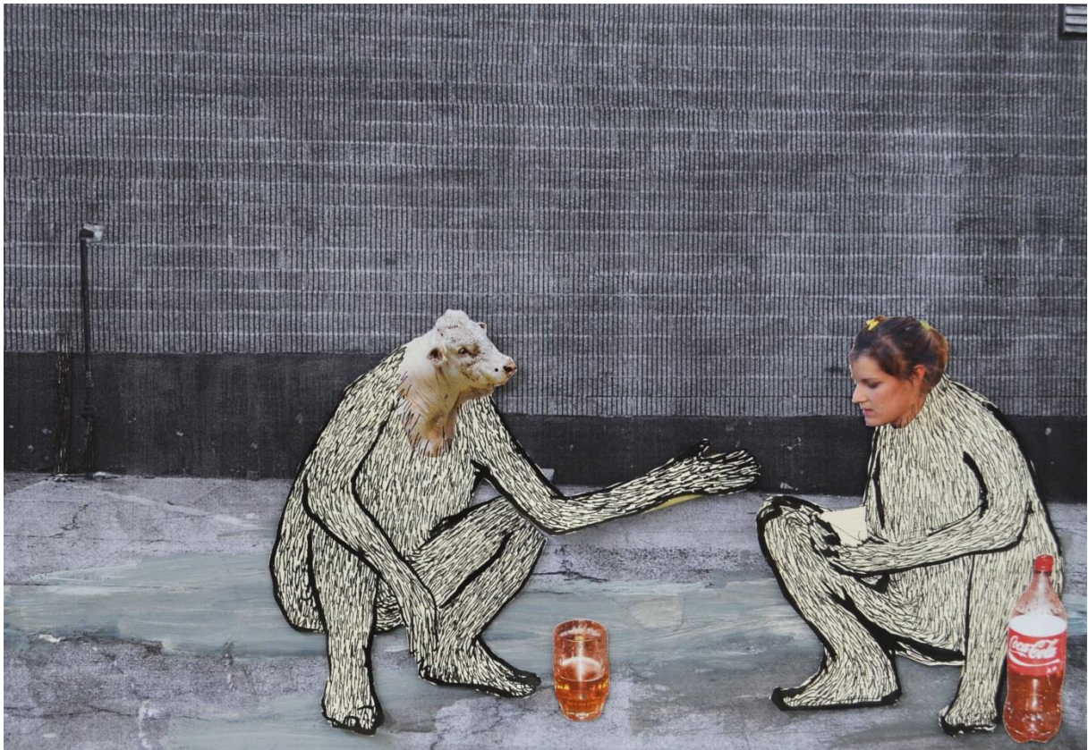
Gopnici , kolaž, kombinirana tehnika, 27 x 21 cm, 2016.