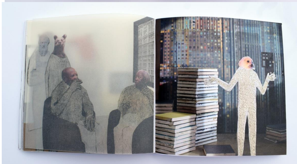
Homo Sapiens- Metamorfoze;

knjiga, 80 stranica, digitalni ispis; 150 g paus papir, 150 g ofset papir, 18 x 18 cm, 2017.