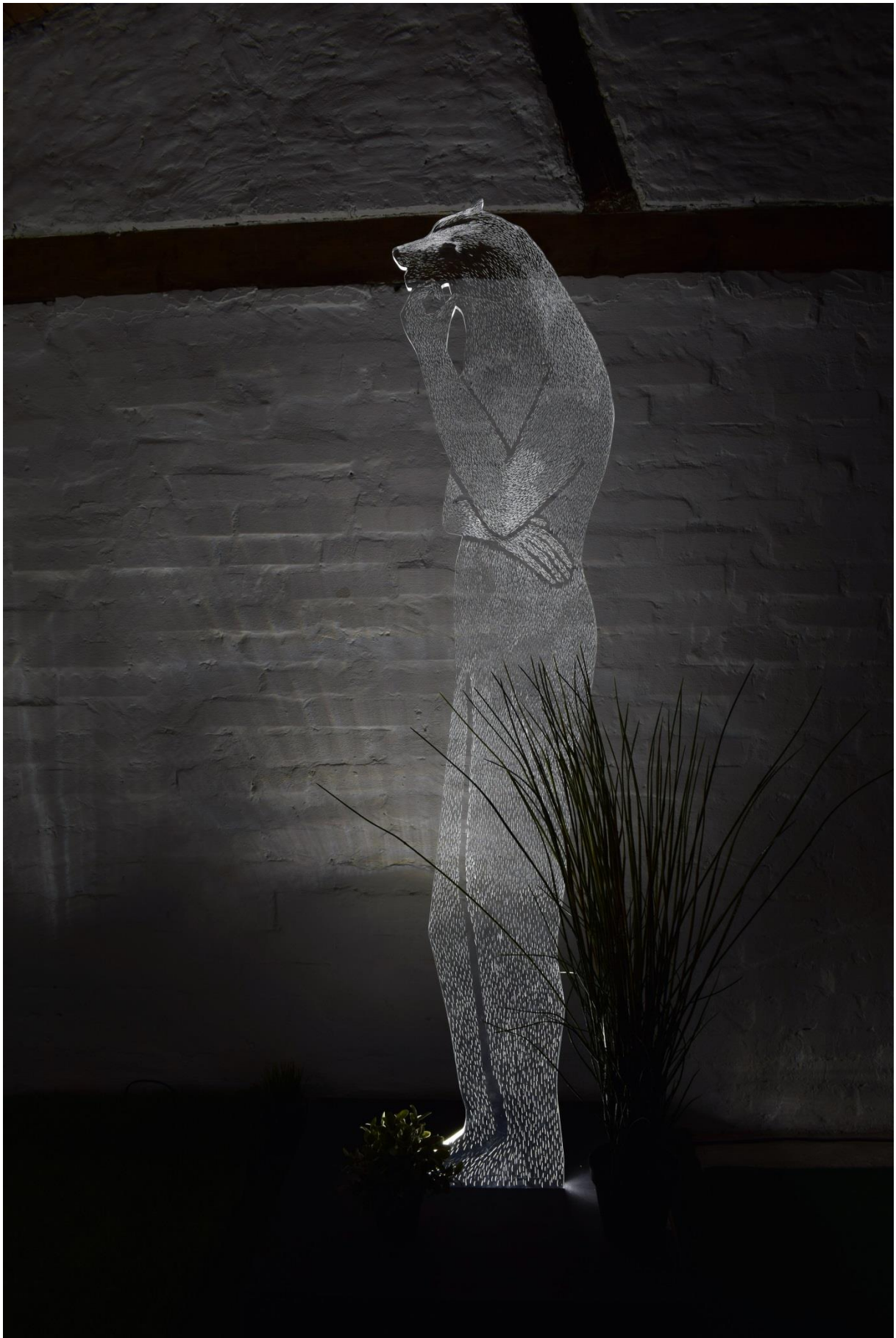
Pas, dio instalacije Homo Sapiens- Metamorfoze, pleksi, LED rasvjeta, 203 x 52 cm x 2 cm, 2017.