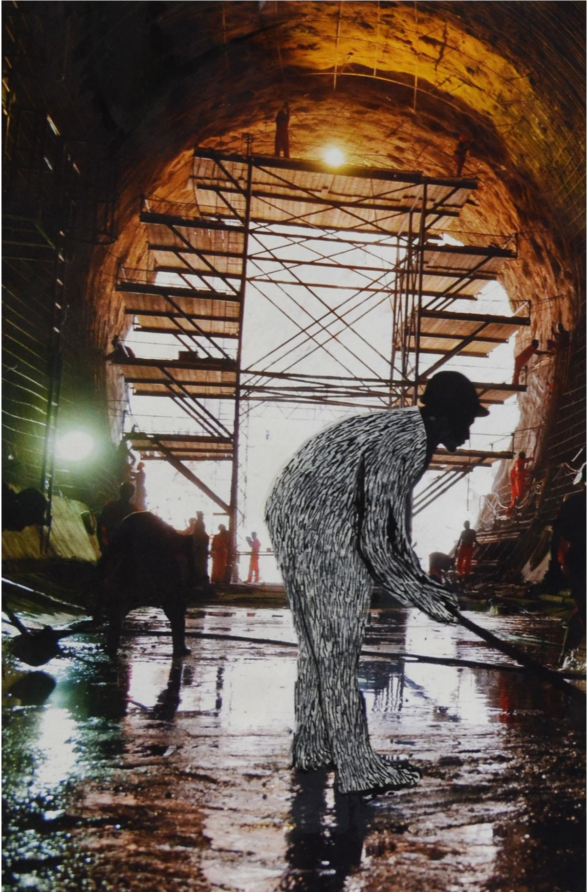
Tunel, kolaž, kombinirana tehnika, 27 x 20 cm, 2016.