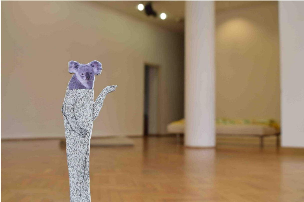
Žmiž , fotografija, 2017.

Diplomskom radu prethodile su male, dvodimenzionalne skulpture hibridnih likova koje sam fotografirala u prostoru, stavljajući ih u uobičajene, svakodnevne situacije. Skulpture od foreksa bile su oblikovane isto kao i životinje na kolažima, životinjske glave izrezane iz časopisa zalijepljene na nacrtana tijela. Razrađujući ta svoja hibridna bića došla sam do skulptura od pleksiglasa obasjanih svjetlom koje su prerasle iz manjih dimenzija u veća svjetlonosna bića.