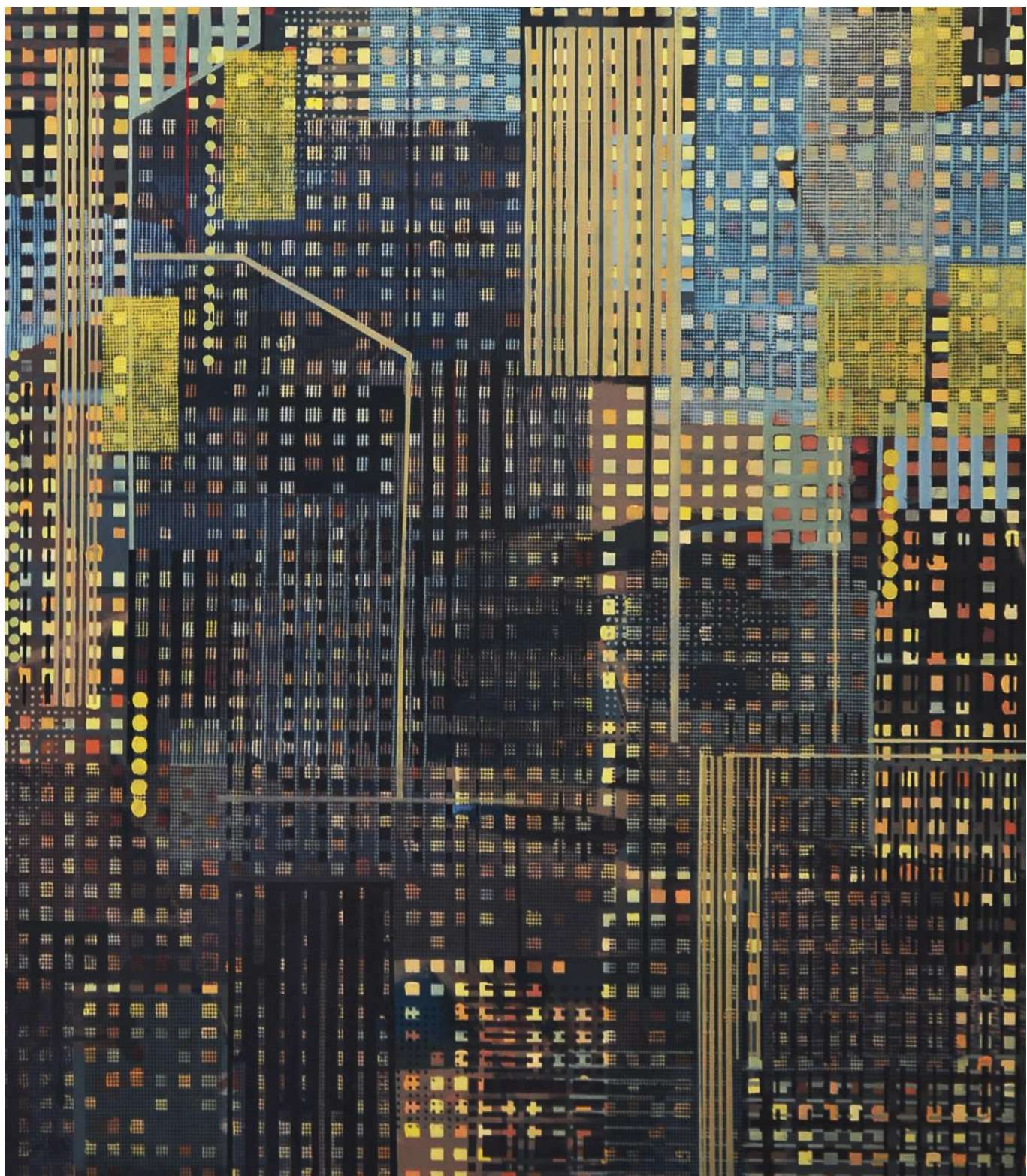
Strukture , ulje na platnu, 130 x 150 cm, 2017.