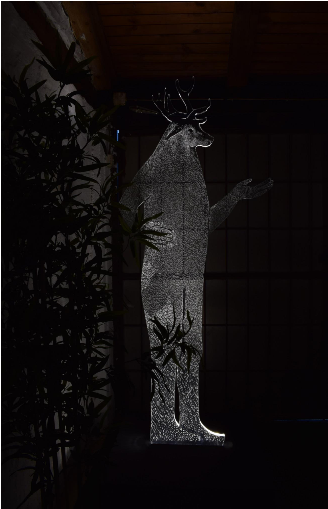
Jelen , dio instalacije Homo Sapiens- Metamorfoze , pleksiglas, LED rasvjeta, 203 x 52 cm x 2 cm, 2017.