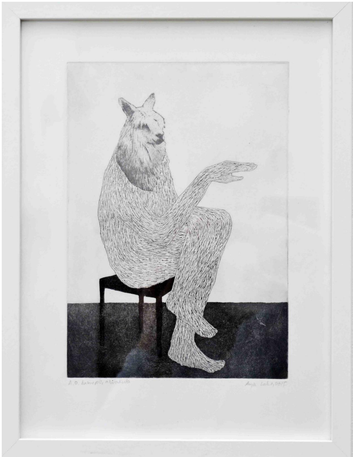
Ljama , bakropis, akvatinta, suha igla , 21 x 29 cm, 2017.