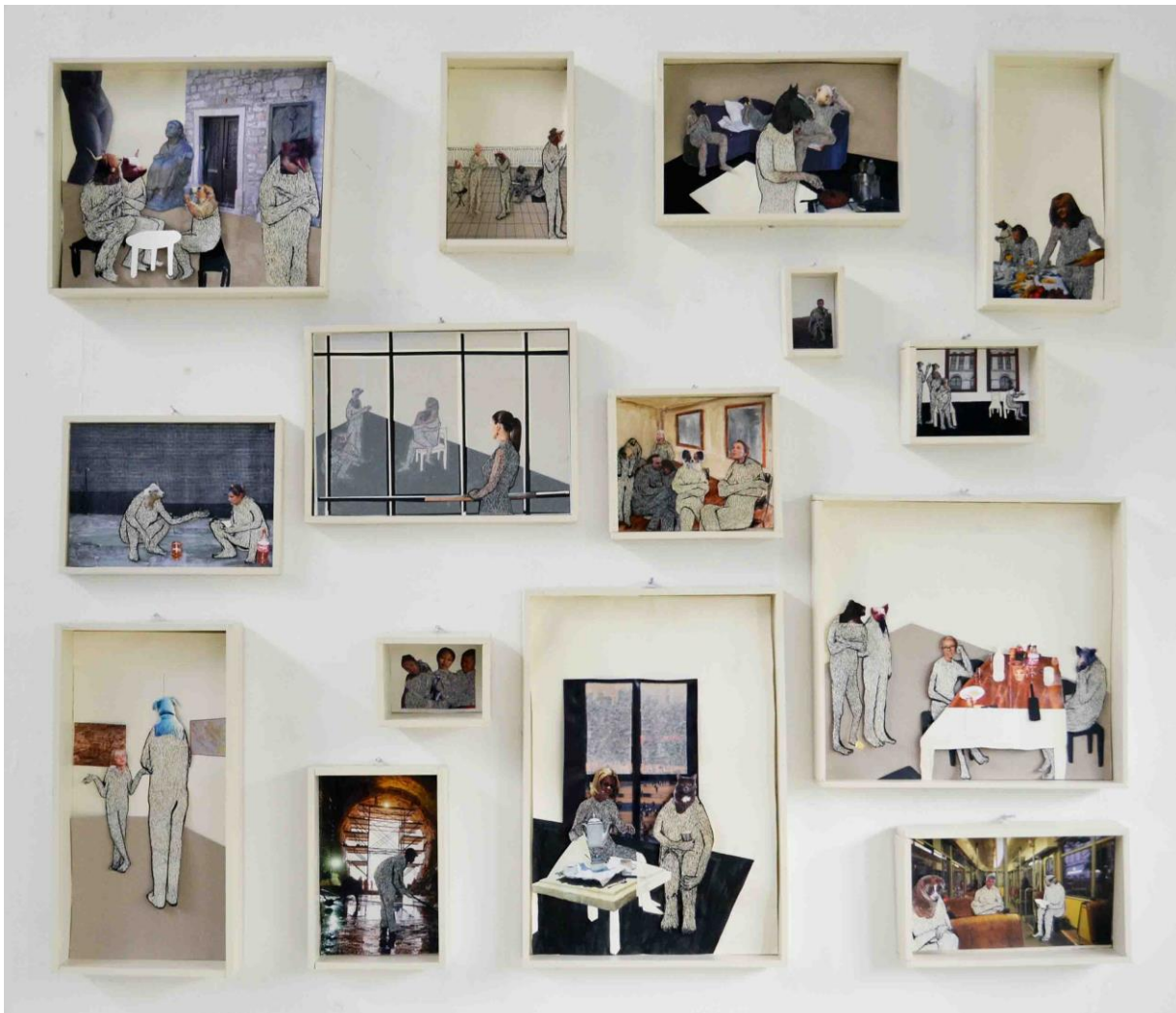
Kutije, poliptih; kolaži, kombinirana tehnika; mediapan, 150 x 130 cm, 2016.

Životinjski motiv spontano sam počela koristiti u svom radu, a zadržao se zato što mi je bilo zanimljivo zamijeniti čovjeka drugom životinjom, i vizualno i značenjski. Temu, koju sam razrađivala u zadnje tri godine, prikazivala sam u raznim medijima i tehnikama. Osim kolaža, s kojima sam započela, izrađivala sam male dvodimenzionalne skulpture, grafike i slike pokušavajući pronaći formu koja najviše odgovara ideji.