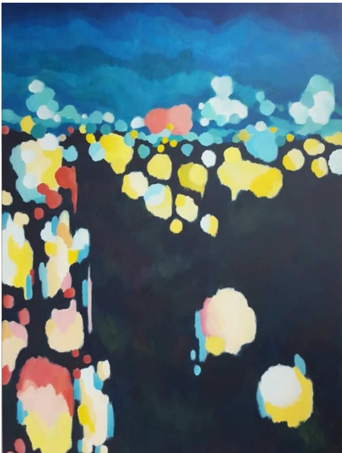
Akril na platnu, 200x140 cm