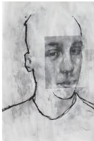
Lice, 2018., kolaž i akril na papiru