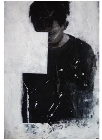
Prepreka, 2018. kolaž i akril na papiru