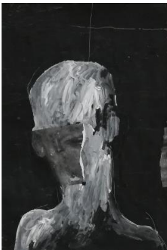
Melankolija, 2018., kolaž i akril na papiru

Eksperimentiranjem i kombiniranjem likovnih tehnika gdje se, osim kolažiranih dijelova, javljaju ekspresivne mrlje i plohe koje su grebane ili strugane pokušavam stvoriti živu, dinamičnu slikarsku površinu koja je u kontrastu sa statičnim, gotovo beživotnim, figurama koje se na njoj nalaze. Zbog takvog istraživanja tehnikama, kao sastavni dio rada, pojavljuju se slučajnost i „greška“ - elementi koji dodatno pridonose nastanku radova koji ne pružaju odgovore, već ostavljaju mogućnost subjektivne, posve vlastite likovne interpretacije.