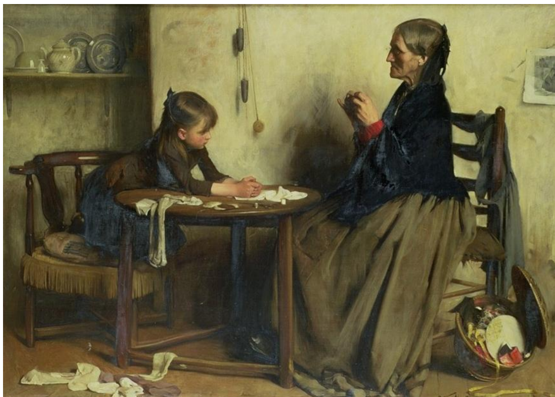
Arthur Hacker- „A difficulty”, 1888.