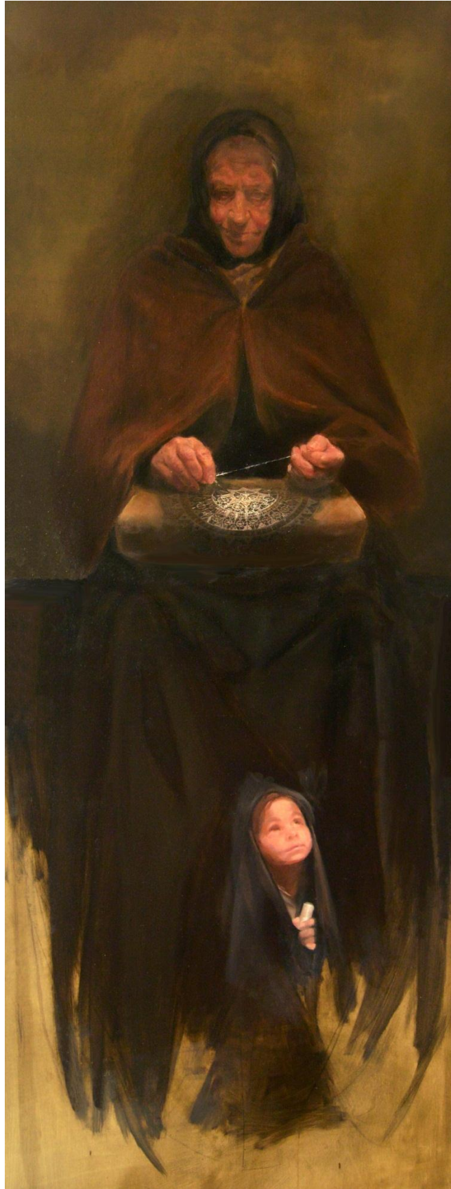
„Elegija o slici I”, 178 x 67cm