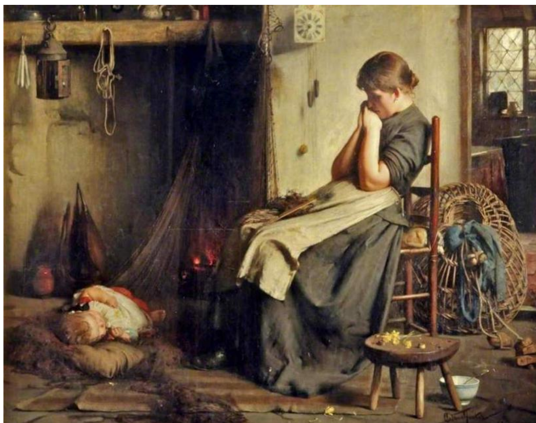
Arthur Hacker- „The fisherman's wife”, 1885 (Izvor: https://www.artuk.org )