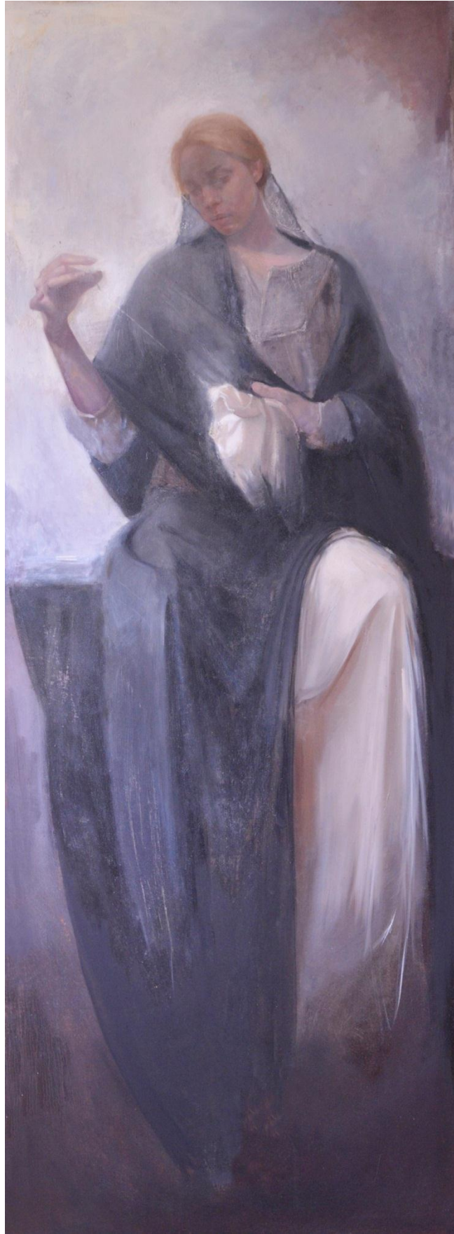
„Elegija o slici III”, 178 x 67cm