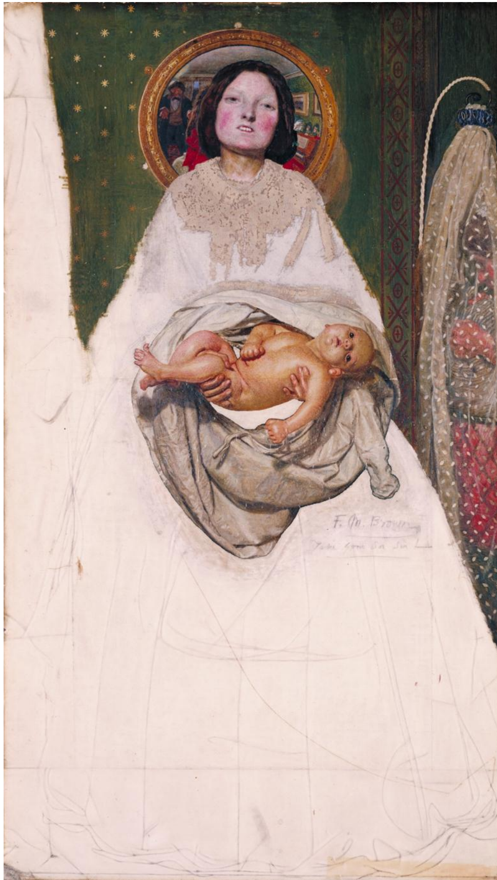
Ford Madox Brown, „Take your son Sir!” (1851.-1855.)

(Izvor: https://artsandculture.google.com )