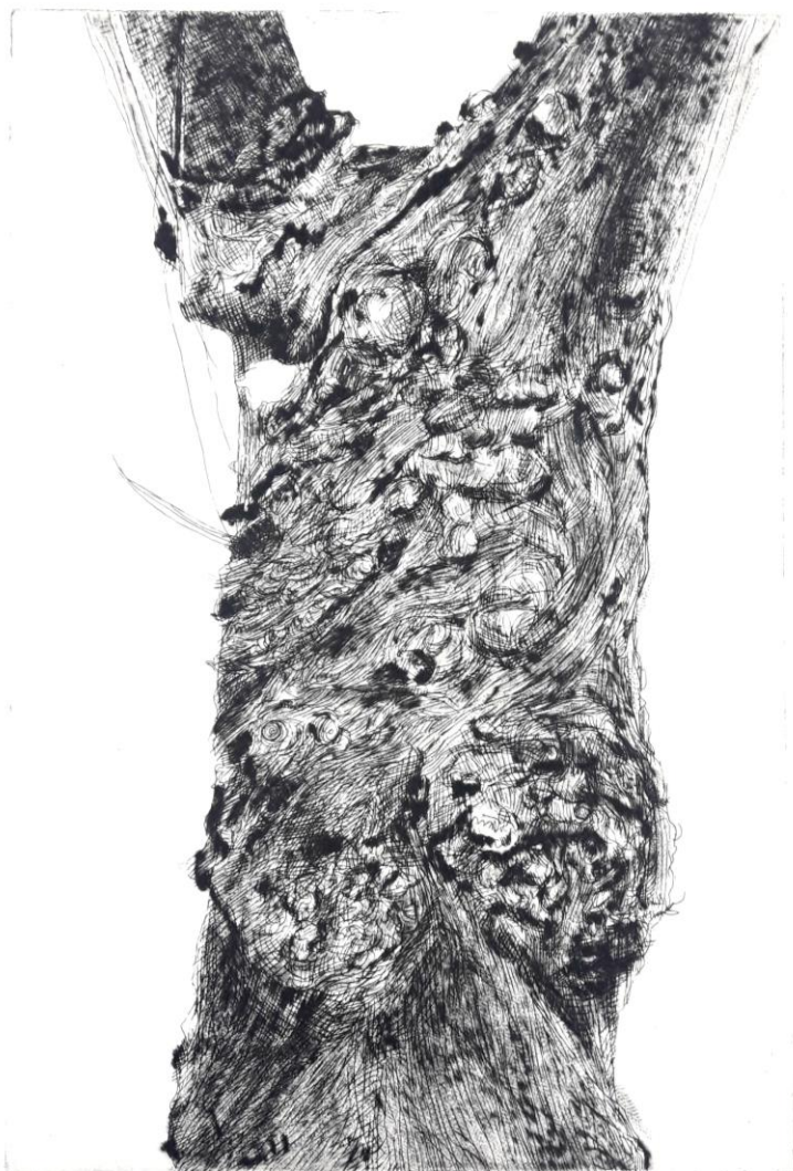
"Koža", 2019., bakropis, suha igla