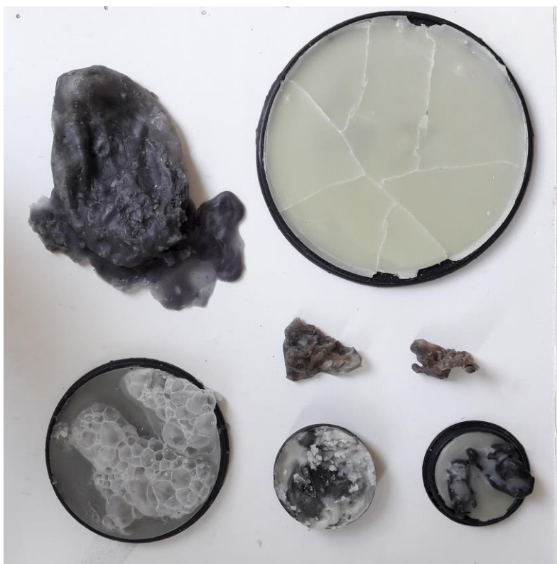
Strukture, 2019., vosak, lateks