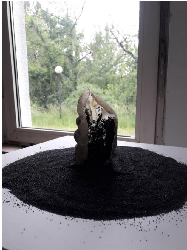
"Melankolija I", "Melankolija II", 2019., lateks, gips, vosak, osušena mahovina