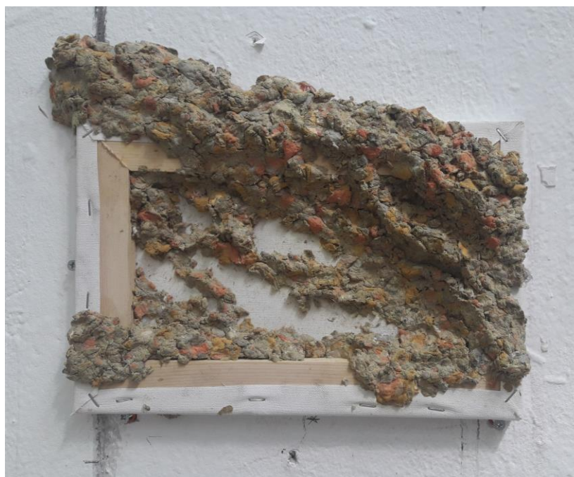
"Puls II", 2019., kaširani papir na platnu