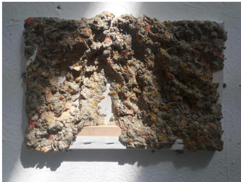
"Puls I", 2019., kaširani papir na platnu

Jednu mogućnost vidim u 3D modeliranju same špilje koja bi se istraživala VR naočalama, pri čemu bi igra svjetlosti i jeke, a možda i skrivenih crteža tvorila potpuni ambijent.