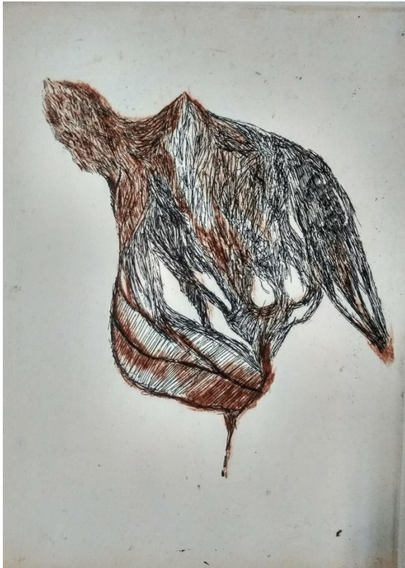
„ I.“, 2019./2020., bakropis i suha igla