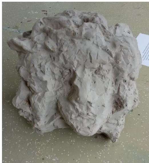
Autoportret, 2020., glina i gips, 30x30x20