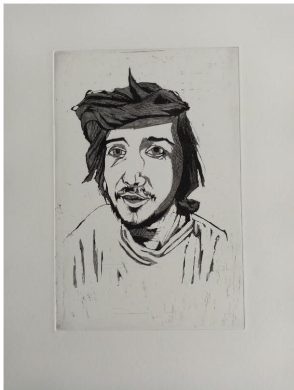
Autoportret, 2019., bakropis i akvatinta, 20x30