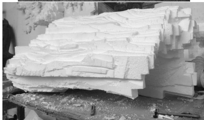
„Izgubljeni grad“, 2020., stiropor