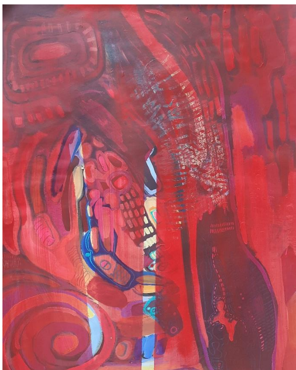
„B+“, 2020., akril i tempera na papiru, 80 x 100 cm

razradama pojedinosti počeli su se stvarati organski oblici kao protuteža strogoj, hladnoj geometriji strojeva. Ti se imaginarni biljni motivi postavljaju prema strojevima poput klica nikada viđenih biljaka koje se spremaju obrasti sve što im se nađe na putu.