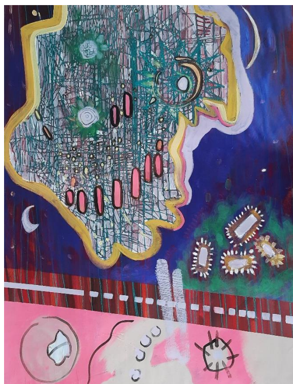
„Dnevni ritam biološkog mikroprocesora u svemiru“, 2020., akril i tempera na papiru, 70 x 100 cm