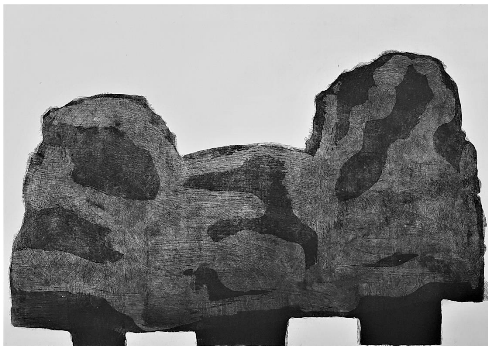
„Divovi 2“, 2020., bakropis, suha igla, akvatinta, 50 x 70 cm