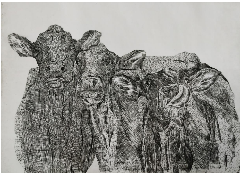
Disciplína II, 2020., bakropis