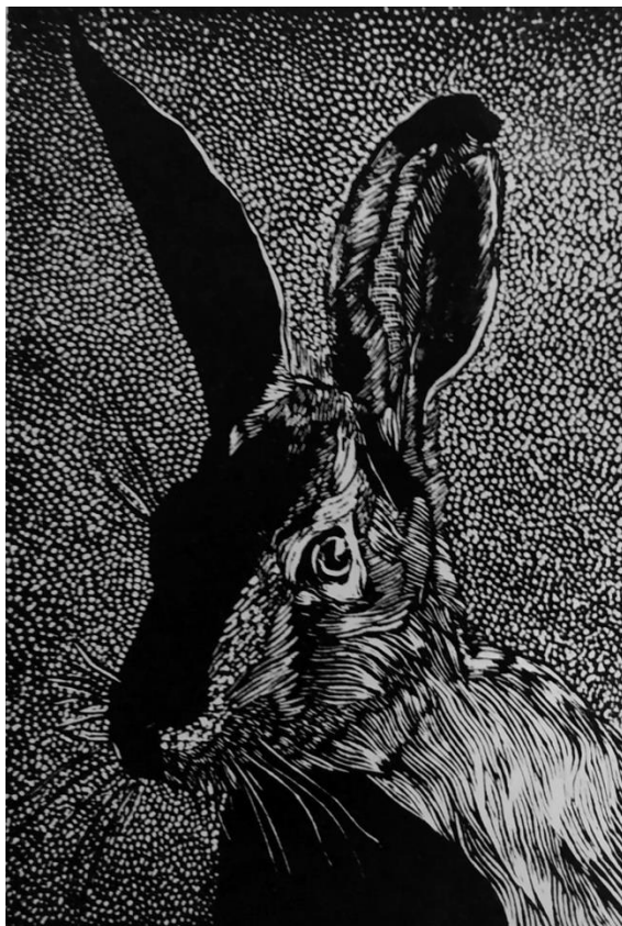
Disciplína I, 2020., linorez