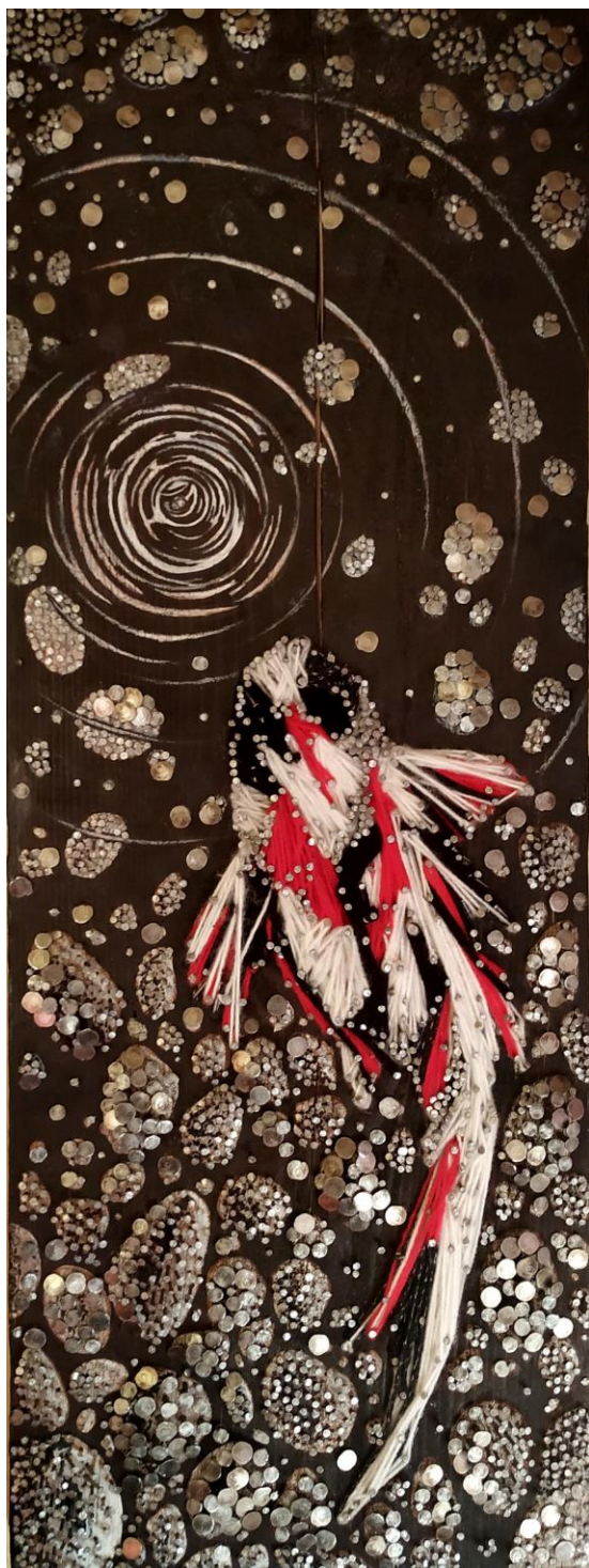
Lābor, 2020., reljef (drvo, čavli, vuna)