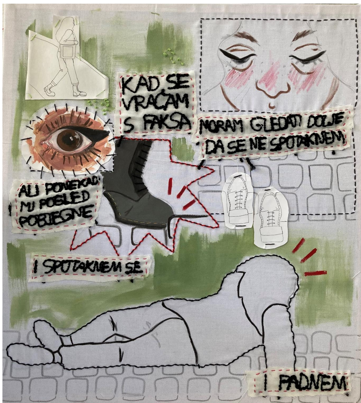
Strip „Kad se vraćam s faksa“ 2021., konac, papir, tkanina, akril, pastele na platnu, 100x90 cm