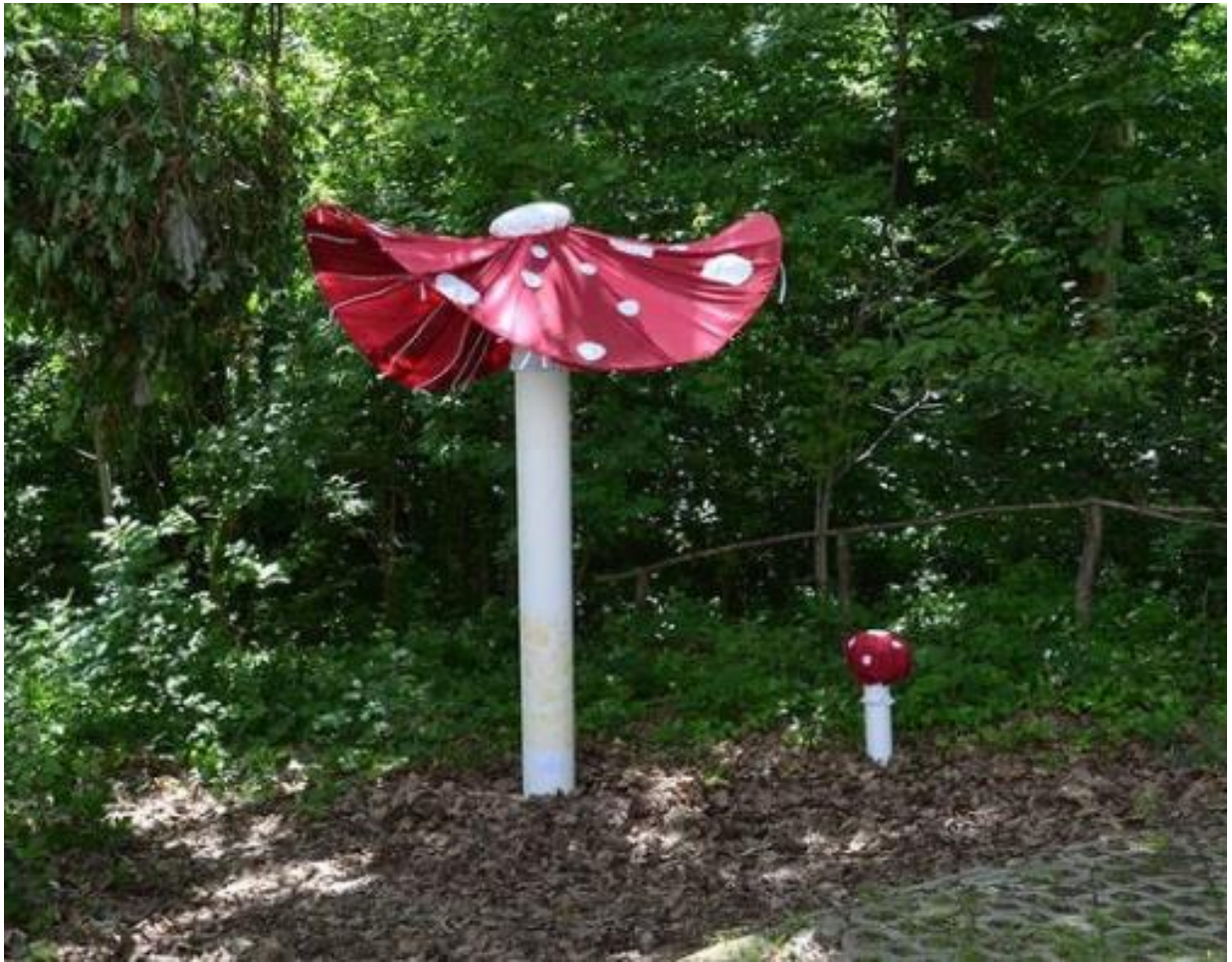
Gljiva muhara , 2021., žičana konstrukcija, tkanina, ručni vez, 220x150x150 cm i 50x30x30 cm