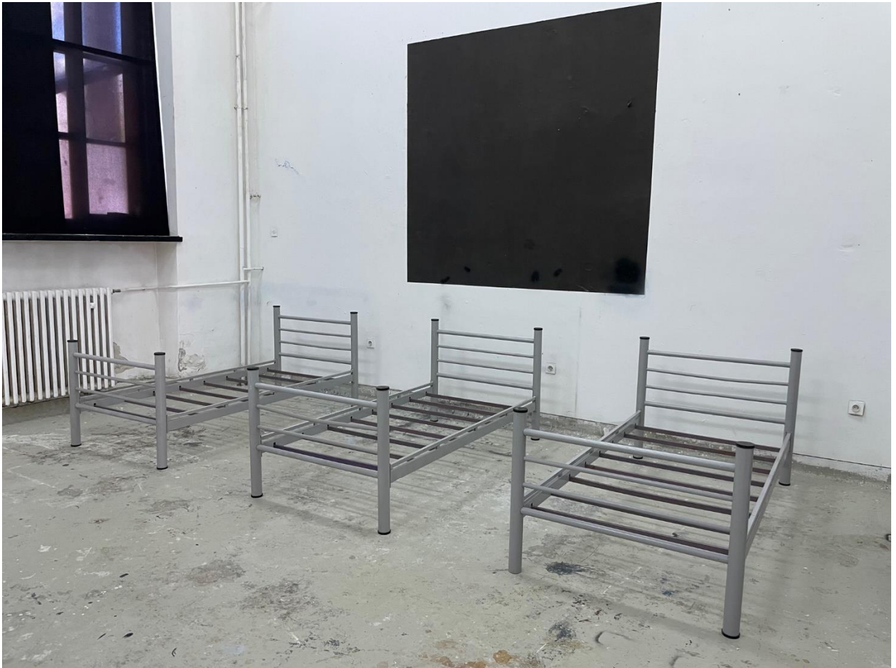
Postava diplomskog rada, Situacija, Denis Svirać

Postavljanje diplomskog rada u prostorijama Akademije likovnih umjetnosti u Zagrebu.