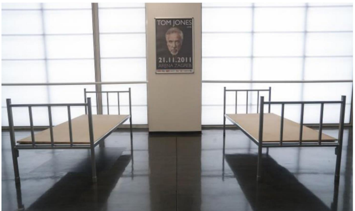
21.3.2020., Arena Zagreb

Ironična je činjenica da se u prostorima namijenjenim kulturnim, zabavnim i sportskim događanjima nalazi bolničko prihvatilište za oboljele. Iz tog razloga želim poslati jasnu poruku ozbiljnosti i sabranosti današnje situacije.