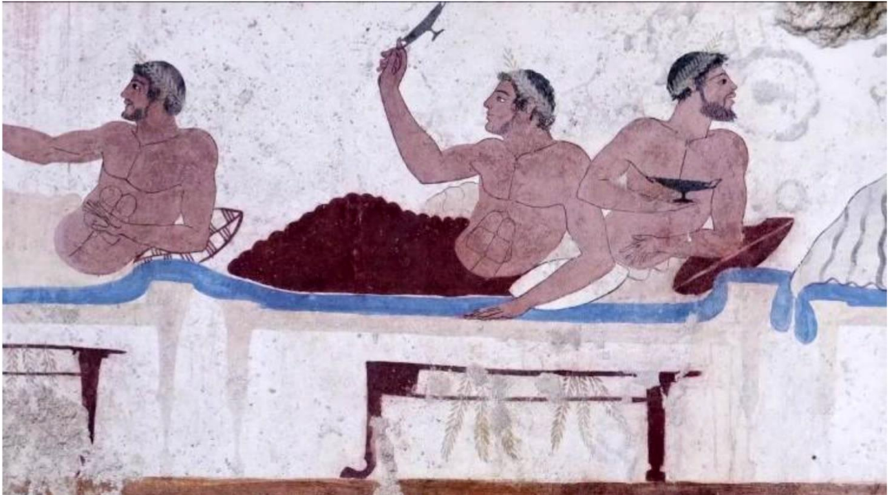
Smithsonian muzej, Egipat ,orgije

Prvi željezni i metalni kreveti pojavljuju se u 18. stoljeću te su preteča današnjih konstrukcija kreveta.