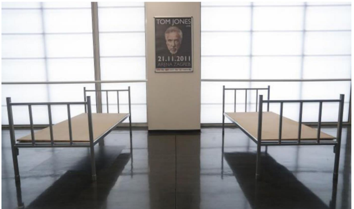
21.3.2020., Arena Zagreb

Ironična je činjenica da se u prostorima namijenjenim kulturnim, zabavnim i sportskim događanjima nalazi bolničko prihvatilište za oboljele. Iz tog razloga želim poslati jasnu poruku ozbiljnosti i sabranosti današnje situacije.