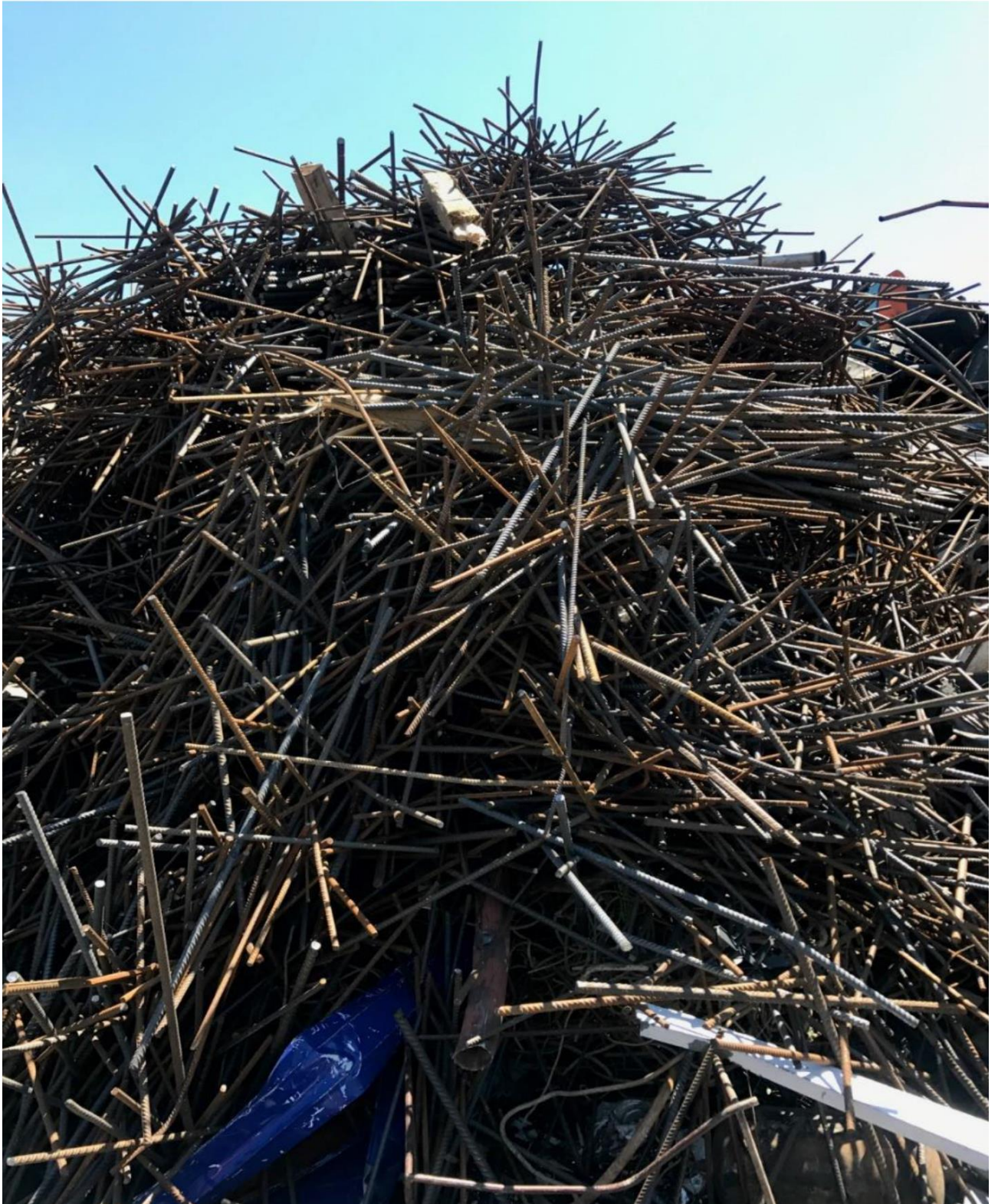
Odlagalište otpada CIOS 12.01.2021