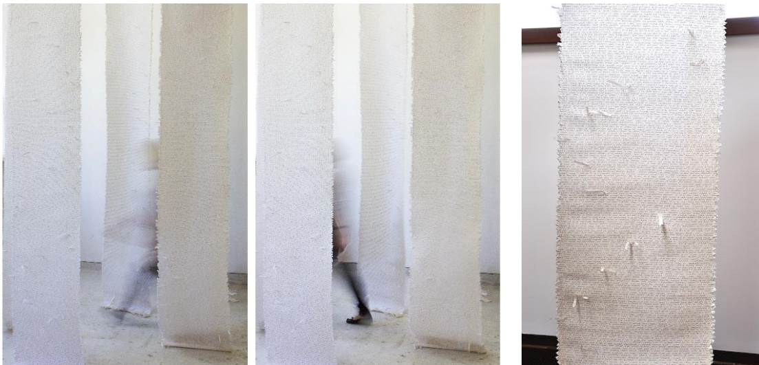
Ana Mušćet, Istkane Krležine Zastave, 2016., flizelin, pamuk, pleksiglas, tkanice 0,5 x 5 m