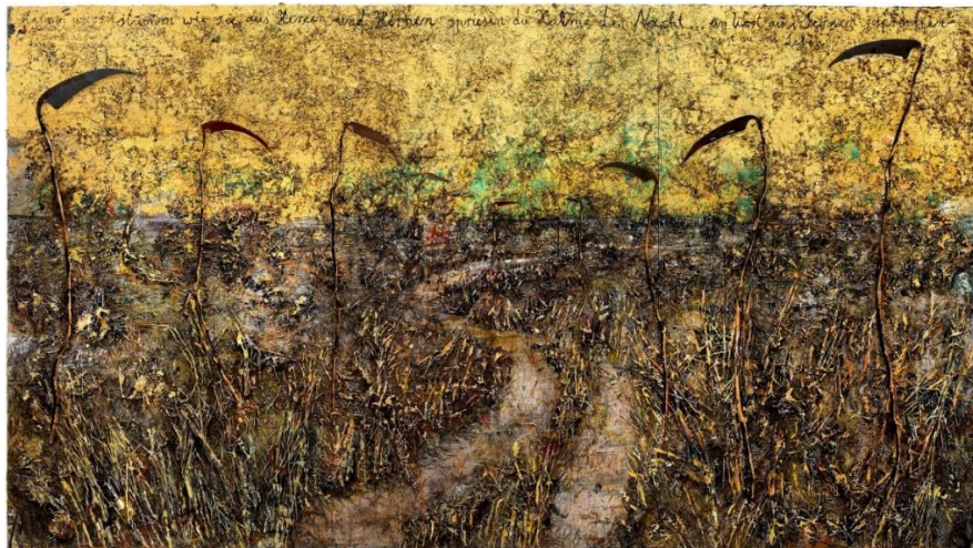
Slika 1 - Anselm Kiefer, Aus Herzen und Hirnen sprießen die Halme der Nacht. 2019. –2020., 1200 x 674 cm, kombinirana tehnika

Zbog tog razloga sam odabrala tkanje starih grafičkih otisaka u novu, apstraktnu kompoziciju. Figurativni motivi rodnog kraja koji su ujedno i temelj moje osobnosti, stvaraju novu priču, neispričanu i nedefiniranu do kraja. Mogu zaključiti da je ovaj likovni rad proizašao iz proučavanja vlastitog ja , proučavanja mojih vlastitih želja, nada i strahova; mojih planova, upravljanja njima i želja da postignem vlastito samoostvarenje.