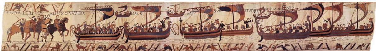
Tapiserija iz Bayeuxa, nepoznati autor, 1070. – 1080., vez vunenim koncem na lanenom platnu, 50,8 x 700 cm, Musée de l'Evêché, Bayeux

Ugledala sam se na tapiserije koje su kroz povijest krasile mnoge domove te su stvarale topao i ugodan osjećaj unutar neke prostorije. Takve prekrasne tapiserije ogromnih dimenzija krasile su zidove blagovaonica, salona i ostalih društvenih prostora unutar domova. 8 Također, inspiraciju za tkanje papira sam dobila od likovne instalacije Ane Mušćet pod nazivom Zastave. 9