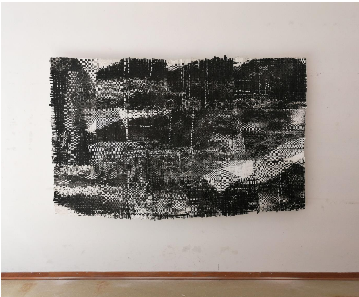
Planovi, postav u prostoru

Proučavajući stručnu literaturu pokušala sam samoj sebi omogućiti da bolje shvatim sve promjene i procese koje prolazim. Kao što piše Seginer 6 , mladi ljudi troše dosta vremena kako bi sami sebe zamišljali u ulozi odraslog čovjeka, bilo u profesionalnom ili obiteljskom životu. Za njega je bitno da taj koncept (plan) bude čim konkretniji i jasniji kako bi prelazak iz mlade (adolescentske) dobi u odraslu bio čim jednostavniji i bezbolniji. Također, Leccardi 7 piše o tome da je za mlade ljude pojam „budućnost“ područje mogućnosti napredovanja u vremenu. Mladi, kako bi se planirano kretali u željenom smjeru, trebaju imati jasne kriterije te tako postižu lakše raspoznavanje realnosti od fantazije.