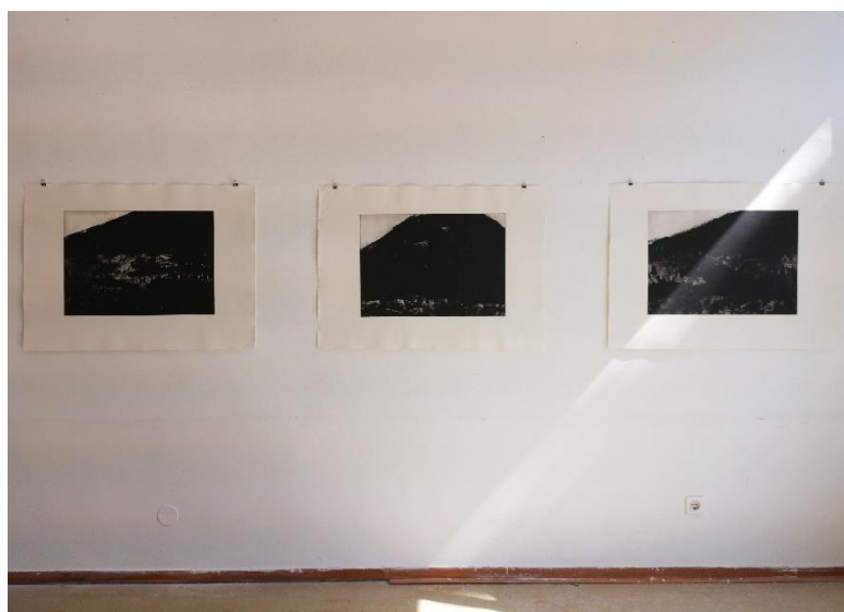
Planovi - grafički otisci, postav u prostoru