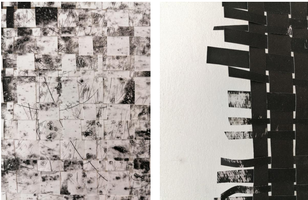
Planovi - detalj

Kako bih krenula u istraživanje, bilo je potrebno osloboditi se poznatih prostornih planova te se kroz pletenje poznatih motiva brežuljaka igram s planovima; ono što je nekad trebalo biti iza, sada se ritmično izmjenjuje, pa u jednom trenu taj mali segment bude u prednjem planu, a ubrzo nakon toga bude u stražnjem. Planovi su pomiješani, nejasni te stvaraju određenu konfuziju i novi imaginarni prostorni plan.