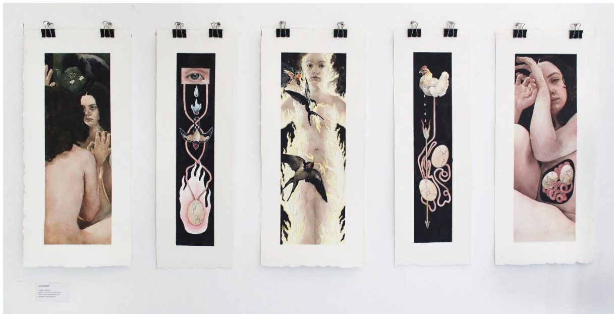
Seriya „osobne mitologije“ u prostoru