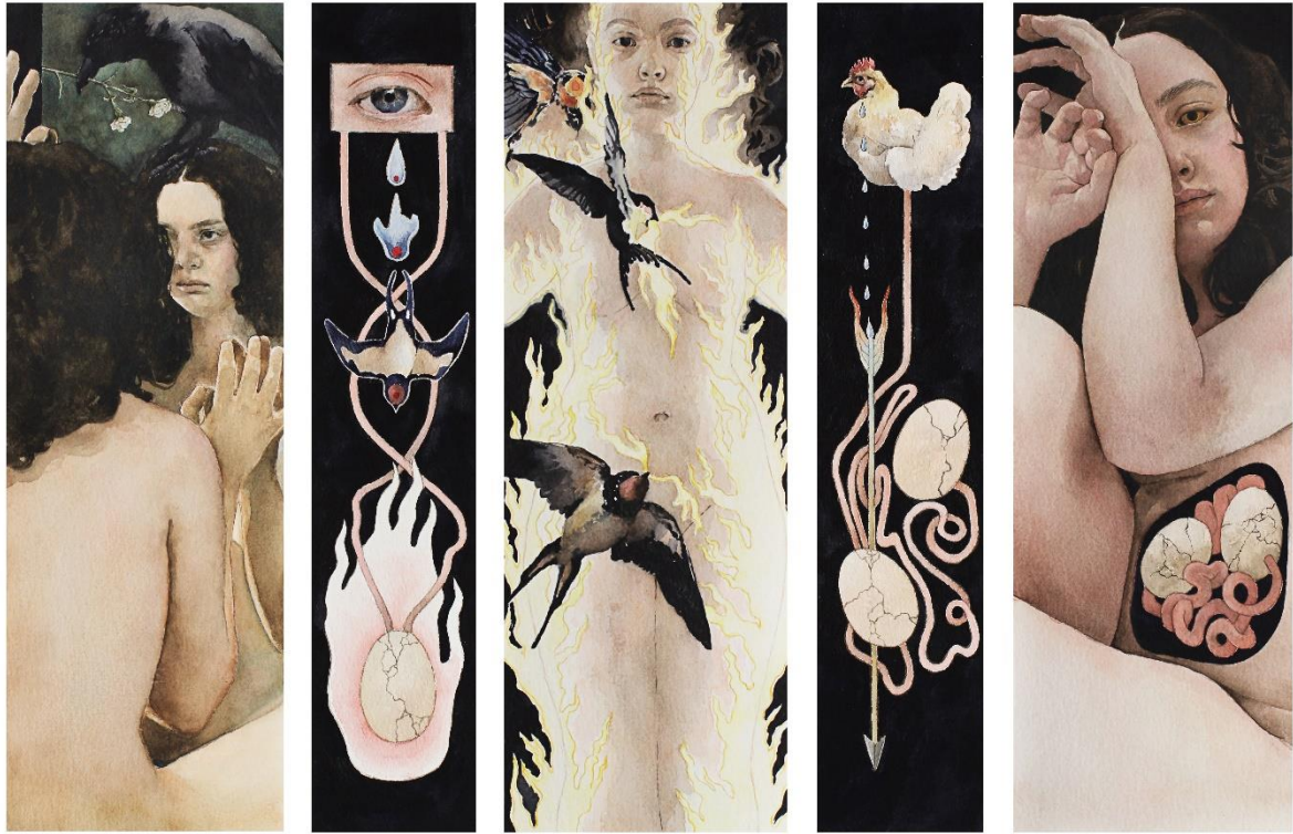
Seriya „Osobne mitologije“