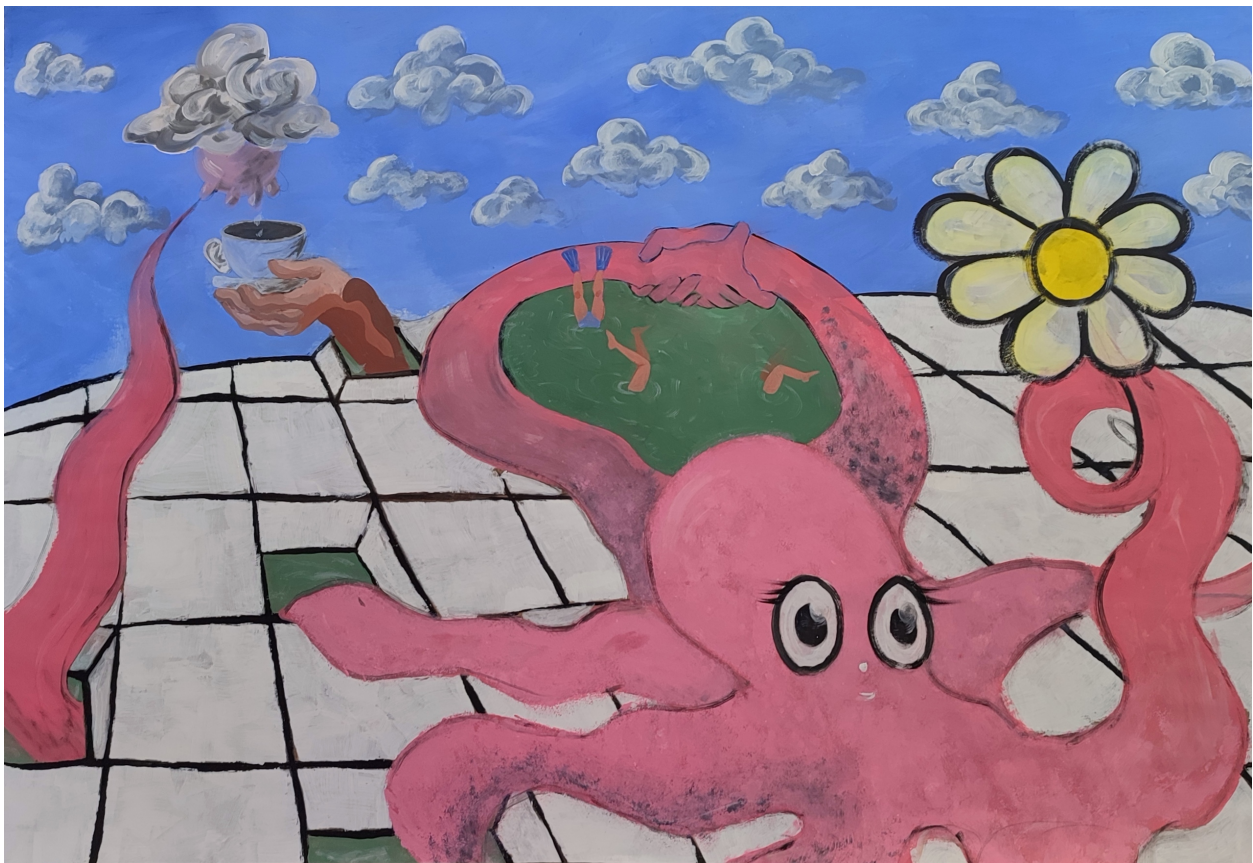
Engleski čaj, 2021., akril na papiru