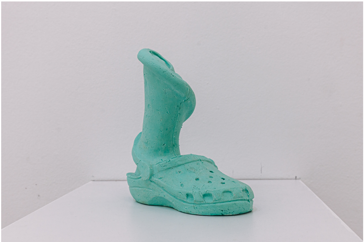
Kroksica-šlapa-uho, 2021., silikonska guma

za skulpturu. Krznena šalica je savršen primjer kako promjenom materijala ili teksture dobivamo potpuno novi doživljaj predmeta. Oppenheim je na ovom radu naglasila kontrast između glatke i čvrste keramike i krzna. Naime, već na prvi pogled promatrač zna kakvo bi neugodno iskustvo bilo piti iz te šalice. Suprotno tome, na ovoj sam skulpturi materijal željela prilagoditi onome što prikazuje. Izrađena je od silikonske gume, tako da je sama skulptura mekana kao što su to kroksica i uho u stvarnosti. Korištenjem ovog materijala pokušala sam se približiti ideji stvaranja balansa između realnog i nerealnog.