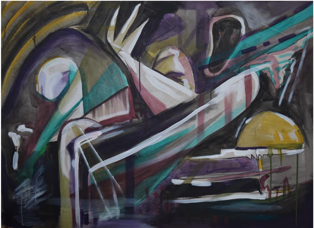
Apokalipsa , 2022., akril na papiru