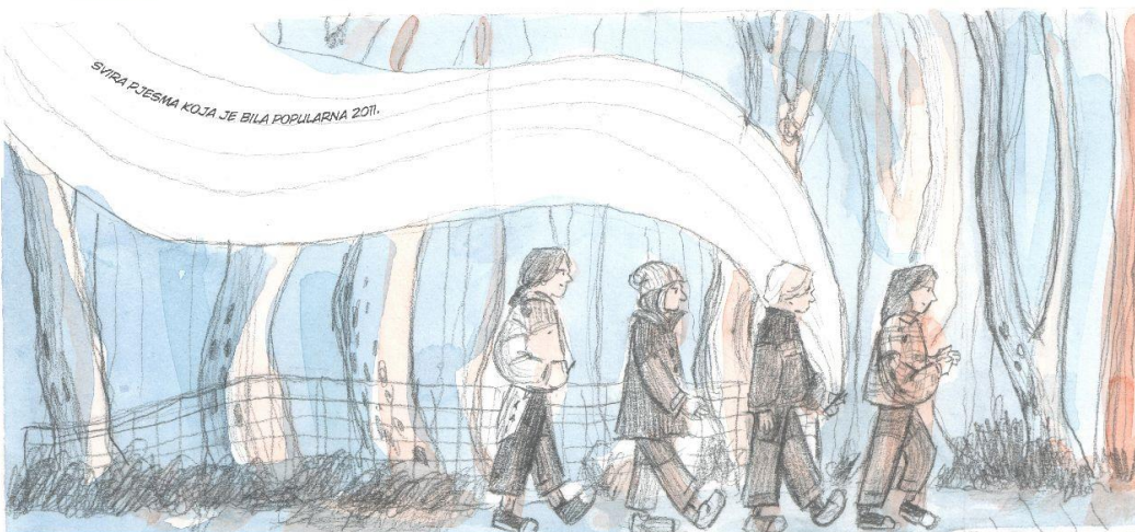
Slika 4 Tabla stripa 012