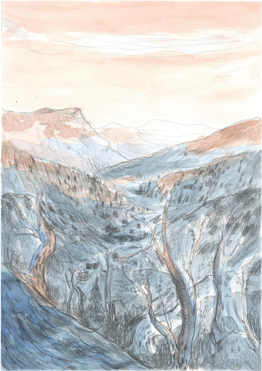
Slika 3 Tabla stripa 009