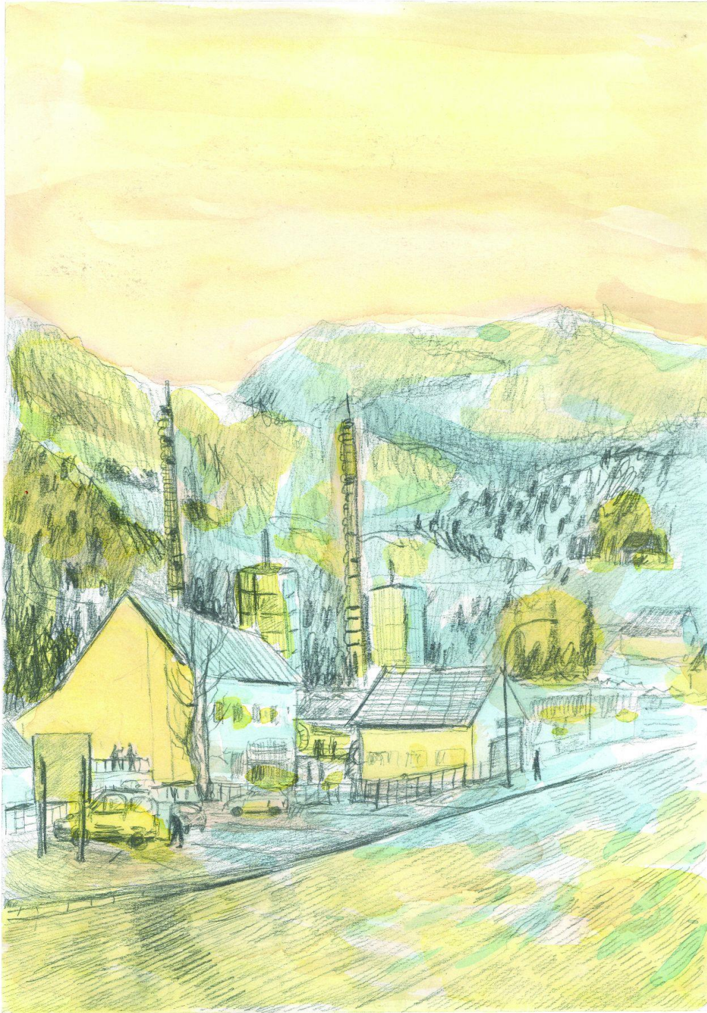
Slika 2 Tabla stripa 001