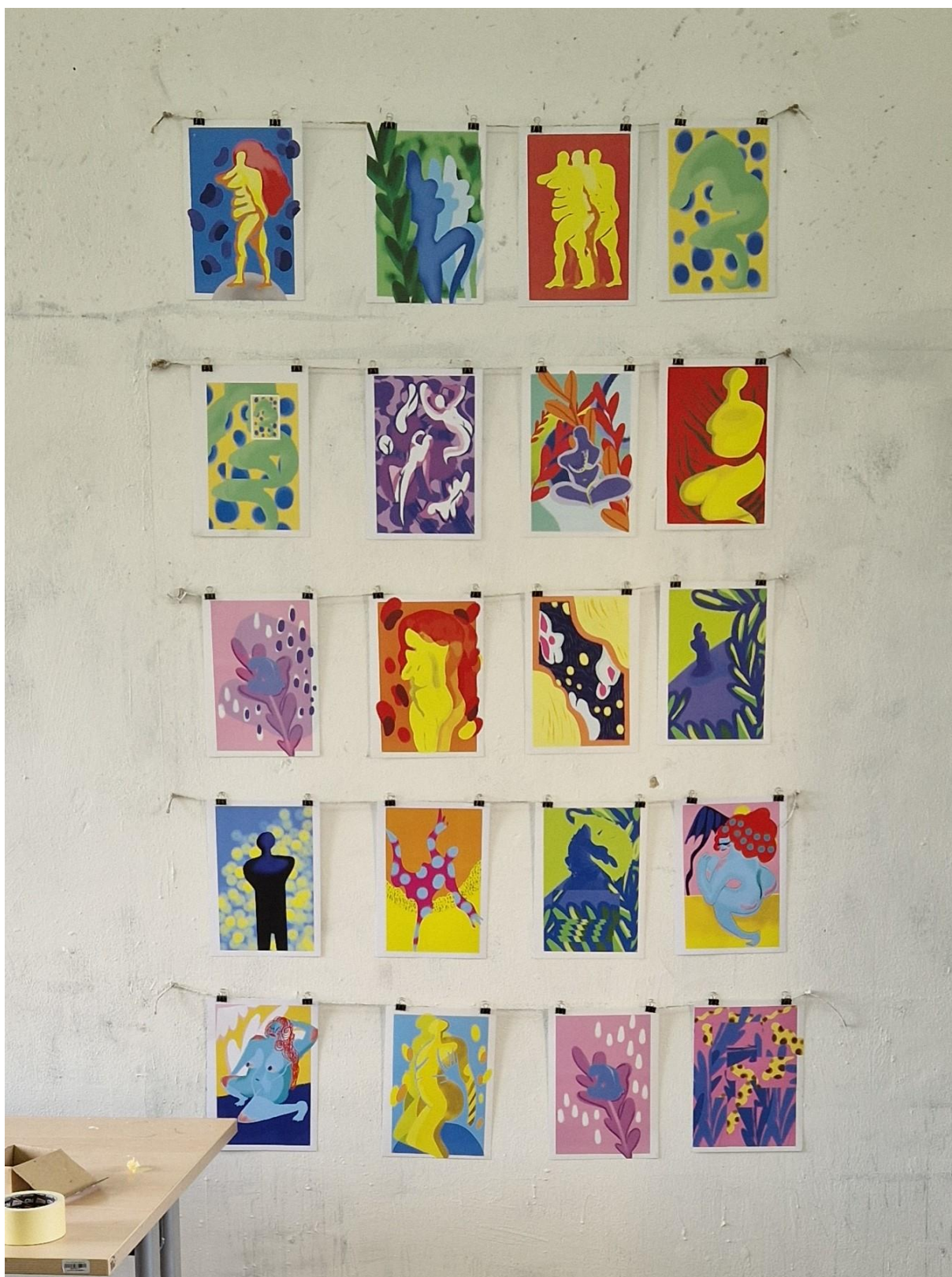
Slika 01- završni rad u prostoru Akademije