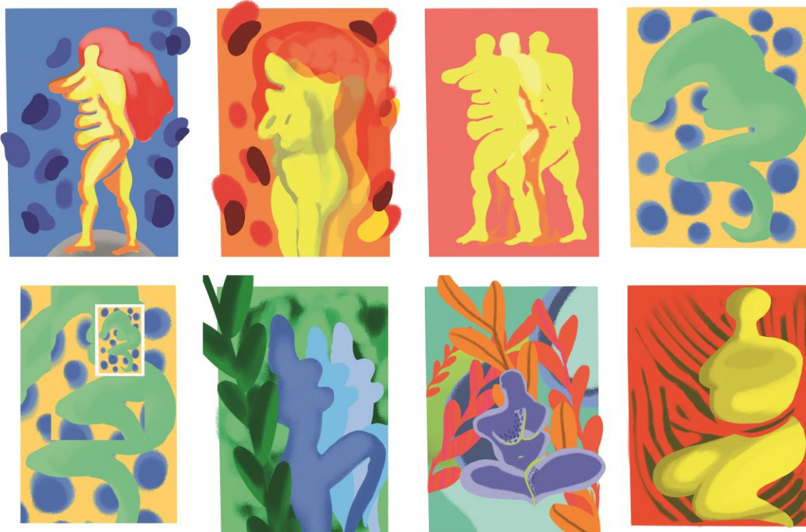
Slika 03 – nanizani digitalni prikaz