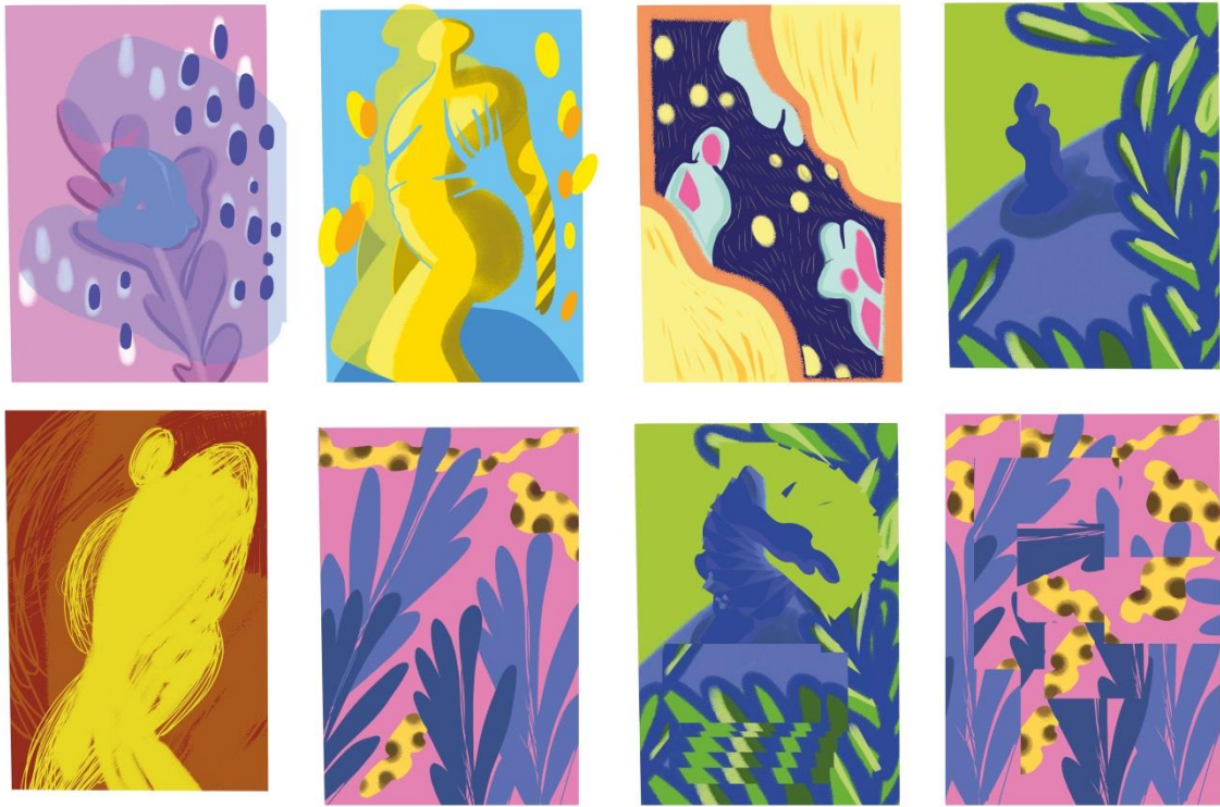
Slika 02 - nanizani digitalni prikaz