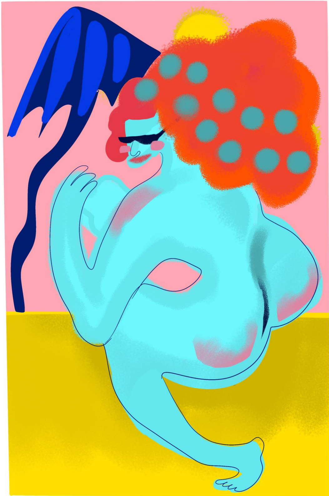
Slika 04 – individualan rad