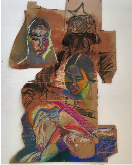
“Volimo se, a bombe padaju“, 130 * 72 cm, akril, ugljen i suha pastela na kartonu, 2023.