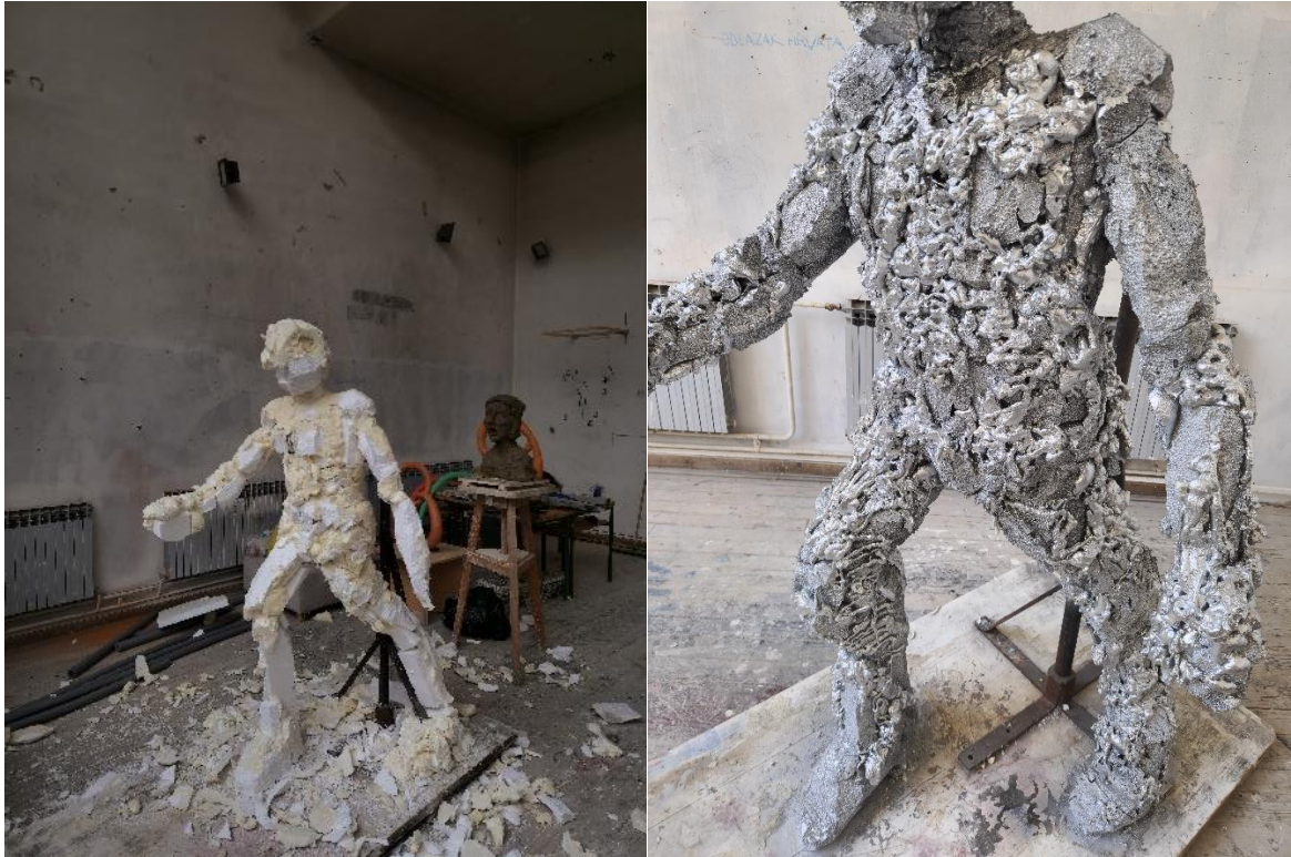
„Erektirani refleksiometar“, pur pijena i stiropor, 2023.