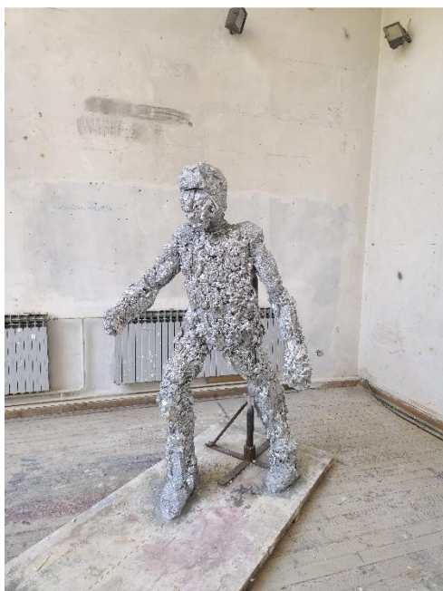
„Erektirani relfeksiometar“, pur pijena i stiropor, 2023.

pronašao sam već u Michelangelu i njegovim nedovršenim robovima koji su napola zarobljeni u mramoru. Na isti način na koji sam ja skulpturu postepeno oslobađao iz nasumične mase stiropora u definiranu ljudsku figuru. Iako sam se vodio tom idejom, izvedba u konačnici ne posjeduje u srži i ne prati tu vrstu promišljanja o skulpturi, već se skulptura čita naprosto kao skulptura izrađena u materijalu zadanom od strane umjetnika. Ipak, iako nije nešto što se može razaznati na gotovoj skulpturi, tokom izrade, velikih mi je problema zadavala nečitka veza nasumično naslaganog stiropora te sam uz pomno promišljanje i brojne popravke polako iz ničega stvorio nešto, u ovom slučaju stojeću figuru koja je na kraju visinom nadmašila i mene samog. Također, na moj rad je utjecaj imao Giacometti sa svojim skulpturama ljudi u raskoraku koji su me svojom istanjenom formom i naboranom površinom asocijali na moj rad, pun nepravilnosti načinjenih rezanjem stiropora i ispunama pur pijenom. Figura je oduvijek bila dio mog likovnog interesa. Ovim sam radom napokon prekoračio klasične i akademske elemente koji su se javljali u svim mojim dosad napravljenim kiparskim radovima te sam samome sebi otvorio vrata vlastitog puta izražavanja u mediju kiparstva.