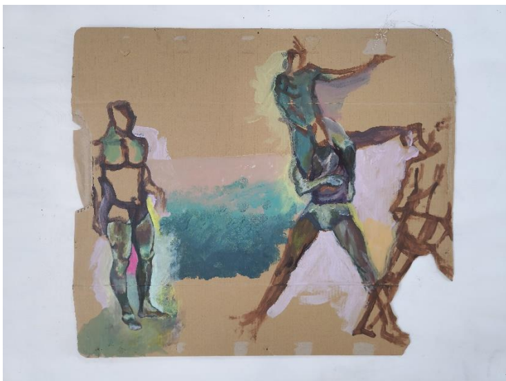
„Bez naziva“, akril na kartonu, 62 * 72 cm, 2023.