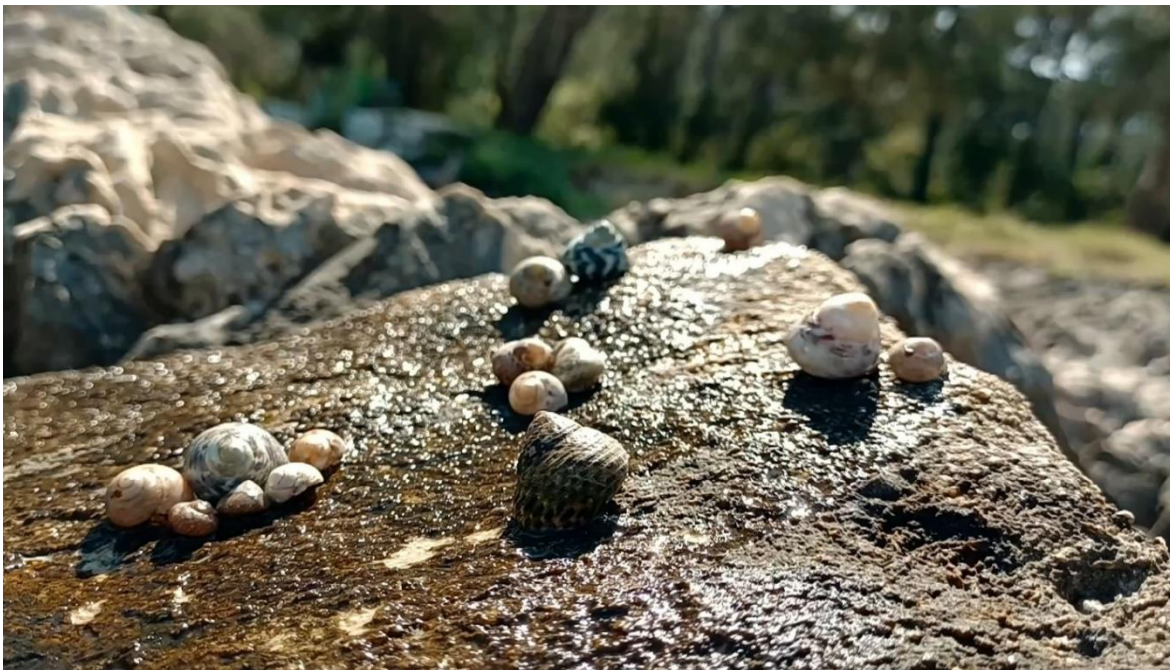
Slika 1. Kadar iz videa, nanar sa svojom obitelji i prijateljima.

Video rad Puževim korakom sastoji se od osam cjelina. Prva od njih započinje prikazom uobičajenog dana jednog morskog puža i na lepršav nas način uvodi u priču prikazujući jedan mikro svijet – nanara među svojom obitelji i prijateljima, naglašavajući kako je to mjesto gdje pripada, što ujedno i nagovještava buduće događaje filma. Također nas upoznaje s glavnim tehničkim obilježjem videa, ubrzanim kretanjem puževa.