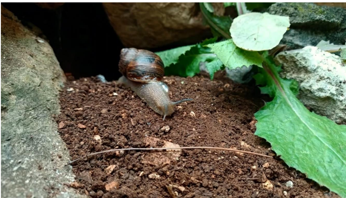
Slika 2. Kadar iz videa, puž izlazi iz svog kamenog skrovišta.

Druga cjelina slijedi uobičajen dan jednog kopnenog puža. On se budi i izlazi iz svog skrovišta u kamenu te kreće u šetnju kroz šumu.