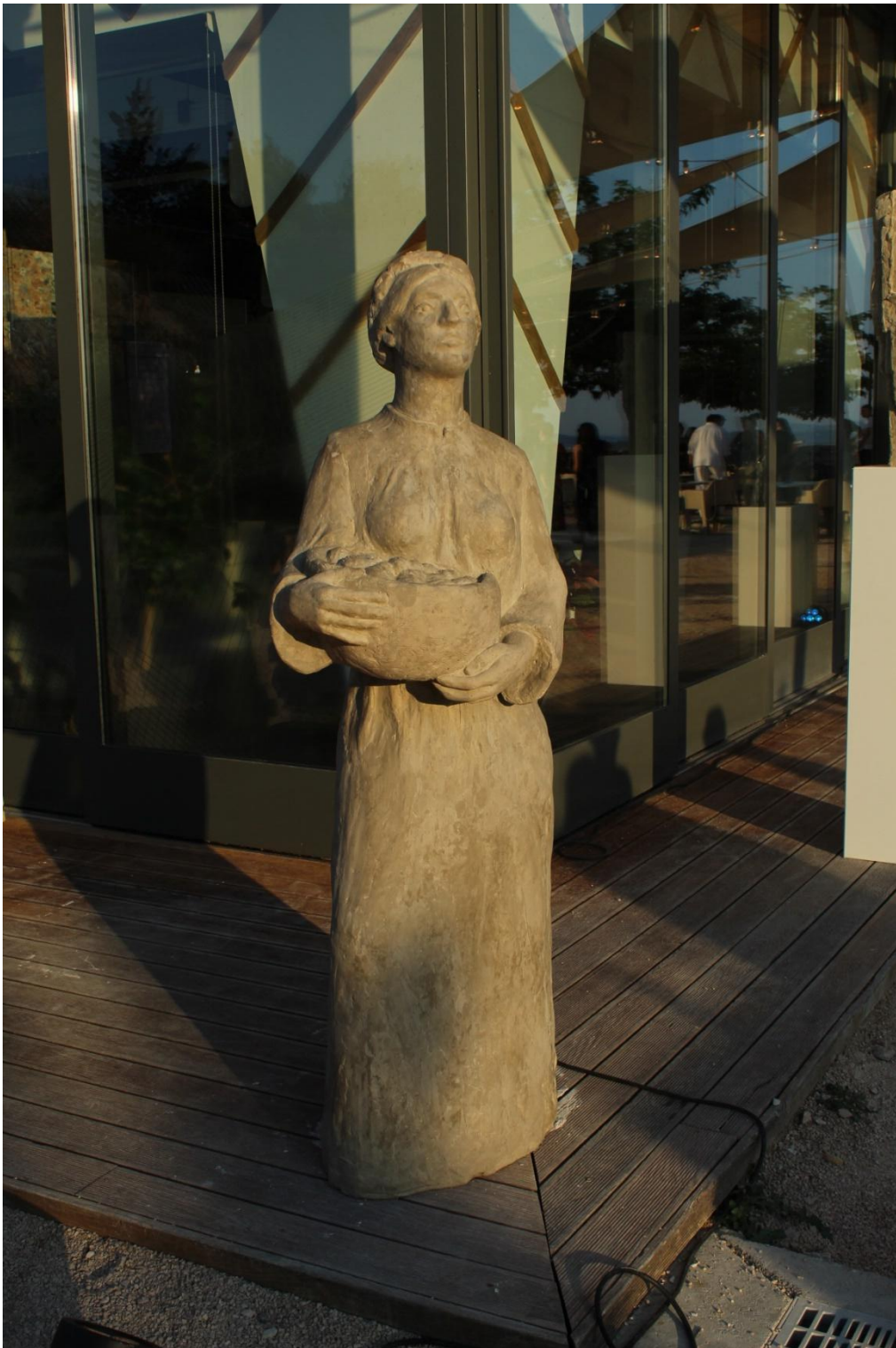
„Prizori (Na Starom pazaru)“, sadra, visina 164 cm, 2023.