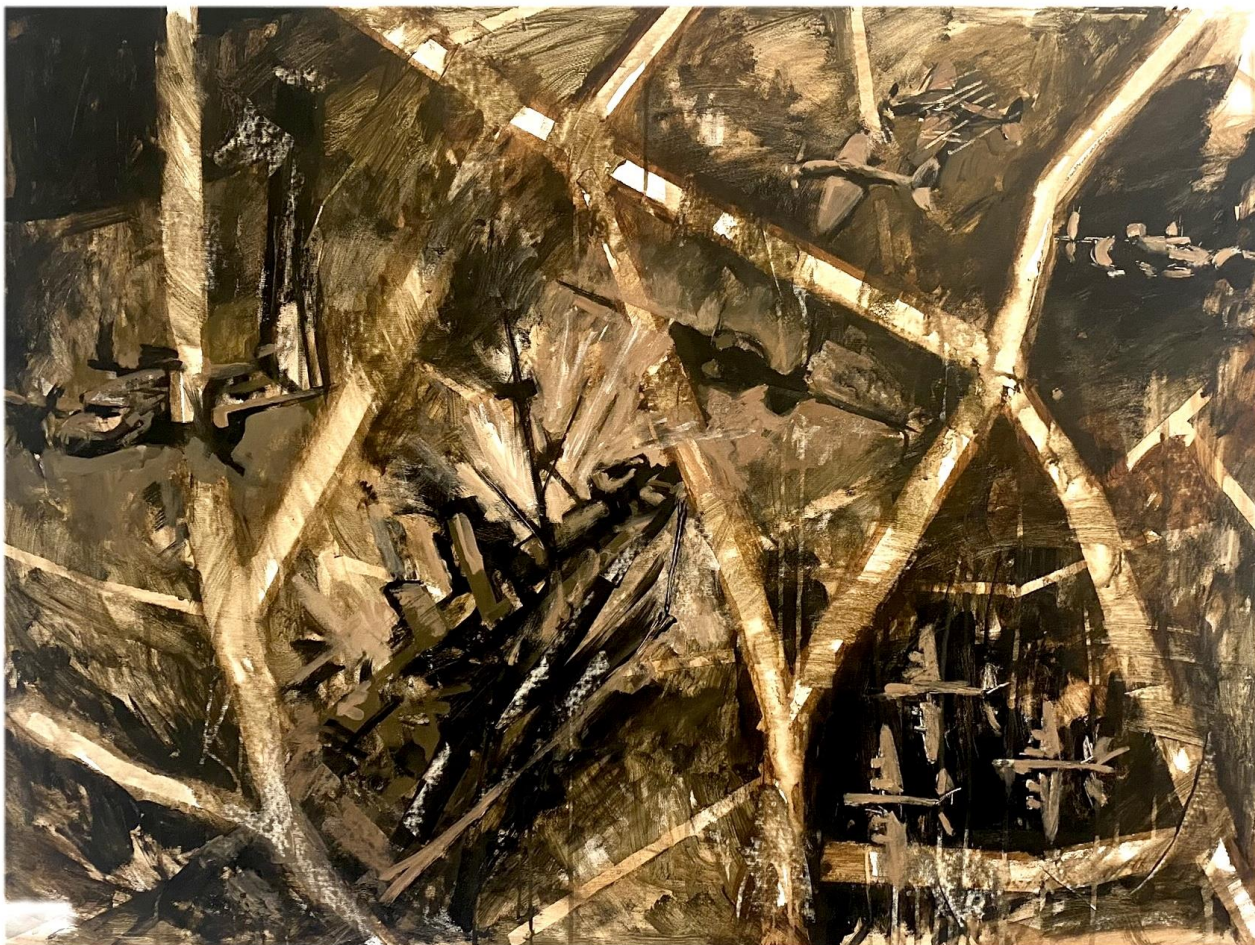
Slika 6. Bez Naziva 2023. 130x100cm, akril na platnu