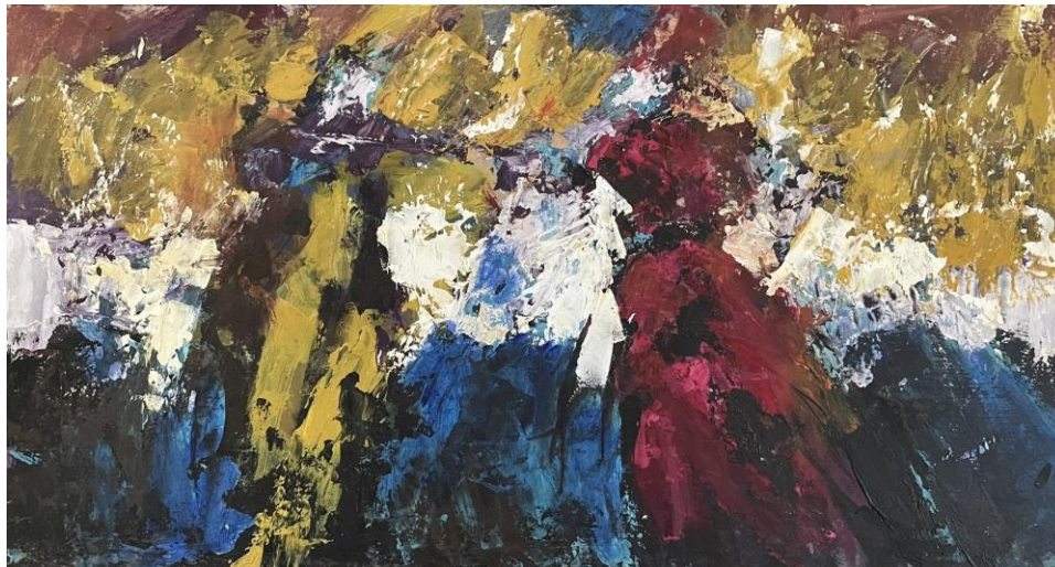
Slika 1. Bez Naziva 2022. 28x52cm, akril i kit za drvo na drvenoj dasci

dovoljno otvoreni da promatrač može u njima pronaći vlastito značenje, ispričati svoju priču o njima.