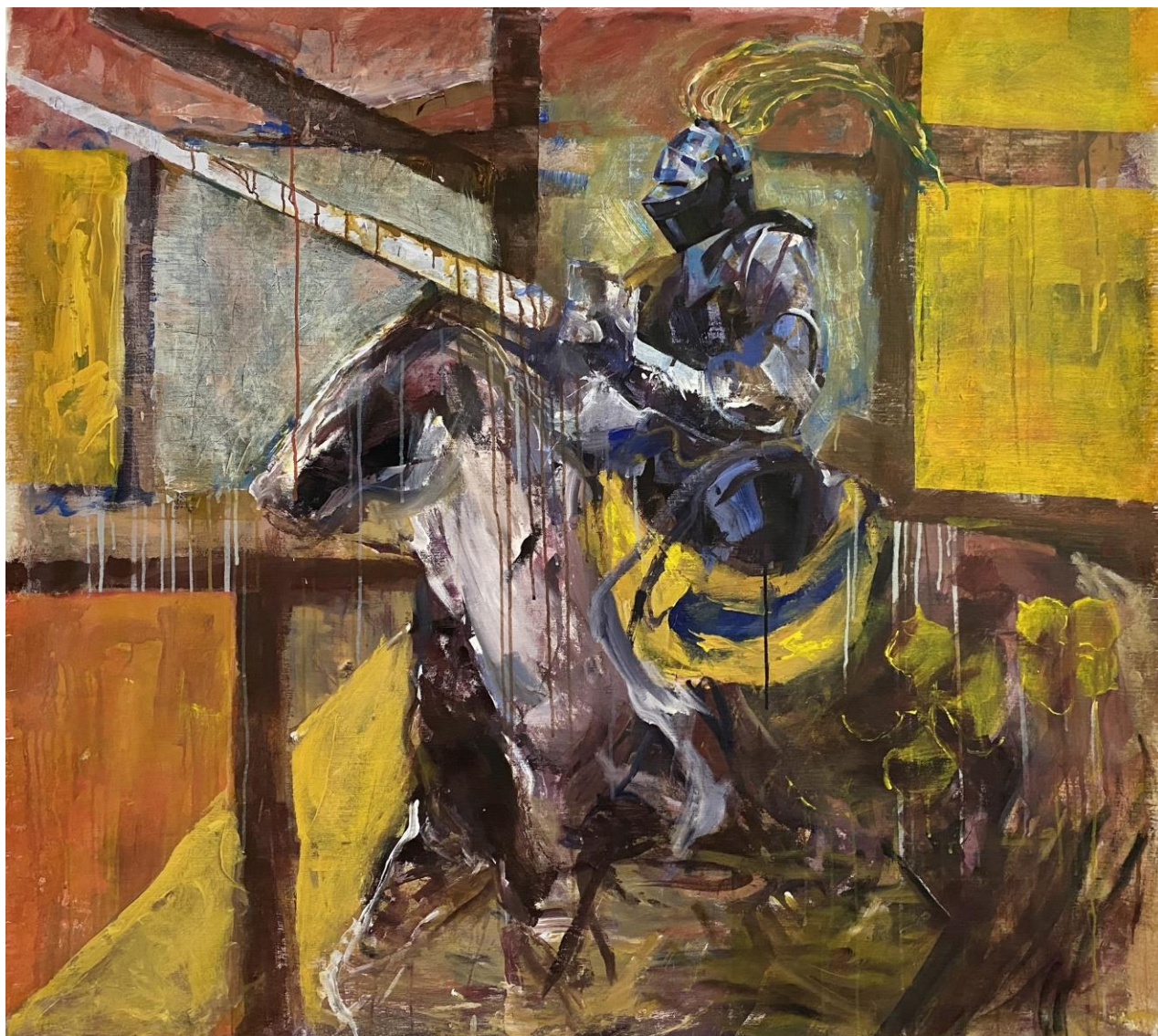
Slika 4. Bez Naziva 2022. 150x160cm, akril na platnu