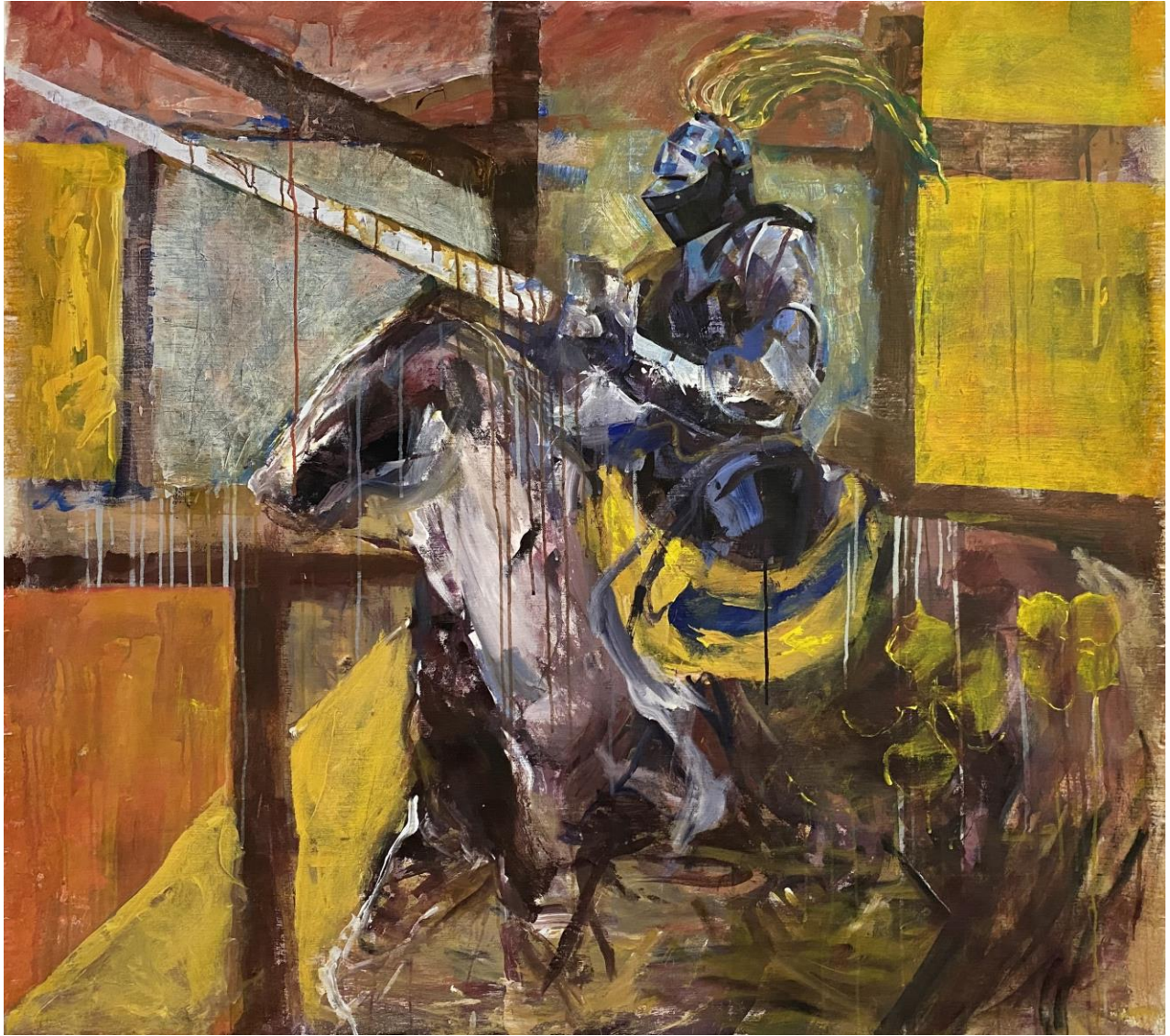
Slika 4. Bez Naziva 2022. 150x160cm, akril na platnu