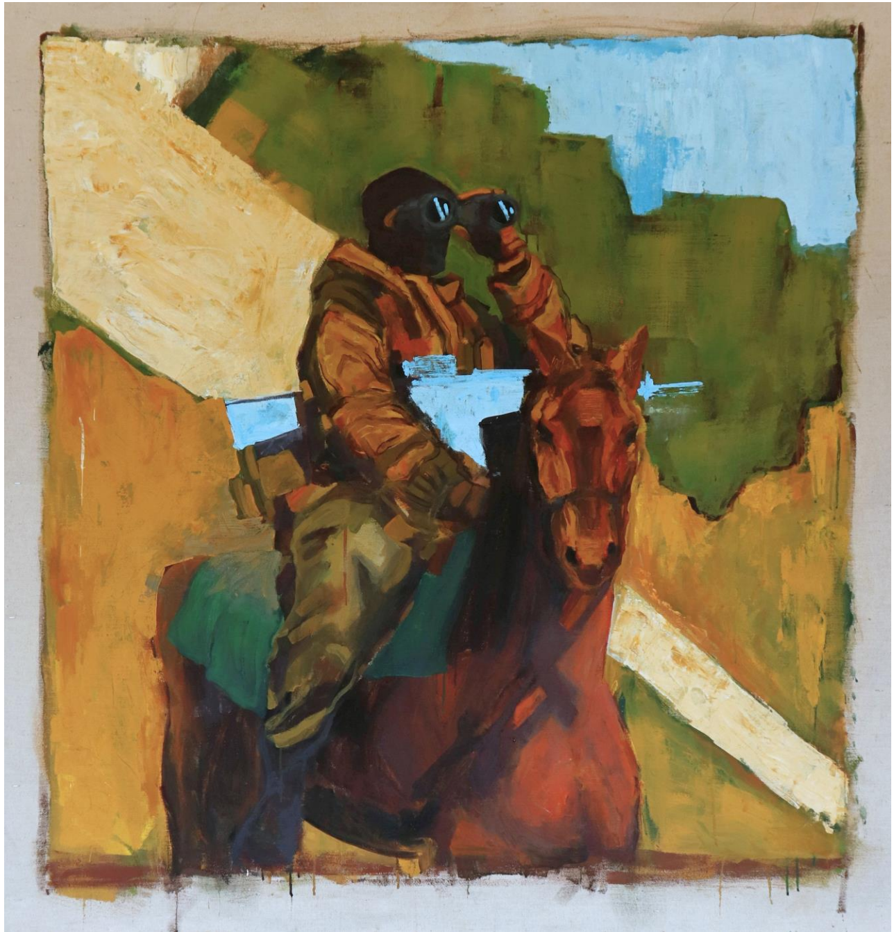
Slika 13. Bez Naziva 2023. 170x150cm, akril na platnu