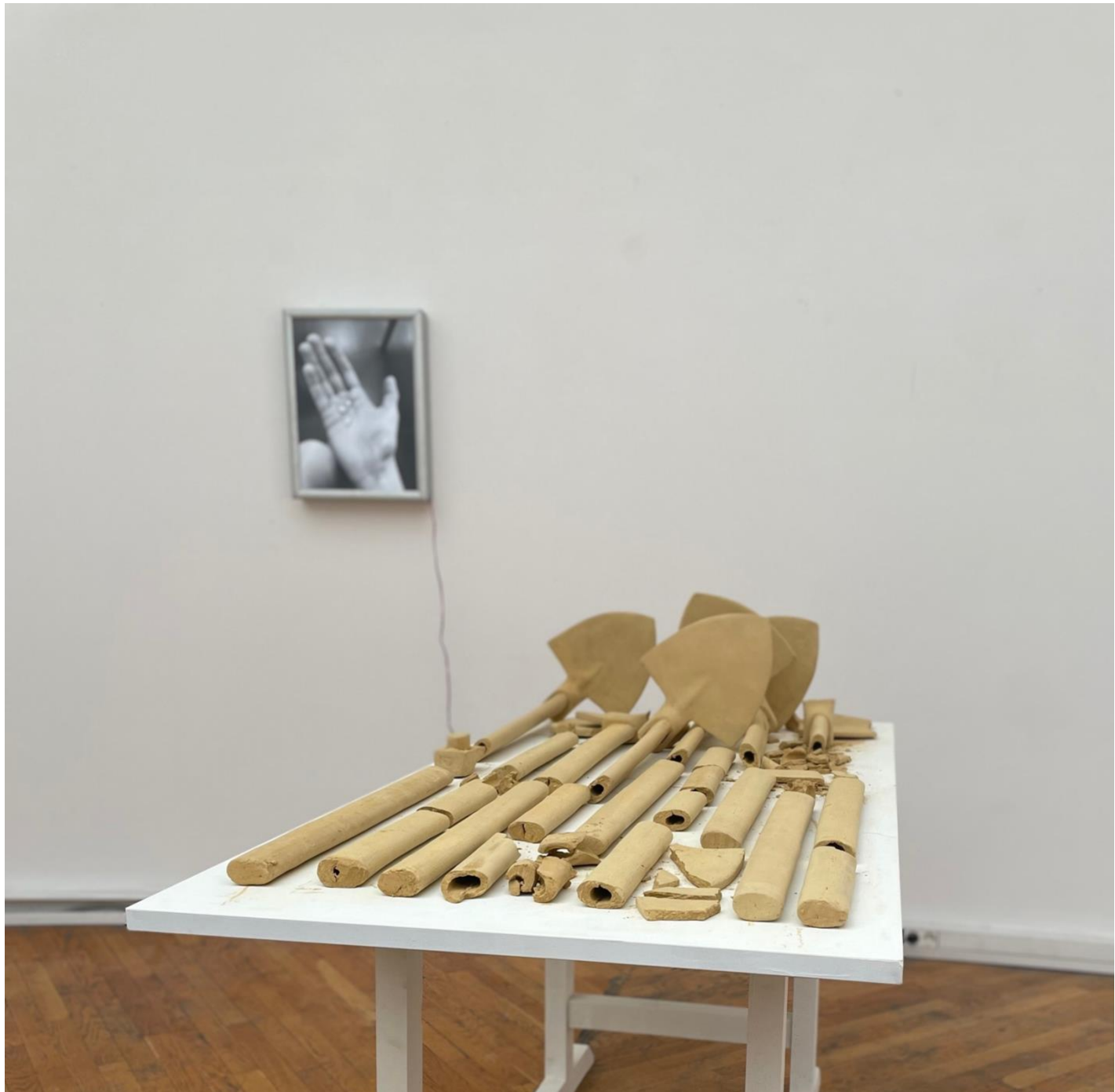
prilog 5. fotografija postava sa izložbe ALU Perspektiva 2 HDLU 2023.