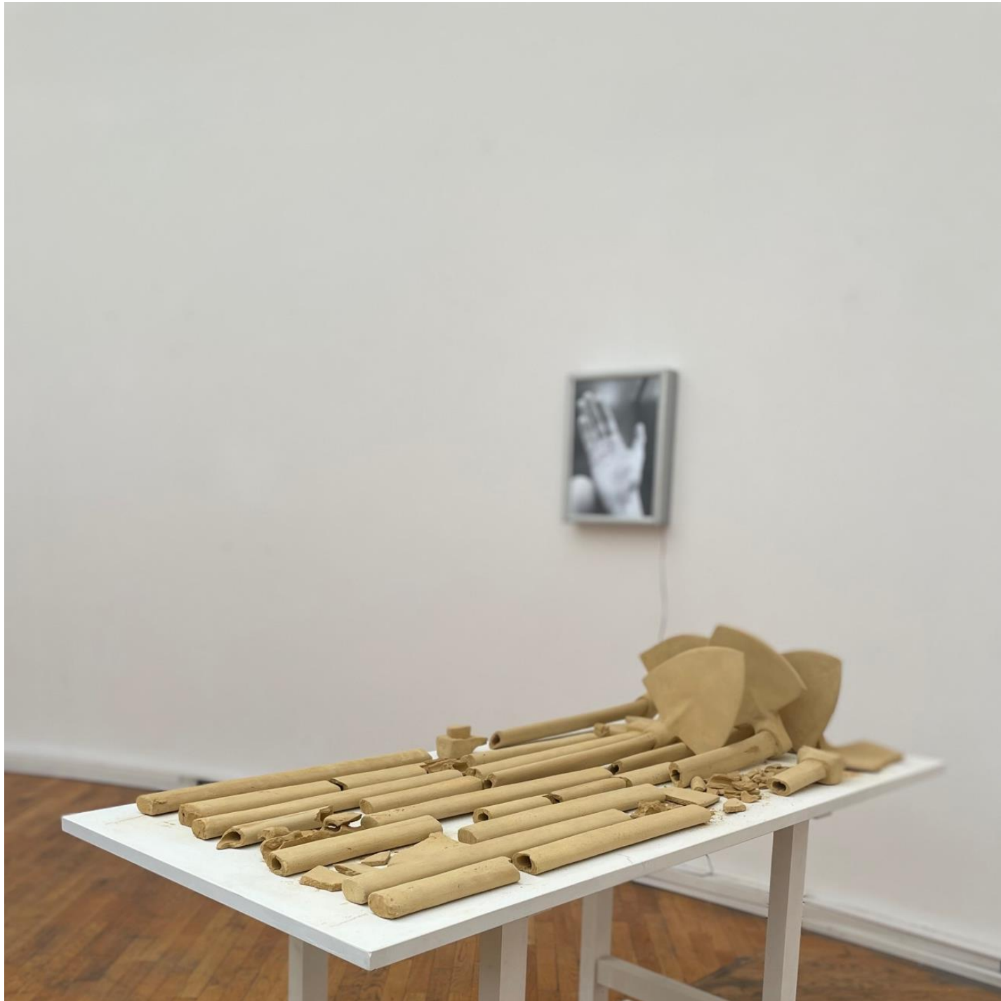
prilog 3. fotografija postava sa izložbe ALU Perspektiva 2 HDLU 2023.