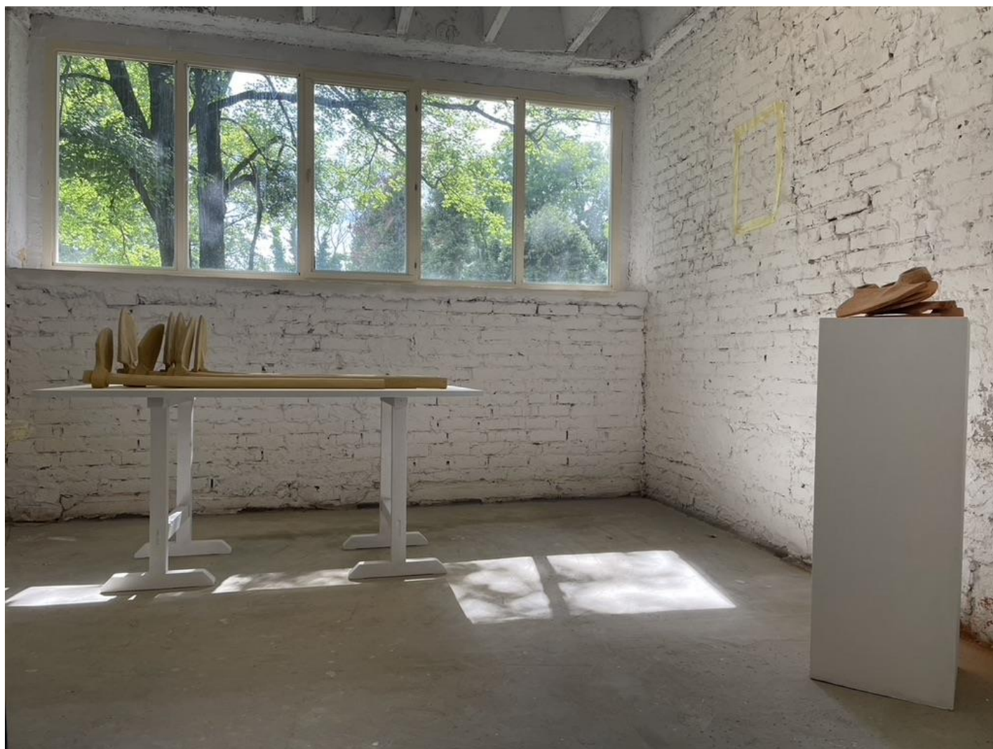
prilog 1. fotografija postava sa Završne izložbe ALU Jadranfilm 2023.