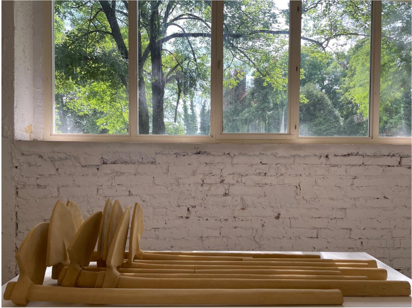
prilog 2. fotografija postava sa Završne izložbe ALU Jadranfilm 2023. (detalj)