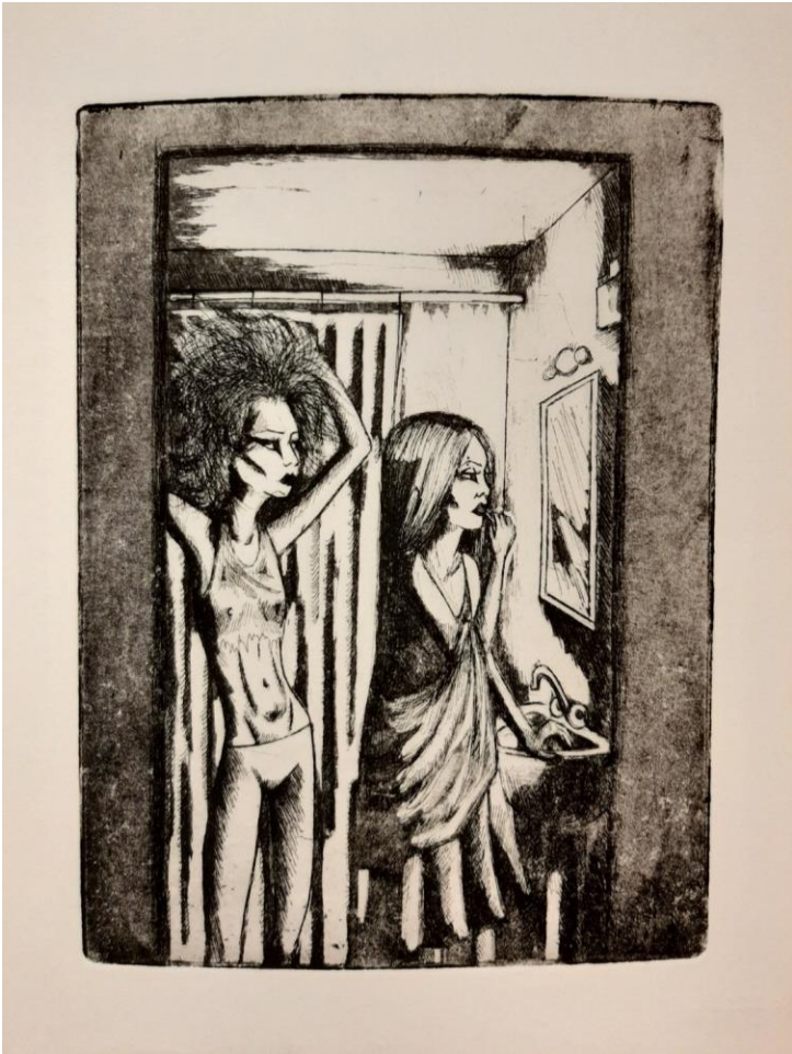
Gotičarke, 2023., bakropis, akvatinta, 21 x 27 cm