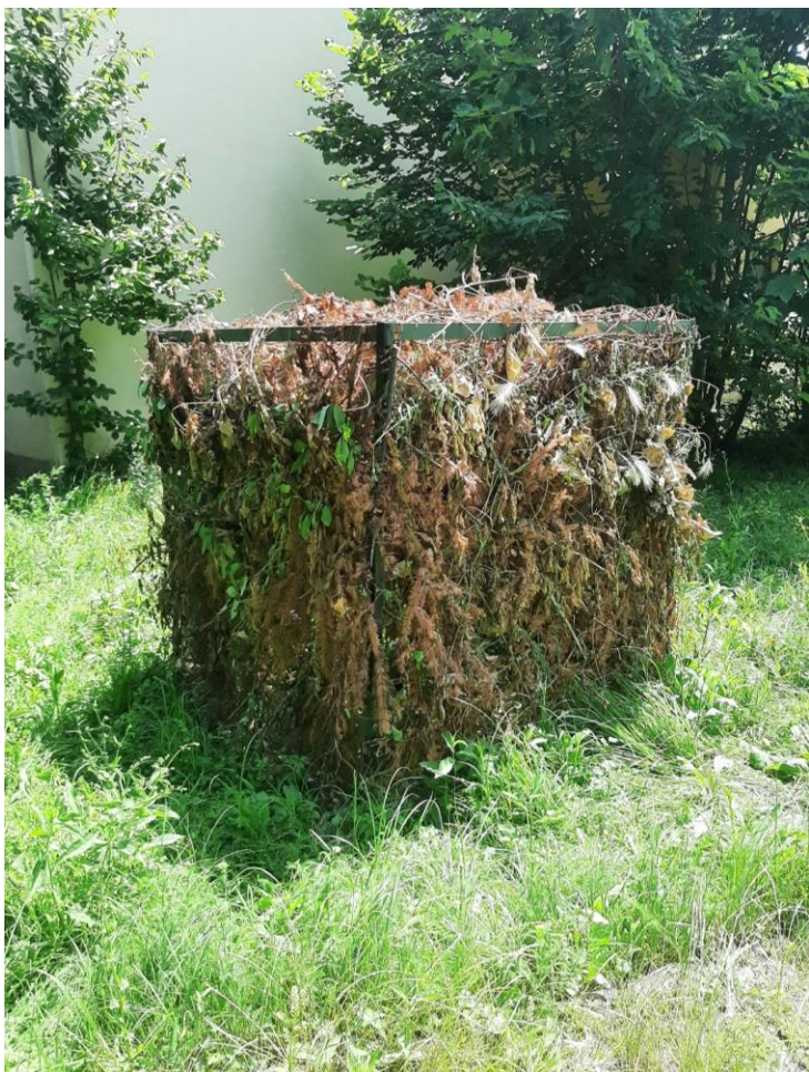
Unutarnja vanjšina ispred zgrade Akademije na Jabukovcu, lipanj 2023.