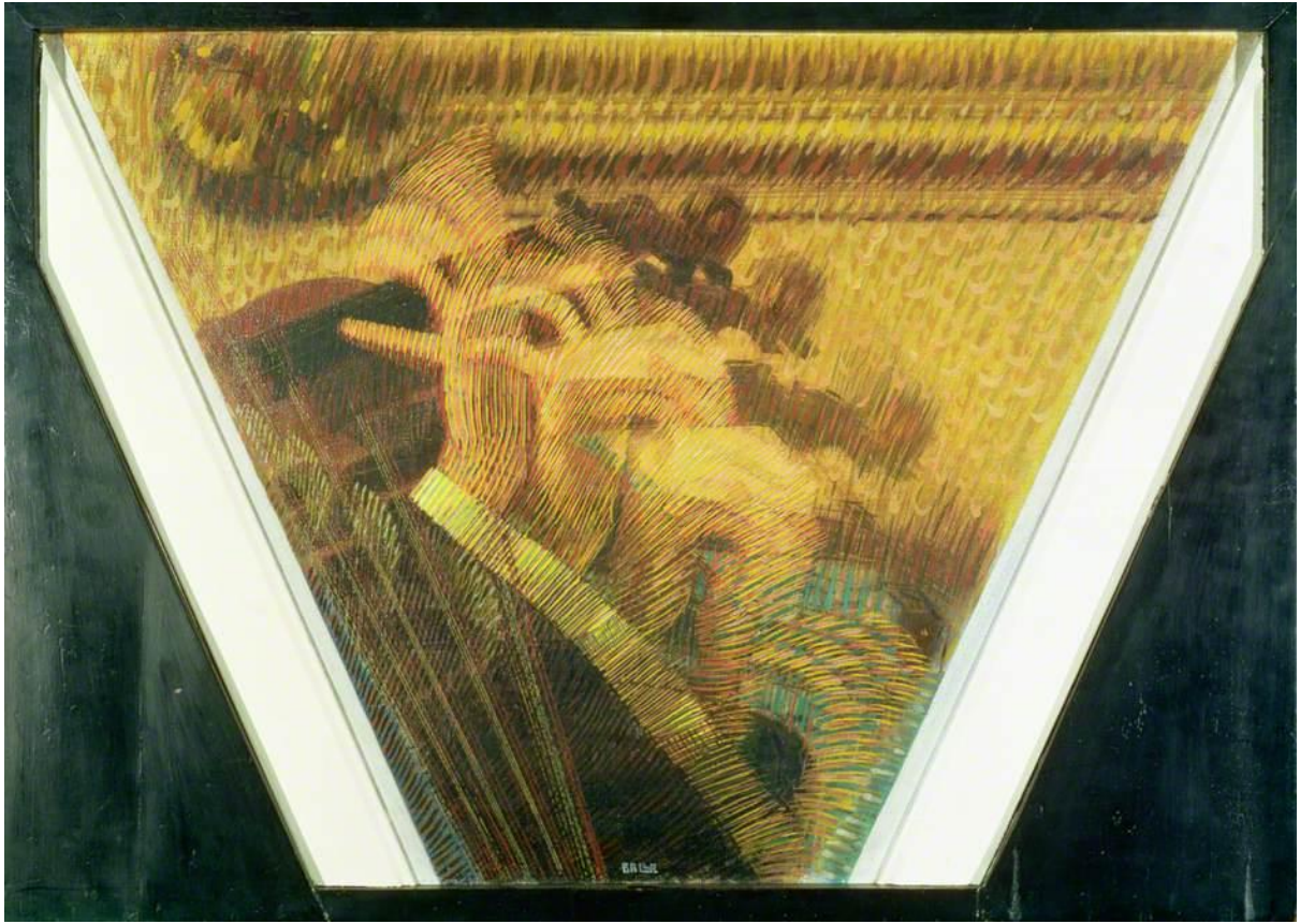
Giacomo Balla, Ruka violiniste , 1912.