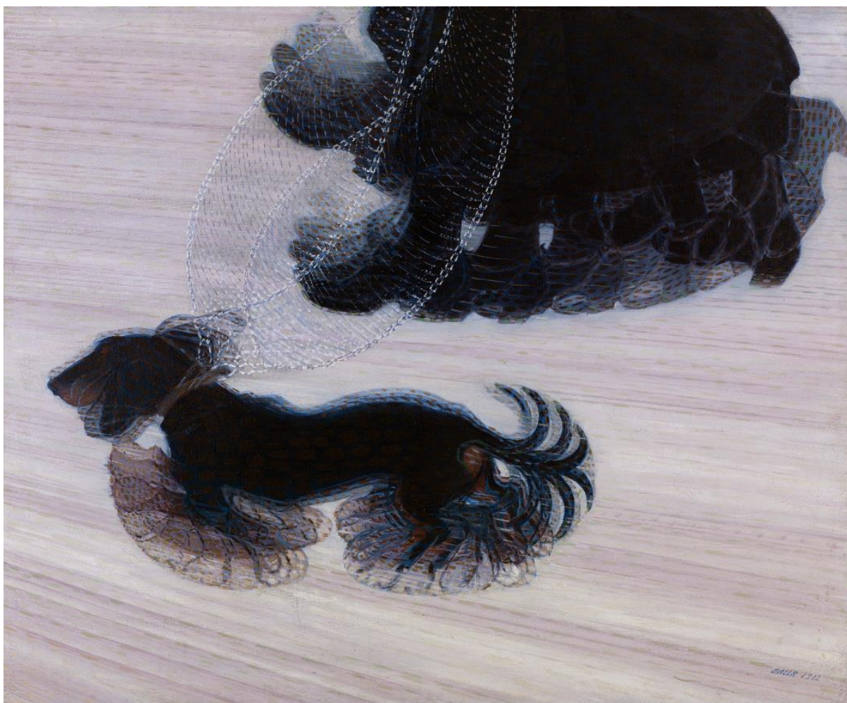
Giacomo Balla, Dinamizam psa na uzici , 1912.