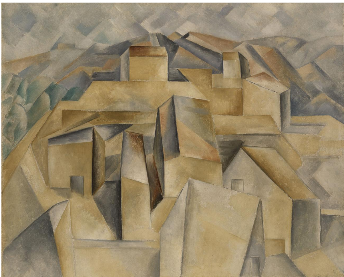
Pablo Picasso, Kuće na brdu , 1909.