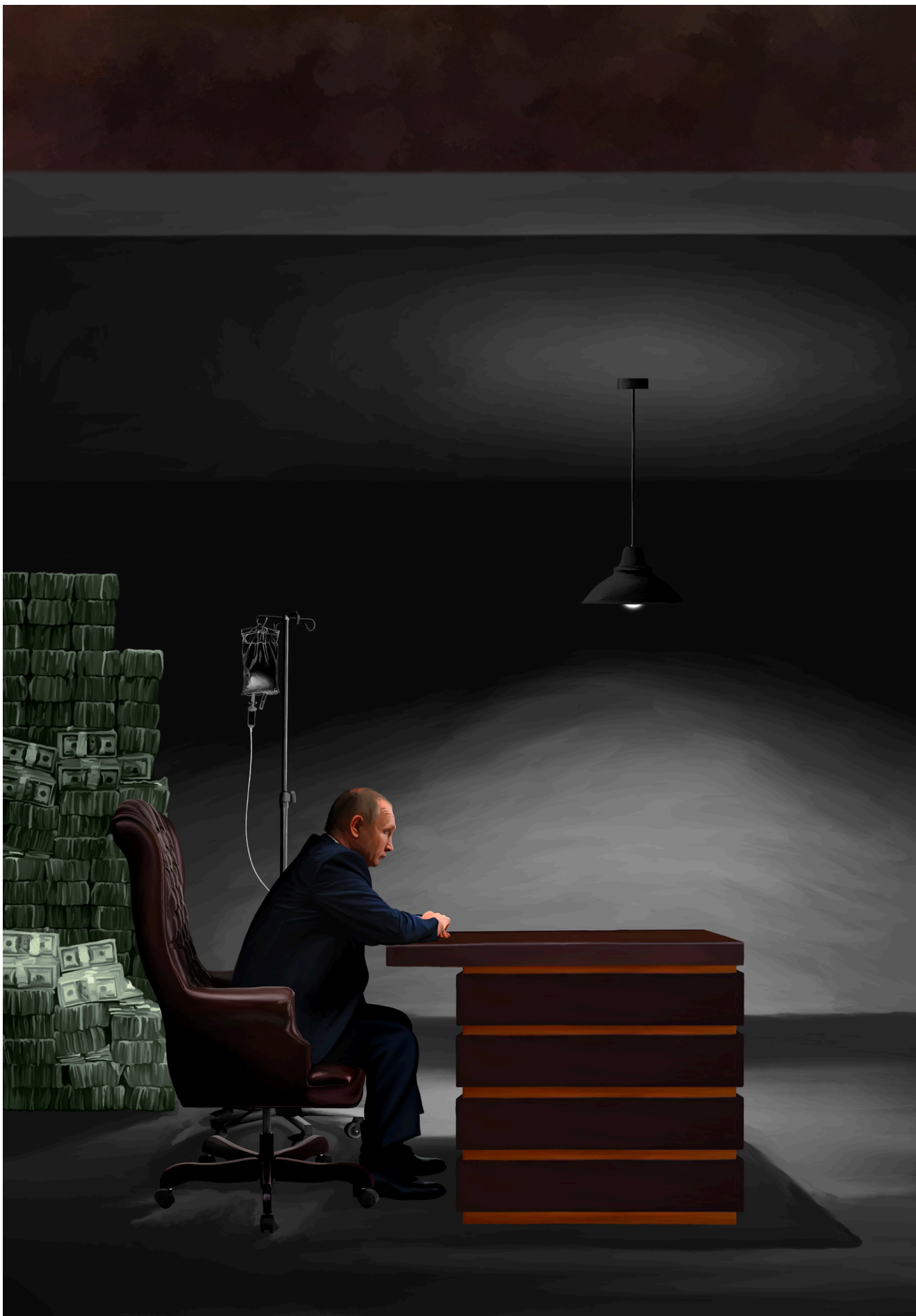
Mr. Lonely - digitalni crtež, 100x70 cm