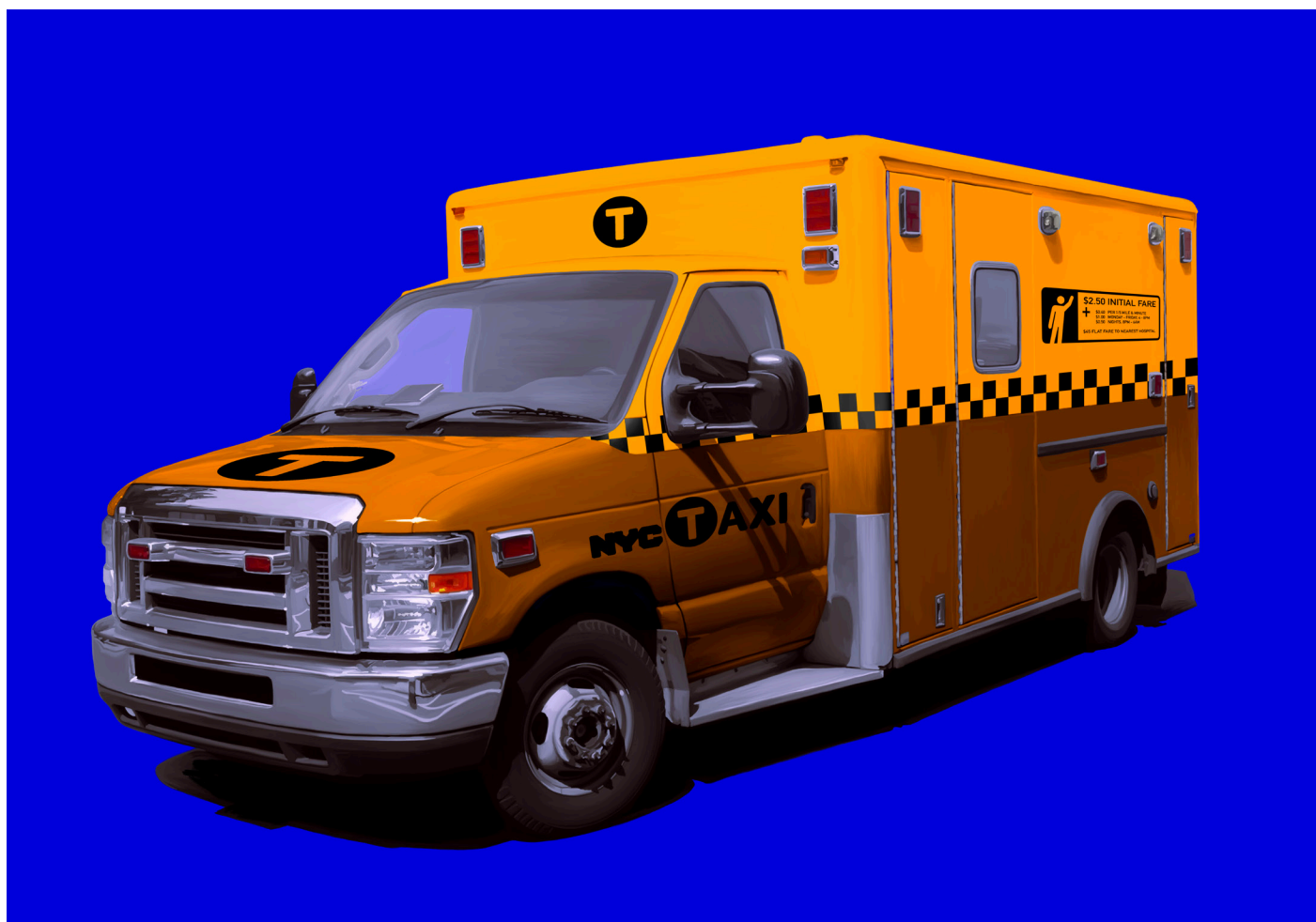
Sad Reality - digitalni crtež, 70x100 cm