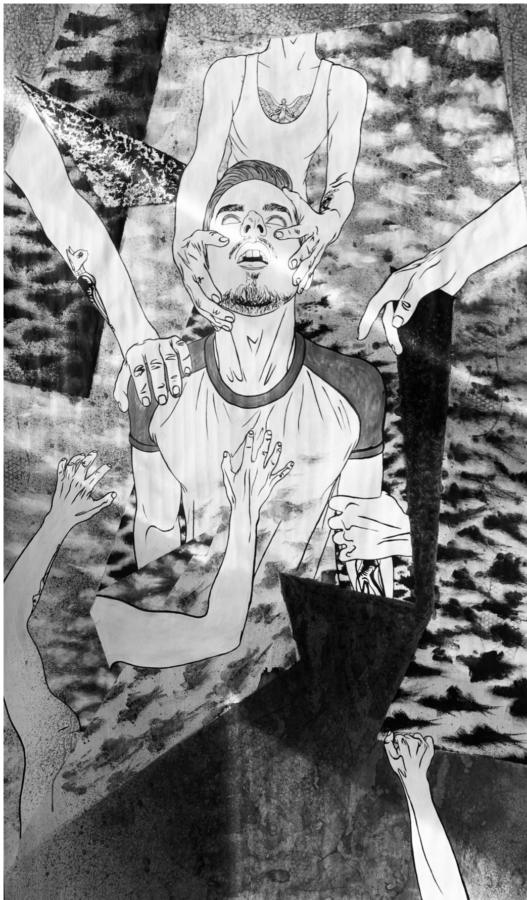
Iskušanje , platno IX, akril na pak papiru, 115x210 cm, 2019.

Art should be something that liberates your soul, provokes the imagination and encourages people to go further.