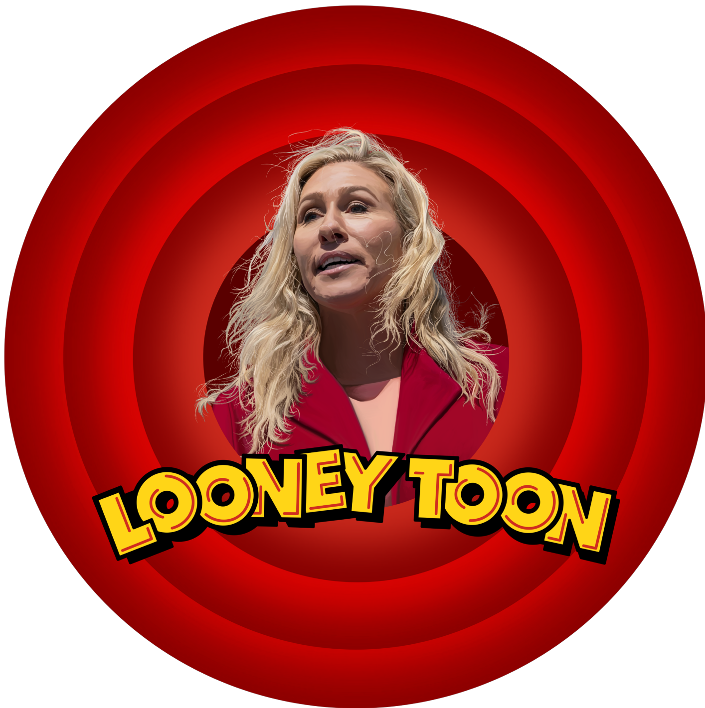
Looney Toon - digitalni crtež, 100x100 cm