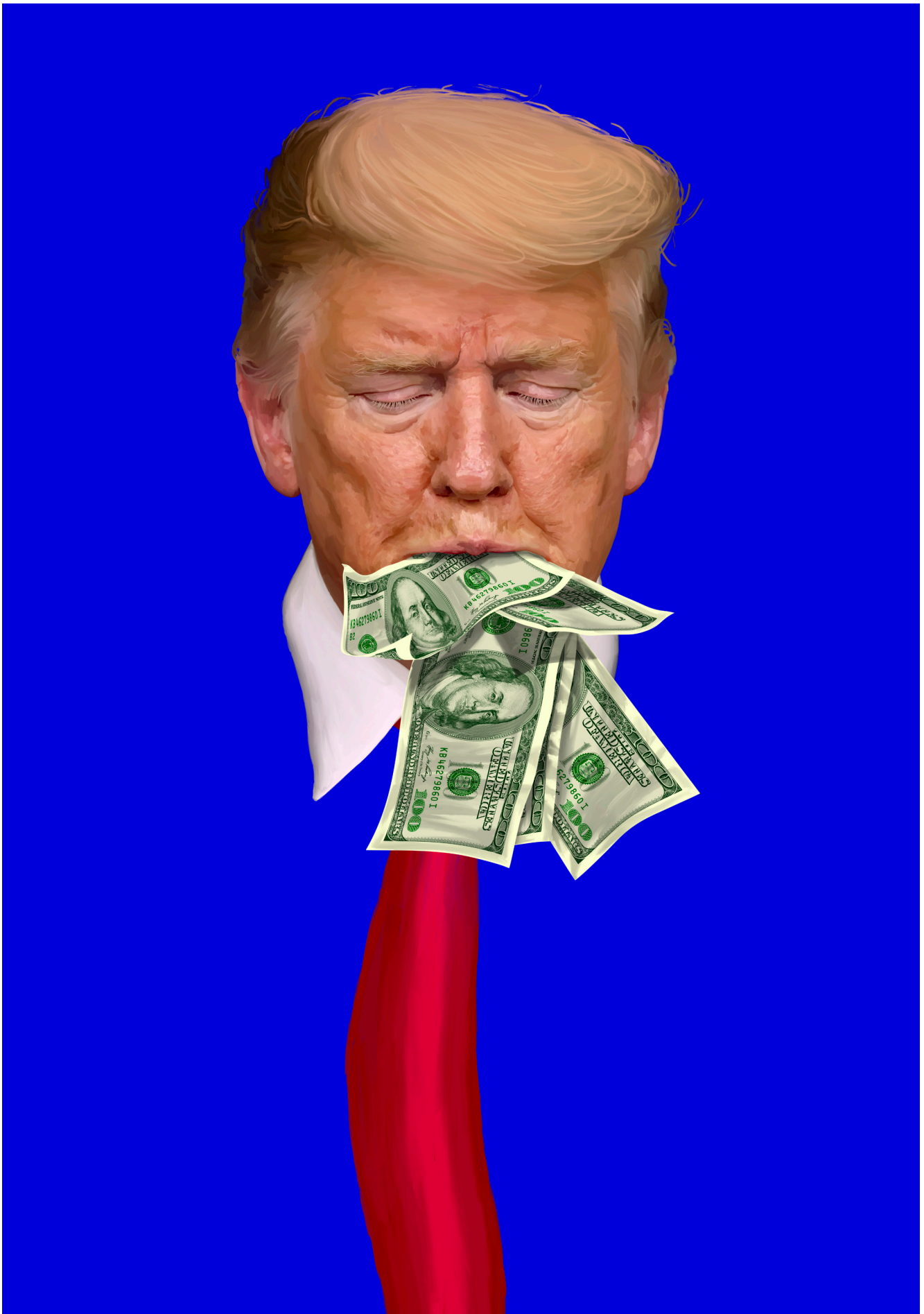
Automated Teller Machine - digitalni crtež, 100x70 cm