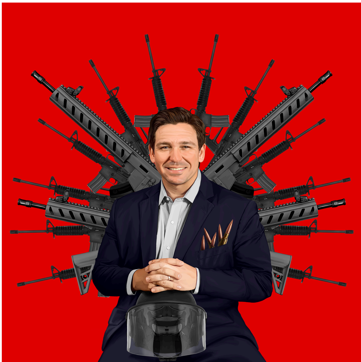
Ron DeScammer - digitalni crtež, 100x100 cm