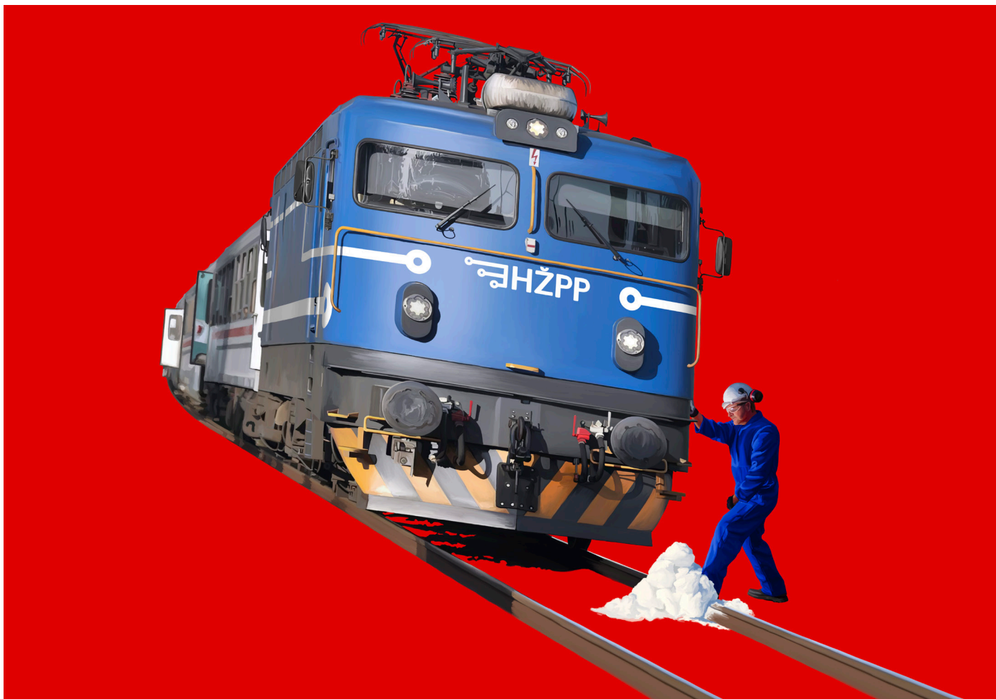
Kasnimo 190 Minuta - digitalni crtež, 70x100 cm