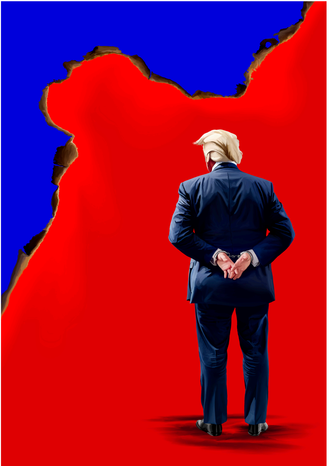
Beginning to Fall Apart - digitalni crtež, 100x70 cm