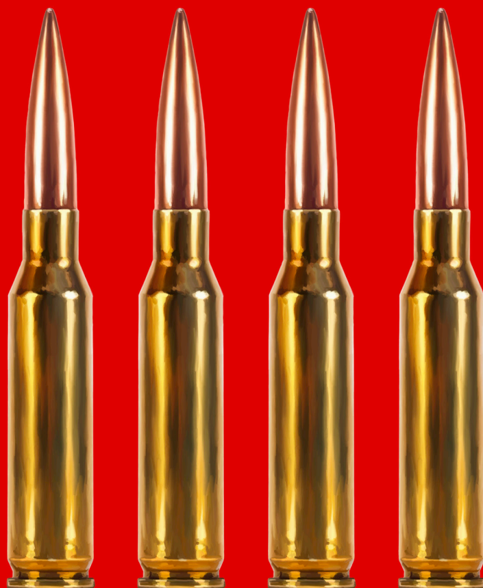
Curriculum Reform - digitalni crtež, 100x70 cm