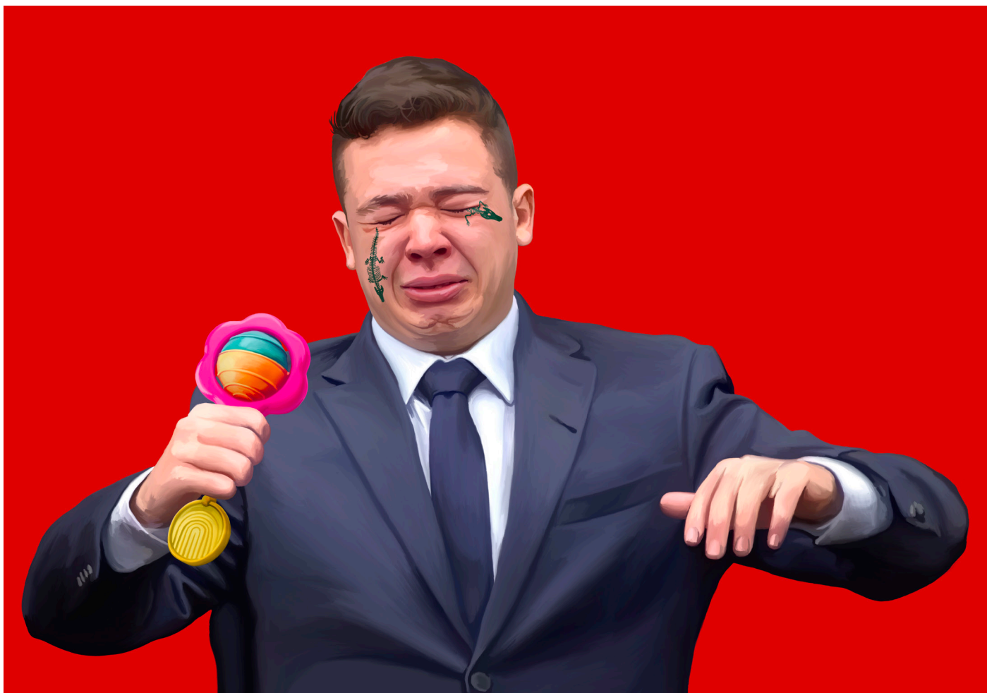
Cry Baby - digitalni crtež, 70x100 cm