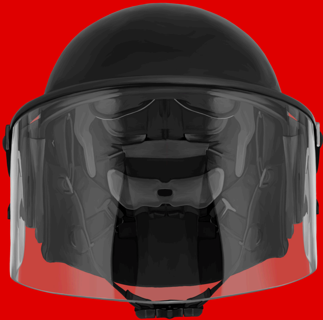
Back to School - digitalni crtež, 100x70 cm