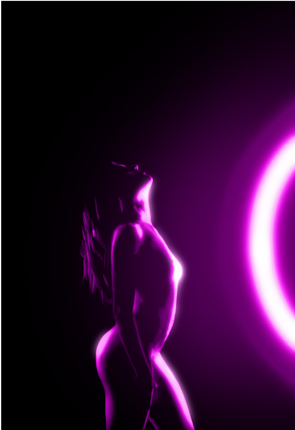
Akt , digitalni crtež, 100x70 cm, 2021.