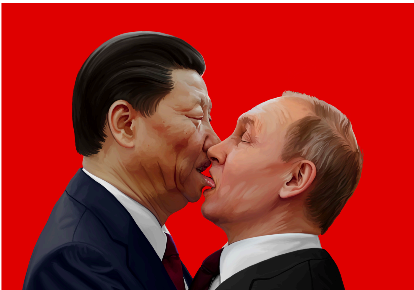
Oh, Comrade, Help Me to Summon Stalin - digitalni crtež, 70x100 cm