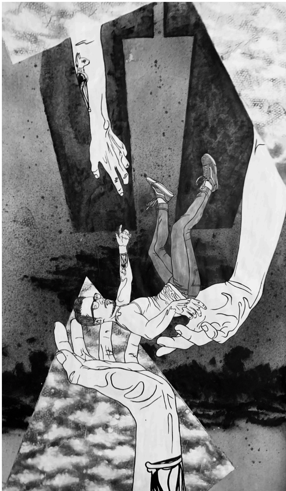
Iskušenje , platno X, akril na pak papiru, 115x210 cm, 2019.

Naravno da postoje teški periodi i trenutci slabosti u kojima te nešto sprečava u radu. Zato uvijek pokušavam zadržati moment kada radim. Taj moment održava na životu strast koja je u potpunosti predana ovome, koja zahtijeva njegu, ali koja ako i bude ponekad u blokadi, samo čeka trenutak za ponovni skok u pogon.