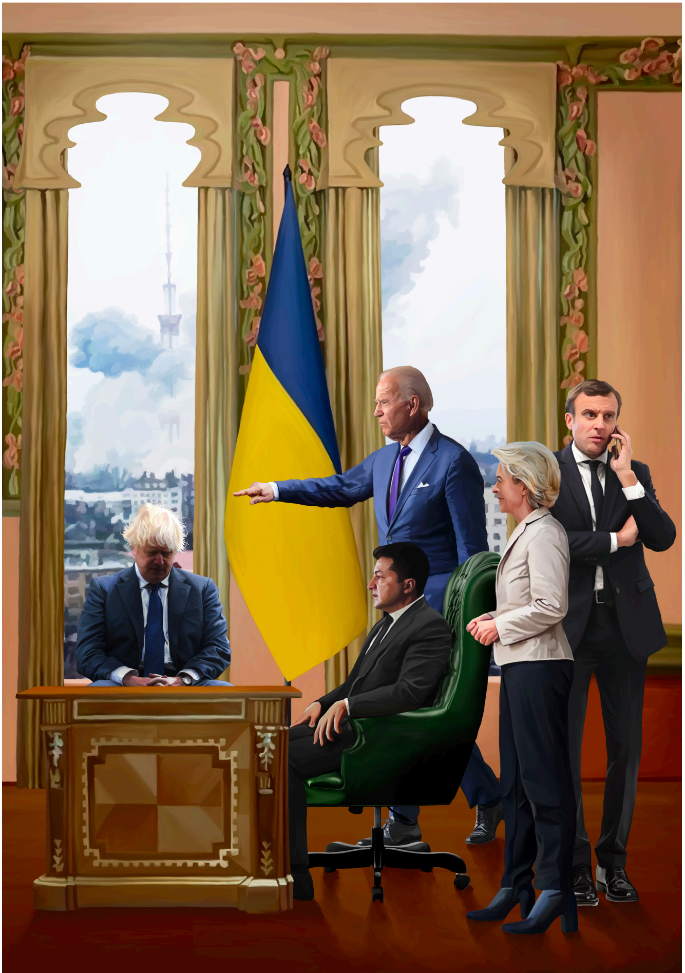
The Shield - digitalni crtež, 100x70 cm