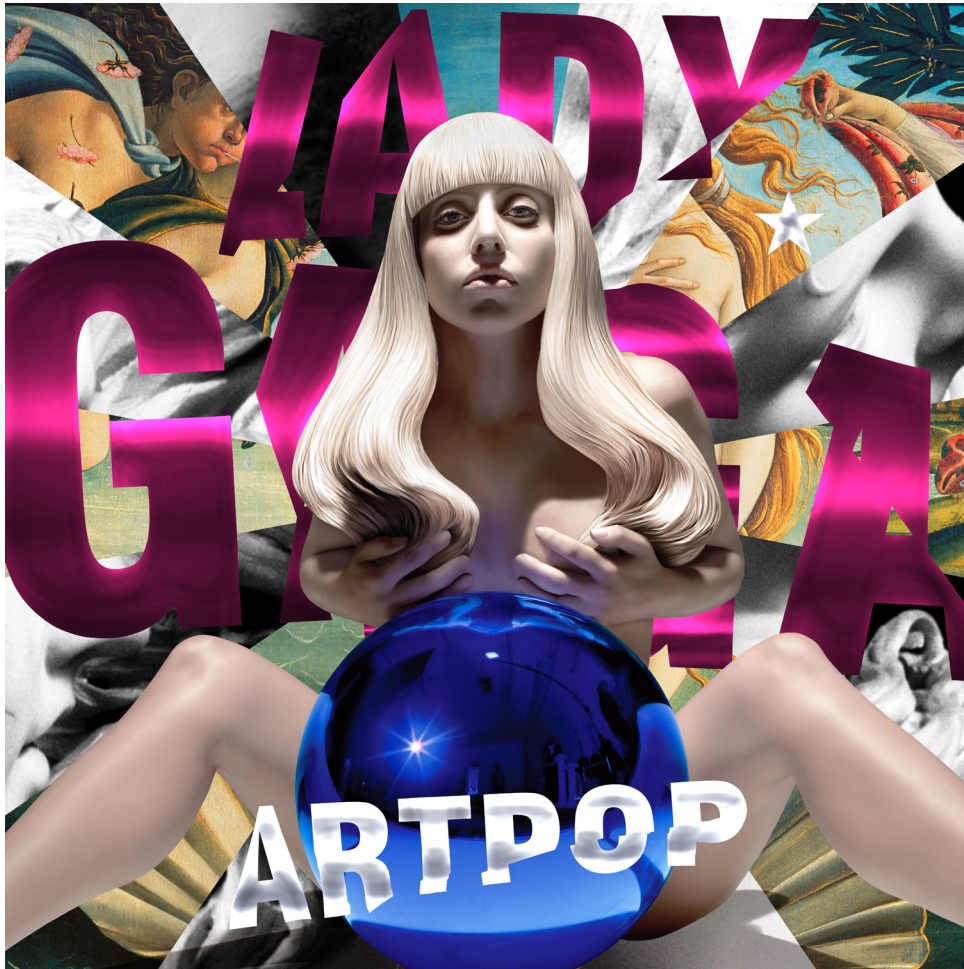
ARTPOP album cover, Jeff Koons za Lady Gagu

The job of the artist is to make a gesture and really show people what their potential is. It's not about the object, and it's not about the image; it's about the viewer. That's where the art happens.