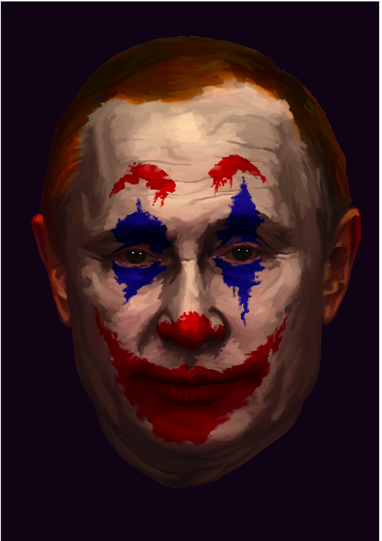
The Emancipation of a Sociopath- digitalni crtež, 100x70 cm