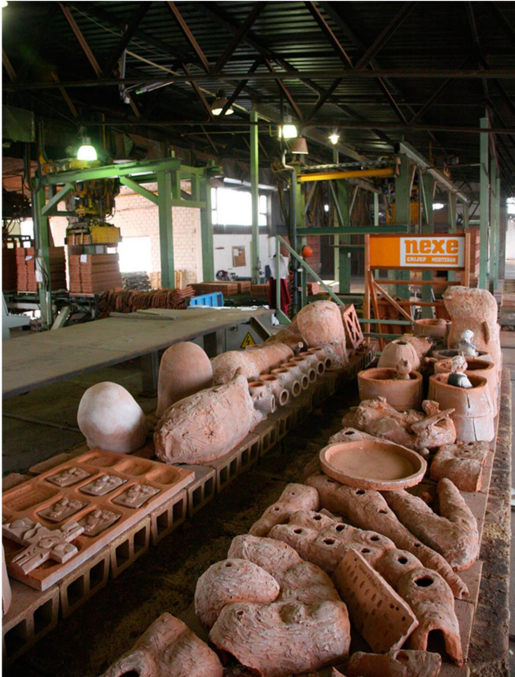
Pečenje glinenih skulptura u pogonima tvornice Dilj, Vinkovci, 2010.

Postavljanje skulpture u javnom prostoru nailazi na brojne ideološke i fizičke prepreke koje je onemogućuju. Činjenica je da se sredstva za proizvodnju skulpture ne nalaze u rukama umjetničkih radnika (da se poslužimo marksističkom terminologijom) i da u izgradnji koncepata ne sudjeluje samo autor, daje mediju skulpture (u odnosu na ostale medije) kolektivni karakter. Pošto su za izvođenje skulpture potrebna znatna javna sredstva, potrebno je samu proizvodnju skulpture staviti u kontekst novih kapitalističkih ekonomskih procesa koji je uvjetuju.