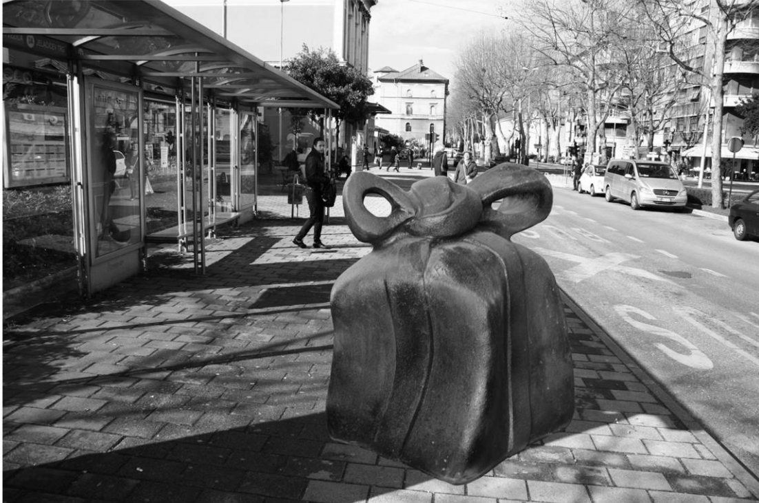
Kaboom!, fotomontaža skulpture Kaboom! u Krešimirovoj ulici, Rijeka, 2010. glazirana terakota, 78x64x60

Sad sam odlučio „zaviriti u vlastiti sadržaj“ (G. Baselitz), ne u smislu eksplicitnog ekspresionističkog izraza u formalnom tretiranju kiparskog medija kojim se bavim, nego više u smislu zauzetog stava prema kojem se odlučuje upravo putem opipljive stvarnosti ali istovremeno i znaka. Ovo nas vraća do samog „Trojanskog konja“- simbola poklona koji to nije. Simboličko značenje predmeta koji sam odabrao se može iščitavati kao početak novog ciklusa, tj. darovi se daju da bi novi ciklus započeo povoljnim znakom, predznakom (paketom) izobilja (ovaj put - misaonih operacija!). No, tu se sada događa paradoks: započeti ciklus je stavljen pod sumnju i to zvukom, tiktakanjem (koje bi u drugoj prilici bio tek monotoni „bilježnik“ protoka vremena) čime se paketi i tiktakanja međusobno dokidaju, ali i uspostavljaju. Taj paradoks stvara osjećaj nelagode, ali istovremeno jača svijest o skulpturi kao šupljem predmetu čime se remeti uobičajena struktura gledanja, od izvanjskog prema unutrašnjem, koja sada ustupa mjesto gledanju od unutrašnjeg prema izvanjskome.