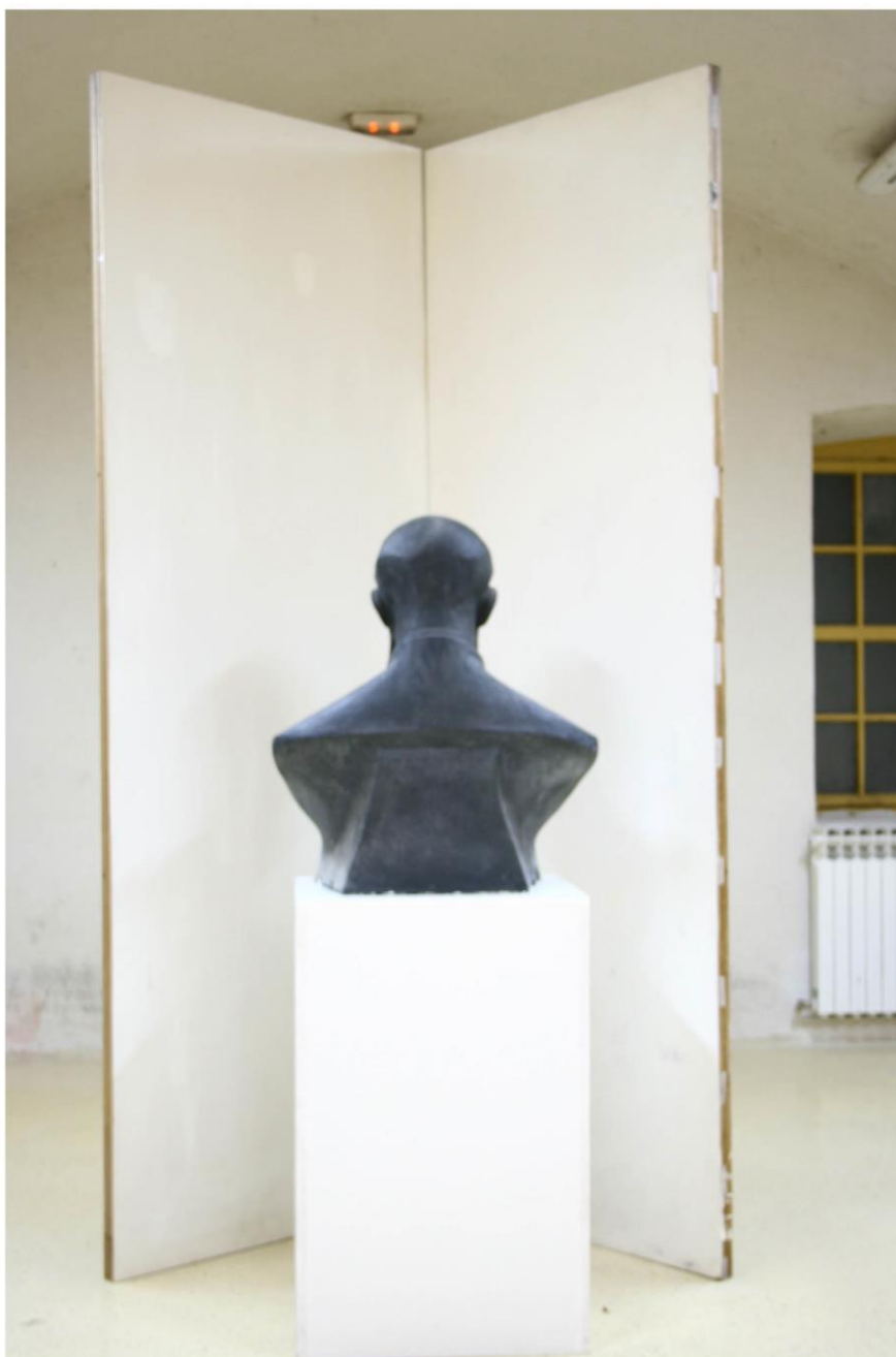
Bista u kazni, 2008., gips, 56x32x23

Ono spomeničko primarno značenje je van estetskih svojstava znaka. Rijetko se takvim skulpturama pretpostavljaju kriteriji umjetničkog djela. Kada realnost biste (kao plastičnog znaka) nadvlada, dolazi do zamjene odnosa – jednog značenja za mnoga značenja kojima je skulptura tek medij te preobrazbe. Tamo i onda, kada je stvarnost spomenika tako jasna sama po sebi da mu je značenje nedodirljivo, otvaraju se međuprostori koje prepoznajem kao umjetničke prostore.