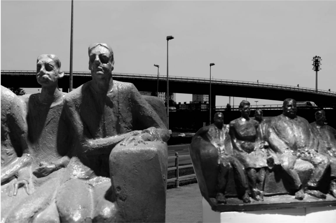
Ljudska porodica, fotomontaža skulptura kraj petlje na Aveniji Marina Držića, Zagreb, 2010.

„Nemjesta su prostori gdje se ne stvara jedinstveni identitet, nego samoća i sličnost. Umjesto organske društvenosti Nemjesta stvaraju samotnjačku ugovornost.“