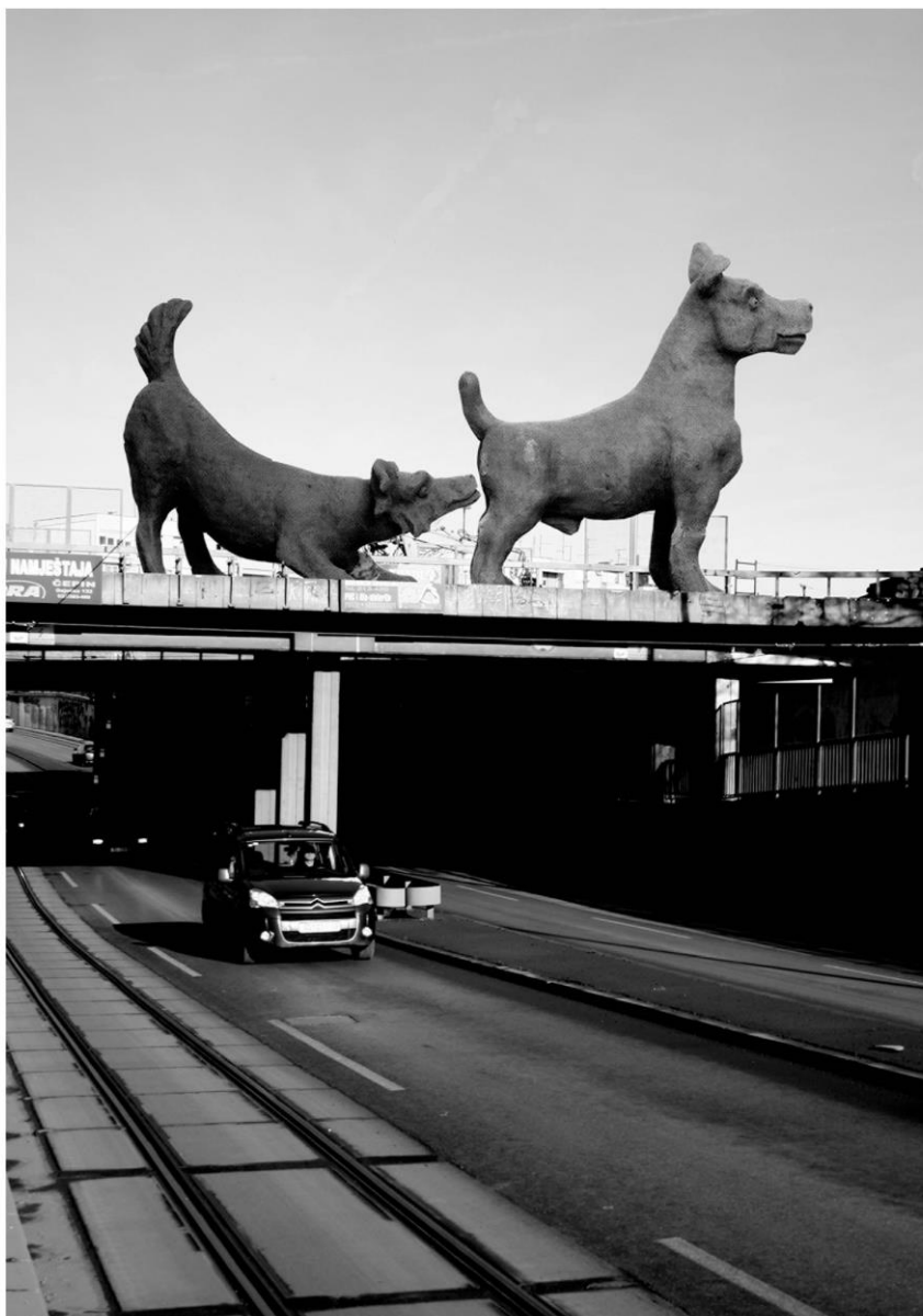
Intervju, fotomontaža skulptura na Vinkovačkoj ulici, Osijek, 2007. terakota, 70x62x22 cm, 68x62x21 cm

Skulpturi kao objektu u javnom prostoru postavlja se zadatak da reprezentira mjesto kao zajednički simbol. Logično bi bilo da u izgradnji takvog zajedničkog simbola sudjeluje cijela zajednica, no nailazimo na žalosnu poteškoću: na netoleranciju i mediokritetstvo mnoštva. Izgradnja koncepta, potrebna kreativnost i neobuzdana imaginacija, u pravilu, pripadaju individui. Kolektiv nije kreativan, kreativnost ne spada u javnu domenu. Javnost je zato moralna sfera, koja odobrava ili osuđuje kreativnost. Drugim riječima, prihvaća se individualna imaginacija kao zajednički simbol. Takva prihvaćena - postavljena skulptura na povratan način postaje kultura, dakle, prelazi iz individualne stvaralačke sfere u kolektivni identitet. Od objekta skulpture se očekuje da prevlada pojedinačnost te da se, poput kratkog spoja, premosti u zajedničko. Što je takav objekt radikalnije singularan – stvoren od pojedinca, to je više simbol slobode i tolerancije kulture grada.