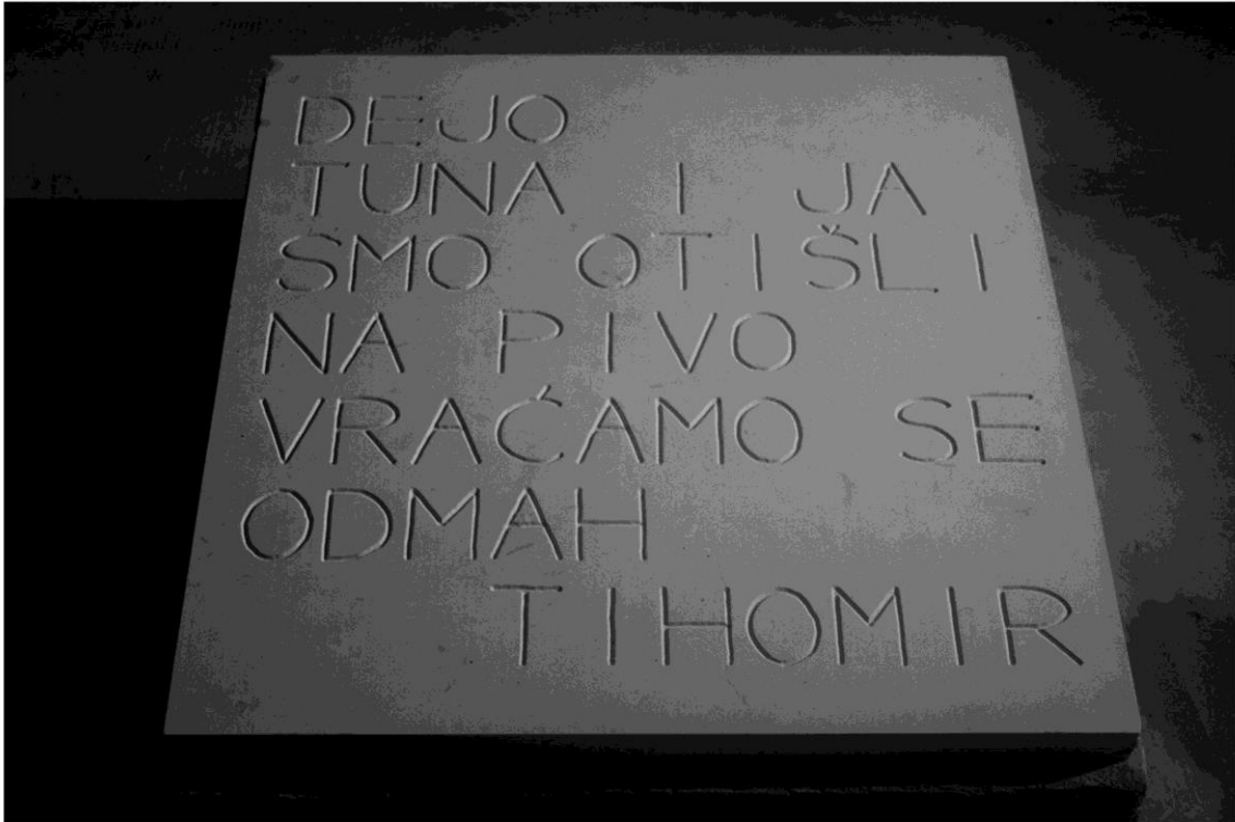
DEJO TUNA I JA SMO OTIŠLI NA PIVO VRAĆAMO SE ODMAH TIHOMIR trajni postav u centru Karlo Rojc, Pula, 2008., kamen, 70x70x20

Na spomen ploče uobičajeno je upisivati vrijeme – godine koje obilježavaju vrijeme smrti, rođenja ili povijesno značajnog događaja. Postoji vremenski slijed upisivanja – klesanja znakova, koji se opet čitaju u vremenu. Odnos medija, poruke i mentalnog odnosa dekodiranja. Na drugoj razini reprezentacije se može promišljati kamen od kojeg je napravljena. Vrijeme u kamenu!? Vrijeme njegove geneze, vrijeme obrade... Zamislim kako će ova spomen ploča komunicirati za sto ili petsto godina, kada dobije onaj potrebiti patos, kroz vremenski odmak - razgovora sa mrtvacem koji je otišao na pivo i više ga nema. Dok se sekunde pretvaraju u minute, minute u sate, mjeseci, godine, spomen ploča stoji sa paradoksom u sebi: govori o protoku vremena a želi biti vječna.