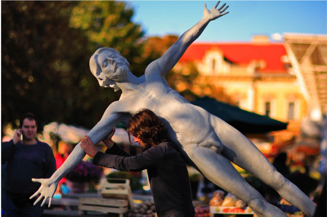
Windfucker, akcija na Trgu Ljudevita Gaja, Osijek, 2007.

Skulptura zauzima stav prema mjestu - semantičkom polju, stvarajući time sadržaj polja i vice versa. Mnogo je vrsta odnosa skulpture i polja grada; oni si mogu kontrirati, biti sukladni, nadopunjavati se, biti harmonični, posvađani... Energetski centar objekta se preklapa s energetskim centrom mjesta, ili samo dodiruje, uz iskre. Odnos spram mjesta - semantičkog polja može biti aktivan ili pasivan. To je karakter pozicionalnosti. Semantičko polje je pozornica objekata od kojih je jedno skulptura.