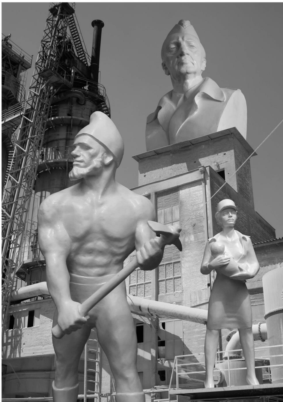
Vojnik, radnik i majka, fotomontaža skulptura u Luci, Rijeka, 2011.

Biti kipar u Hrvatskoj? Zemlji u kojoj je gotovo polovinu dvadesetog stoljeća postojao komunistički društveni sustav, za razliku od zemalja razvijenog kapitalističkog sustava. Tradicija je heterogena: s jedne strane je ukorijenjena na postavkama (soc)realizma, s druge na baštini visokog modernizma zapadnoeuropskog i američkog tipa. Odjednom, našli smo se u tranziciji. Kulturnoj? Odstranjuju se istočni - komunistički elementi naslijeđa, sada želimo pripadati samo europskom - zapadnom kulturnom krugu. Mislim da je izgradnja identiteta, ipak malo složeniji postupak.