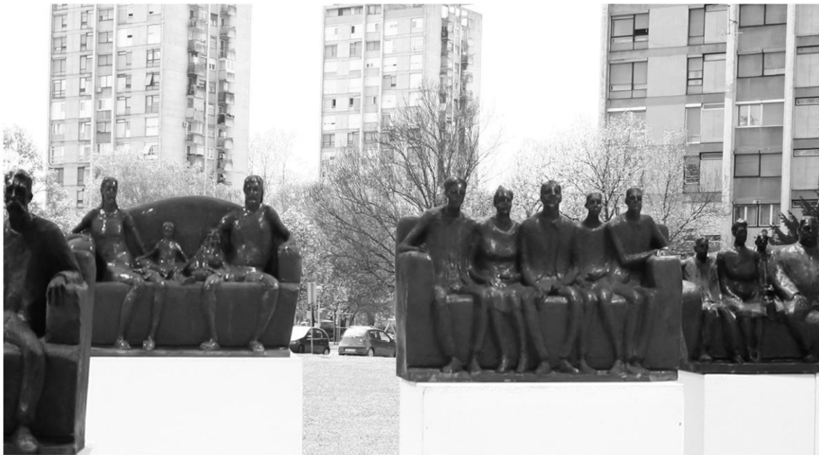
Ljudska porodica, fotomontaža 6 skulptura u naselju Siget, Novi Zagreb, 2010. glazirana terakota, 60x76x40 cm glazirana terakota, 39x65x30 cm glazirana terakota, 59x62x35 cm glazirana terakota, 53x77x35 cm glazirana terakota, 44x80x38 cm