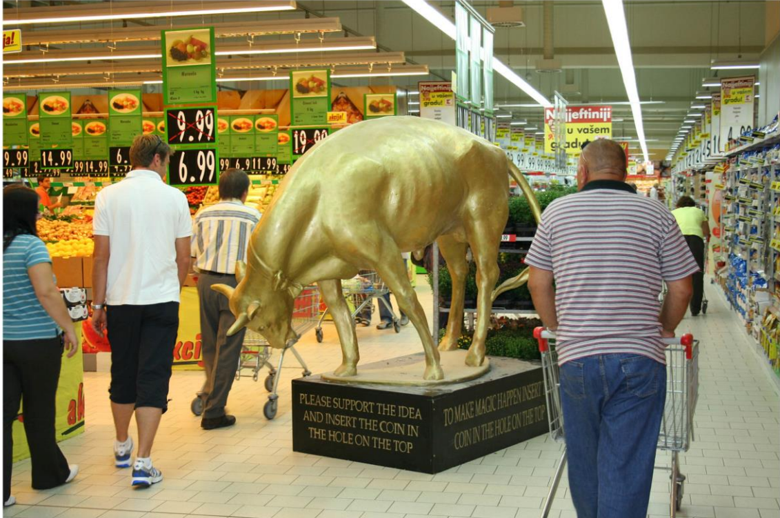
Akcija Kaufland, jednodnevni postav skulpture To Make Magic Happen u robnoj kući Kaufland, Osijek, 2009. poliester, drveni postament, 200x157x200 cm

Kada se govori o „pravom bogatstvu“, govori se o „unutarnjim vrijednostima“ koje određena osoba ili objekt posjeduje. Gdje je to unutra? Što je to vrijedno? Što pretvara nešto što je posve obično u nešto što je misteriozno i složeno. Ono misteriozno u skulpturi, kao i u svakom umjetničkom djelu, je proces nastanka koji ostaje skriven. Tajna koju treba otkriti je oblik društvenog života koji stvara i dešifrira. Distribucija i produkcija djela je proces koji ostaje skriven iza djela i analiza tog procesa raspršuje čaroliju.