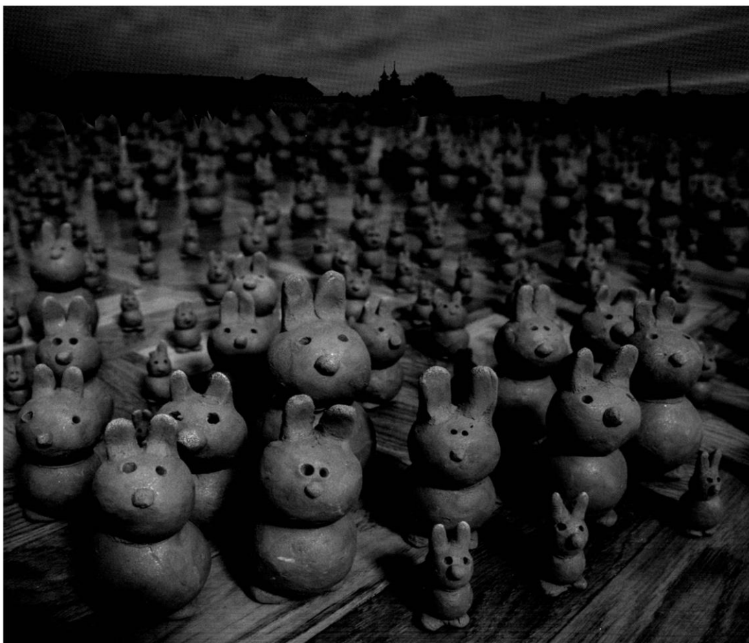
Zečja posla, fotomontaža tisuću skulptura zečića ispred Tvrđe, Osijek, 2001./2008. terakota, cca 1000 x (vis./h. 5-15 cm)

Subjektivnost je stalan društveni proces stvaranja, oblikuje se i na društvenom polju ali i na povratan način, putem vlastitih radnji, stvara se stvaranjem. Mnoštvo subjektivne sinergije grada sačinjava kulturu koja je po definiciji kolektivna i objektivna na čemu počiva cjelokupna demokratska vizija društva. Kultura je vezivna moć kolektivnog tijela, borgovski nadmozak, javna mreža normi i pravila; ona je iznad osobno - privatnog izražavanja. Javna umjetnička djela utjelovljuju tu sinergiju. Upravo u toj suradnji se slama autonomni otpor kreativne energije individue i kolektivne volje. Javni prostor je polje borbe koje otvara problem ravnoteže među tim snagama.