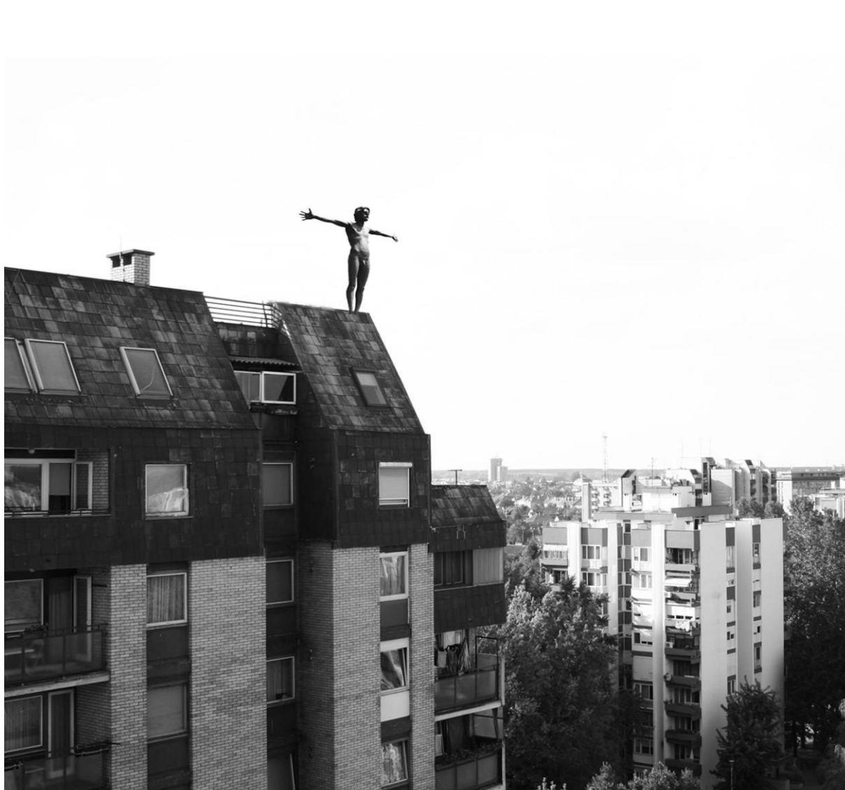
Windfucker, fotomontaža skulpture u naselju Sjenjak, Osijek, 2009. patinirani poliester, 215x215x39 cm

Na javni prostor – mjesto, gledam kao na semantičko polje koje zatvara krug značenja zajedno sa umjetničkim djelom u njemu. Što više skulptura zahvaća djelove semantičkog polja u kojem djeluje, toliko je i sama njima zahvaćena jer umjetnost ne lebdi iznad, poput neke magle, nego je vezana za materiju u njenoj strukturi. Skulptura treba nadopunu semantičkog polja, tako postaje dio sveobuhvatnije cjeline povijesti i značenja mjesta. Autonomija skulpture je nestala. Ona je samo polovina izraza. Ponovo se uključuje u život posredstvom medija mjesta. Skulptura je zapravo fizička stvar kao i sve druge stvari u prostoru i vremenu, s njima je u kontaktu i samim tim se otvara njihovim utjecajima te se odriče sebe i vlastite autonomije. Istovremeno je otvorena utjecajima ali i zatvorena, odnosno čuva zatvorenost vlastitog sustava. Semantičko polje skulpture je njen medij ali i ona je medij mjesta.