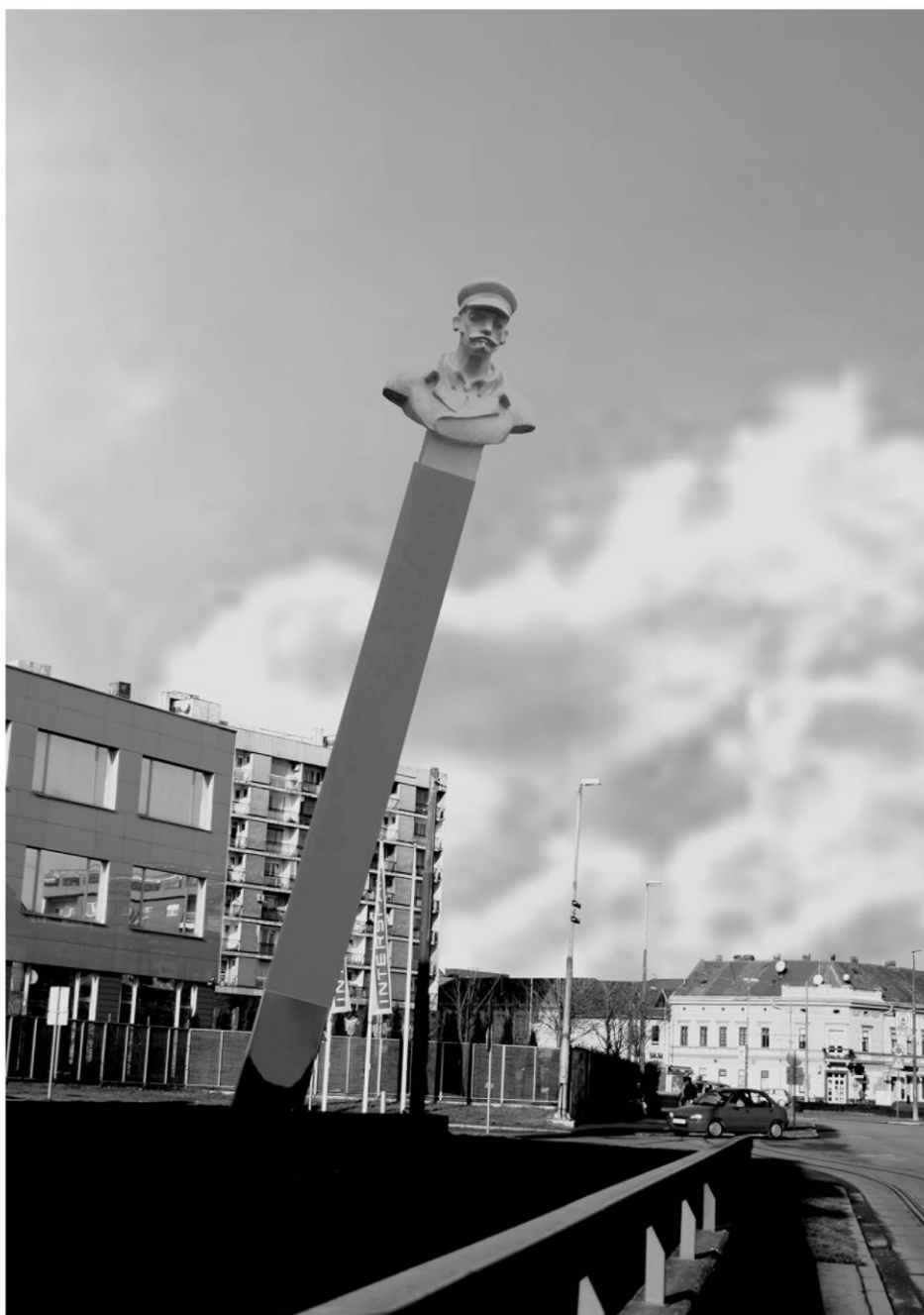
Rent a Hero Agency, fotomontaža skulpture na križanju Vinkovačke i Reisnerove ulice, Osijek, 2007. patinirani gips, 130x100x78 cm

Dominantno biće sjajno savlađuje bezmirisne visine Nos ga vuče zemlji, energija rasta gura ga nebu Stoga ono raste – ukoso raste!