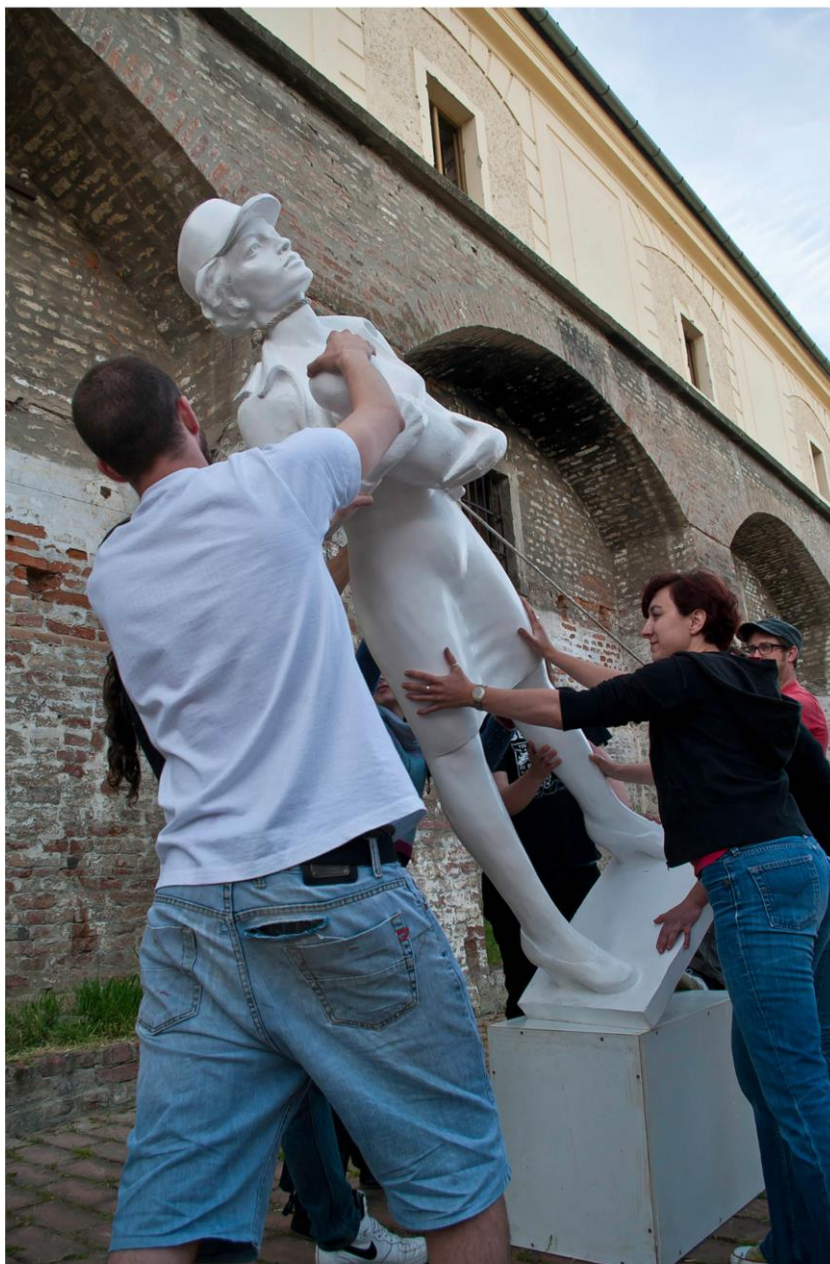
Madonna & Banda, prilikom postavljanja izložbe u galeriji Kazamat, Osijek, 2011.

Nakon svake revolucije stari spomenici se ruše, a dižu novi. Tako je i nakon izložbe. Valja nam svaki put ispočetka pisati povijest.