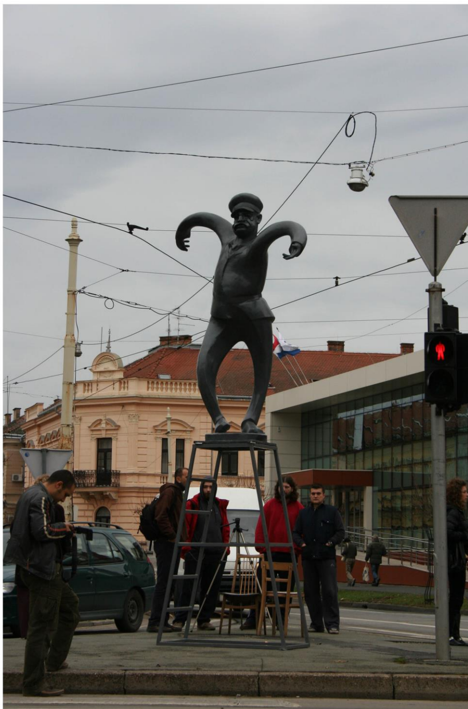
Ordnung, jednodnevni postav na križanju Kapucinske ul i ul. Stjepana Radića, Osijek, 2008. poliester, željezne ljestve, 700x89x60 cm

U čitanje cjelokupnog prizora skulpture na ulici ulaze i auti, ljudi, semafori, instalacije, cesta itd. Koristimo se semiotičkim alatima za čitanje, okviri i interdiskurzivnost, sintaksa i znakovi. Niti jedan element unutar prizora ne može se opisati kao besmislen. Unutar okvira prizora nalaze se stvari koje čine sliku grada. U svojoj ontološkoj naravi grad jeste hrpa stvari.