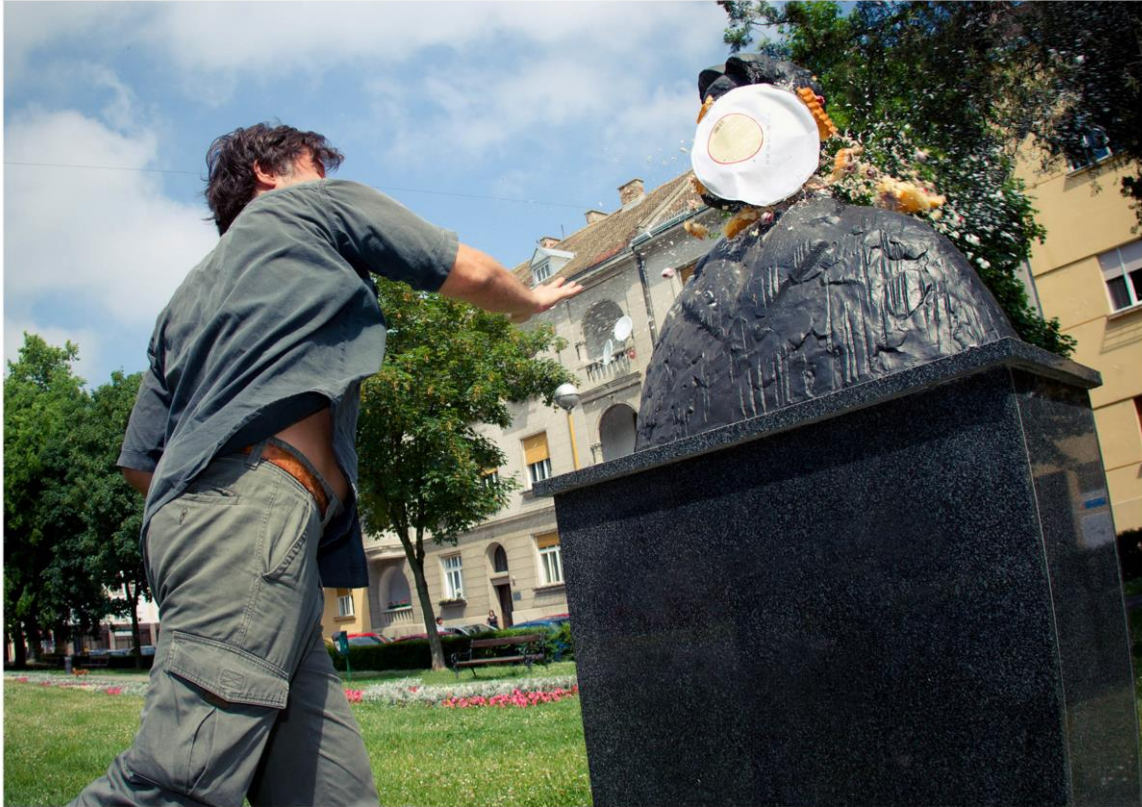
Torta vs. Bronca, akcija u Kapucinskoj ulici, Osijek, 2011.

Materija kao metafora prolaznosti ili vječnosti? Bronca i torta su sredstva političke borbe, samo što pripadaju različitim društvenim sektama. Bronca pripada moćnima, skupinama koje ulažu znatan kapital u podupiranje svojih strategija – putem skulpture ili građevine vrše trajan učinak na krajolik. Torta - popularno sredstvo manje moćnih, koji njome izražavaju negodovanje gađanjem političkih neistomišljenika.