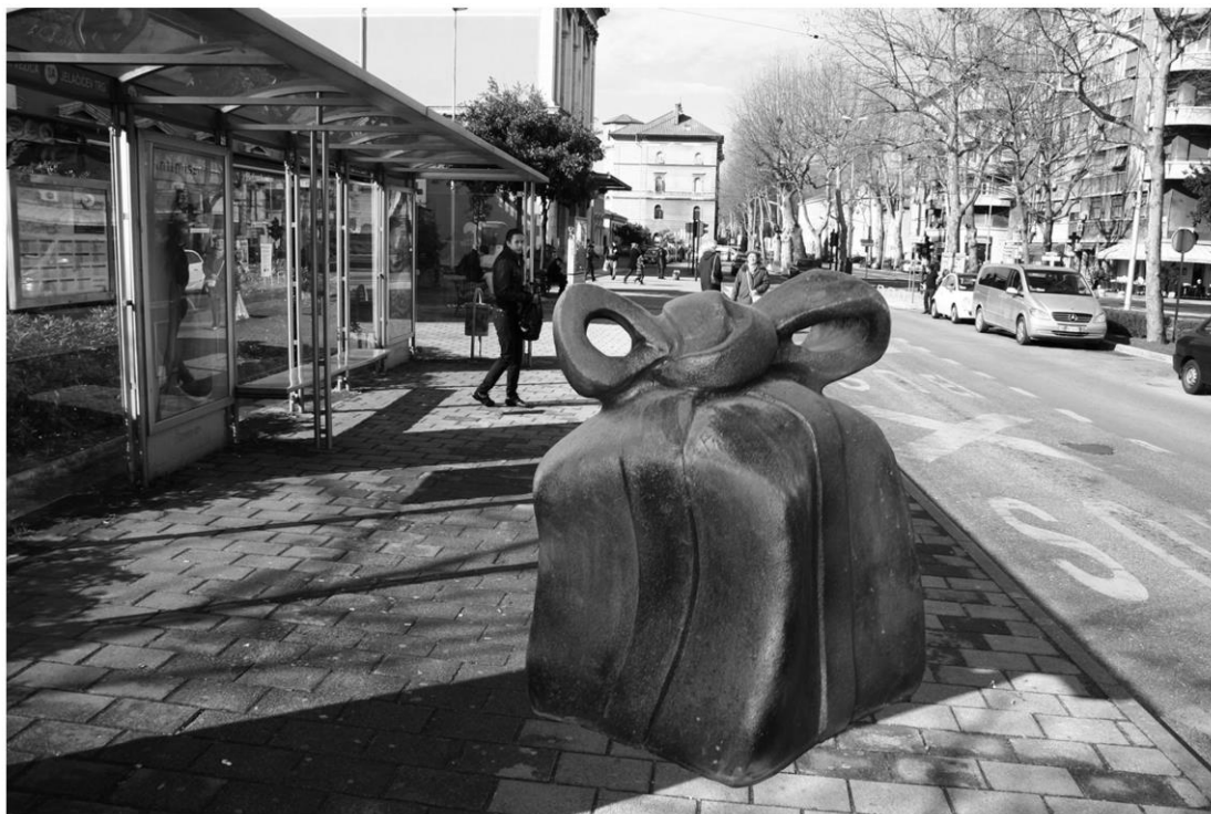
Kaboom!, fotomontaža skulpture Kaboom! u Krešimirovoj ulici, Rijeka, 2010. glazirana terakota, 78x64x60

Sad sam odlučio „zaviriti u vlastiti sadržaj“ (G. Baselitz), ne u smislu eksplicitnog ekspresionističkog izraza u formalnom tretiranju kiparskog medija kojim se bavim, nego više u smislu zauzetog stava prema kojem se odlučuje upravo putem opipljive stvarnosti ali istovremeno i znaka. Ovo nas vraća do samog „Trojanskog konja“- simbola poklona koji to nije. Simboličko značenje predmeta koji sam odabrao se može iščitavati kao početak novog ciklusa, tj. darovi se daju da bi novi ciklus započeo povoljnim znakom, predznakom (paketom) izobilja (ovaj put - misaonih operacija!). No, tu se sada događa paradoks: započeti ciklus je stavljen pod sumnju i to zvukom, tiktakanjem (koje bi u drugoj prilici bio tek monotoni „bilježnik“ protoka vremena) čime se paketi i tiktakanja međusobno dokidaju, ali i uspostavljaju. Taj paradoks stvara osjećaj nelagode, ali istovremeno jača svijest o skulpturi kao šupljem predmetu čime se remeti uobičajena struktura gledanja, od izvanjskog prema unutrašnjem, koja sada ustupa mjesto gledanju od unutrašnjeg prema izvanjskome.