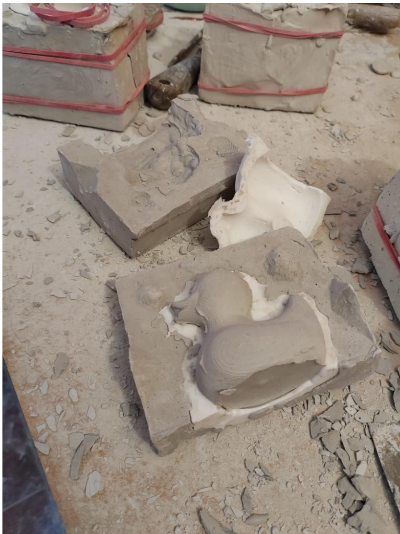
Slika 13 - Lijevanje gipsanih patkica iz silikonskih kalupa