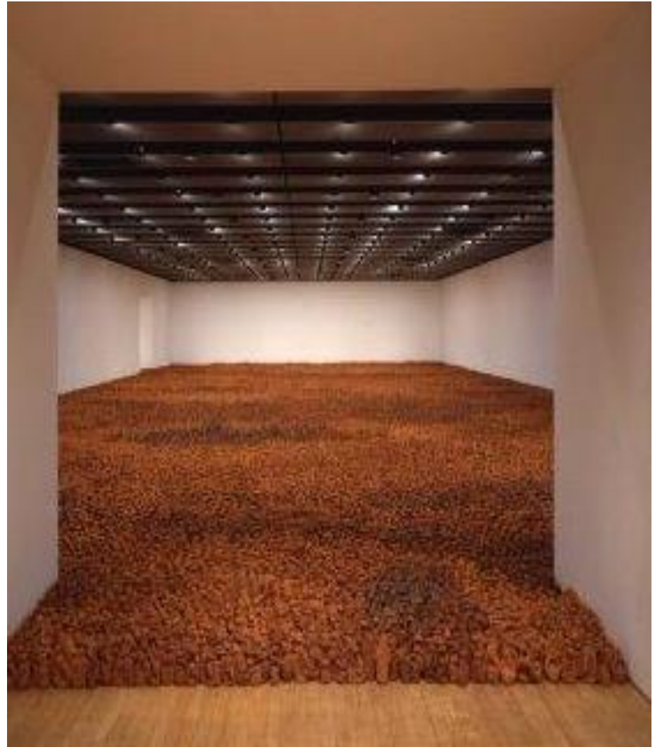
Sluke 7., 8., 9.- Antony Gormley, Field for the British isles