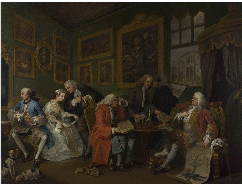
Slika 3 - William Hogarth - Marriage a la Mode

narav kao i supruga, s obzirom na to da mu je vrat ukaljan crnom mrljom sifilisa.