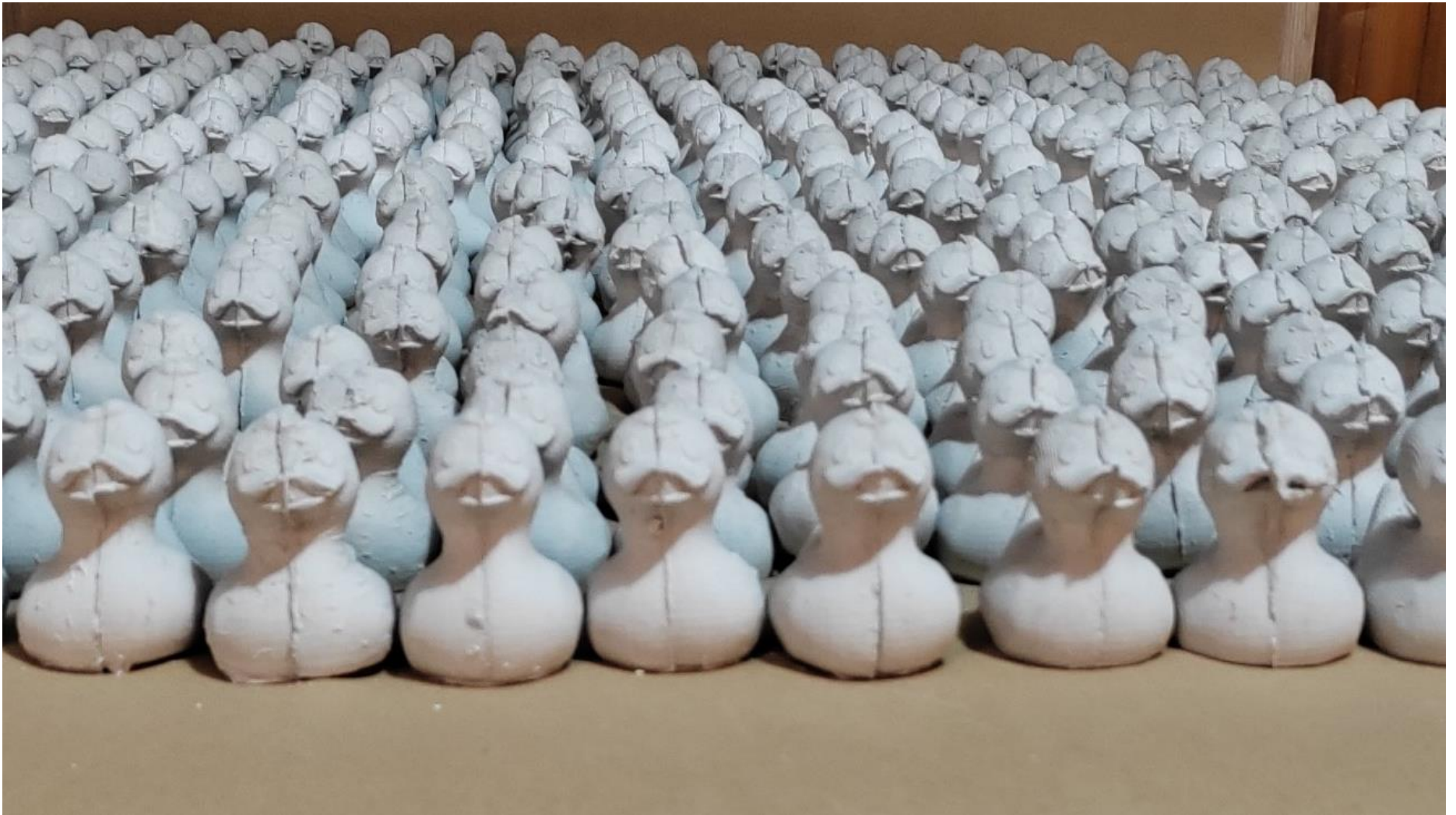
Slika 1 - Odljevi patkica