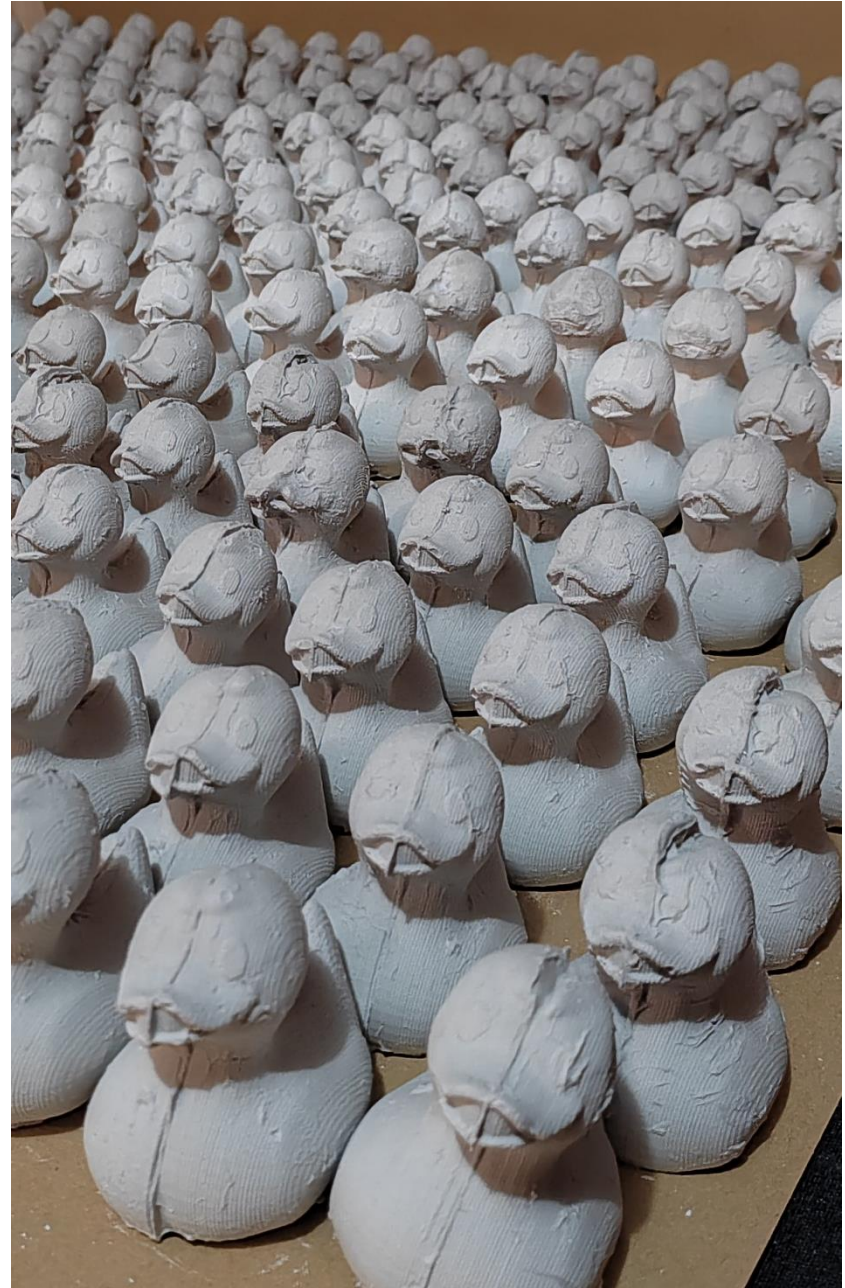
Slika 10 - Odljevi patkica

Kontrastom između individualnosti i pripadnosti društvu vidimo kako društvo ne može funkcionirati bez ovakvih individua koje se razlikuju prema nečemu. One su mu ne samo potrebne za njegovu egzistenciju, već je i individuama potrebno društvo kako bi se i one imale iz čega istaknuti. Upravo taj kontrastni sukob ono je što romantizira cijelu priču koju oni nose. Ta struktura i slojevitost individua potrebni su za kolektiv i dublje promišljanje o tome gdje je zapravo naše vlastito mjesto unutar društva. Vjerujem kako unutar pojedinca koji ga gleda i doživljava može prouzročiti pitanja o osobnom identitetu, kulturalnim razlikama ili pak o njihovoj uključenosti u društvu. No osim vlastitog propitkivanja ono također uzrokuje pitanja možemo li prepoznati i cijiniti jedinstvenost i važnost drugih individua koje se unutar tog kolektiva nalaze.