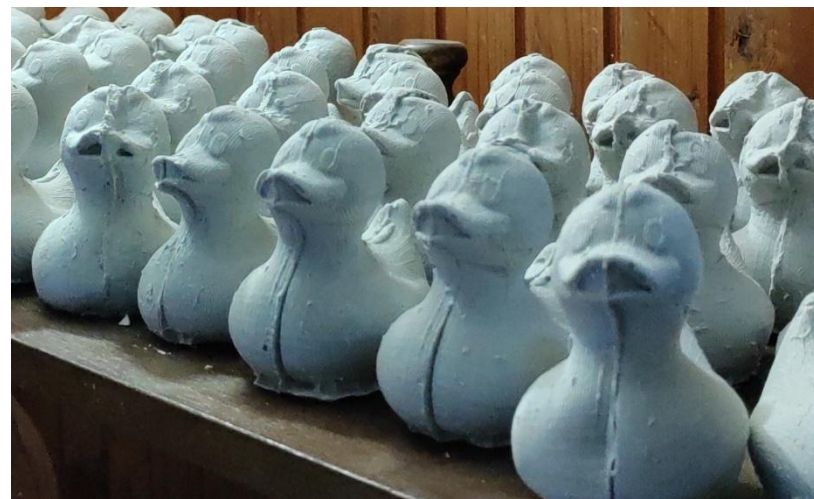
Slika 6 - Odljevi patkica

Ponovo primjerom sportskih navijačkih skupina možemo pogledati način ponašanja koji je među njima uslijedio nakon što su u roku manjem od godinu dana Hrvatsku pogodila dva potresa. Navijači takvih skupina bili su među prvim dobrovoljcima koji su izašli na teren unatoč neposrednoj opasnosti koju prirodna katastrofa uzrokuje.