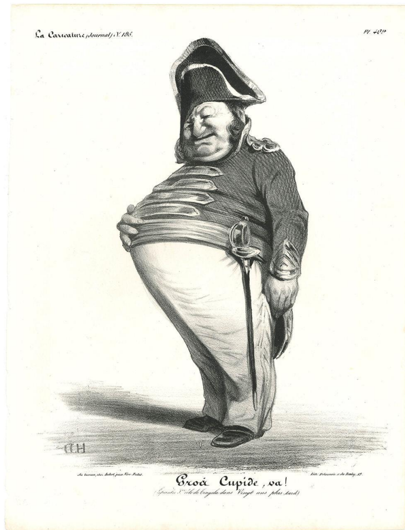
Slika 4 - Honoré Damier - karikatura

Za razliku od realizma, ekspresionizam je poprimio jedan vrlo subjektivan način portretiranja stvarnosti. Kako bi predstavili ljudska iskustva, oni su tražili svoje unutarnje emocije prepune veselja i očaja, s određenim notama ironije. Ovo je svakako bio period umjetnosti koji je dobro reflektirao period stvaranja. Budući da su svjetski odnosi bili nestabilni, što je kasnije vodilo k prvom svjetskom ratu, začuđujuće je da se pokret nastavio dok je kontinent bio progutan ratom. Odlikovali su ih brzi potezi kista puni strasti ili bijesa, dok su boje često bile postavljene impasto-tehnikom kako bi se naglasile šokantne kompozicije. Jedan od iznimno bitnih ekspresionista preko kojeg možemo dobiti dojam tadašnjeg društva, svakako je bio Edvard Munch. Poput Van Gogha, patio je od duševnih tegoba, a njegov Krik (1893) opisuje njegov vlastiti smisao disintegracije. Također, tijekom ekspresionizma krenule su se pojavljivati i grupacije poput Die Brücke , koja je osnovana u njemačkoj te je bila prva koja je eksplicitno i organizirano promovirala ekspresionistički pokret. Emil Nolde, jedan od osnivača svojim djelom „Život s maskama“ (1911) prikazao je kombinaciju stravičnih maska koje se smiju. Nacisti su ga proglasili zloglasnim umjetnikom te