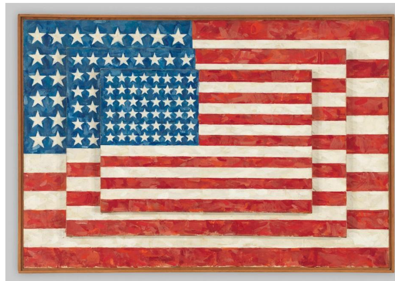
Slika 5 - Jasper Johns, Three flags , 1958

Kao odgovor na nefigurativnu umjetnost koja je uslijedila tijekom perioda između dvaju svjetskih ratova, u engleskoj se 1950. godina pojavljuje pop-art te desetak godina kasnije uzima veliki mah u Americi. Oni su koristili svakodnevne komercijalne ilustracije na satiričan ili zaigran način, često prikazujući suvremene životne stilove te su komentirali standardizaciju proizvoda ili samu kulturu. Vizualni manifest napravio je Richard Hamilton s kolažom „Što je to što čini današnje domove toliko drugačijima, privlačnima?“ (1956) na kojemu su prikazani žena i muškarac kako goli obitavaju u svome domu dok je scena nastrojena erotski. Zapakirana hrana na stolu te električni aparati na stolu prikazivali su propagandu i komotnost američkog sna. Jasper Johns krenuo je u diskusiju oko granice između svakodnevnih objekata i umjetničkih djela. Izazivao je svoju publiku da naprave distinkciju između stvarnosti i umjetnosti koristeći se popularnim simbolima u svojim slikama kao što je američka zastava, mete ili brojevima iz šablona. Najpopularniji je dakako bio Andy Warhol koji je sažeo moderne društvene obzervacije svojom izjavom: „Svi će imati svojih 15 minuta slave“. Opsjednut samim sobom, organizirajući razne medijske događaje i samopromocije, praktički je sam postao djelo pop-arta. Za motive je često koristio komercijalne slike kao što su konzerve juhe, boce coca-cole, novčanice i još mnogo objekata koje su okarakterizirale komercijalne američke ikone.