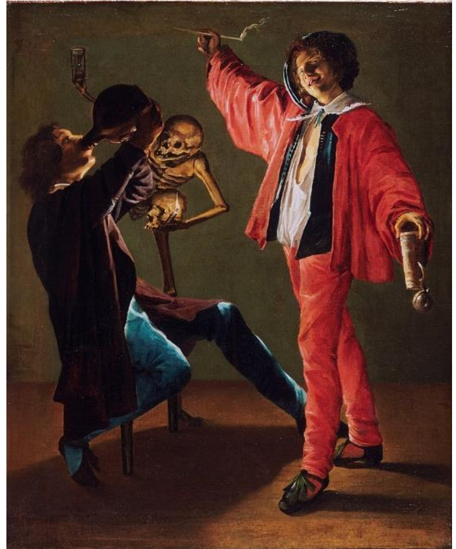
Slika 2 - Judith Leyster - Posljednja kapljica

Rokoko, naizgled sličan baroku, imao je veliku različitost u temama koje su se dabirale. Stil je postao prepoznat u Francuskoj nakon smrti Louisa XIV 1715., a umjetnici su pokazivali aristokratsku dekadenciju i rođenje Burža. Često su im slike imale satirično značenje, unatoč svojoj raskoši prikazanim na slikama koje možemo poistovjetiti sa svijetom fantazije ili blagostanja. Ironija postaje prikaz svijeta korupcije u kojemu se nalazilo Europsko društvo. Slikarstvo je u tom periodu bilo vrlo dekorativno, a umjetnici su bili postavljeni kao žestoki kritičari društva. Antoine Watteau je u svojem djelu Ukrcaj na Kiteru prikazao nekolicinu parova koji se pripremaju za odlazak na fantastički otok Veneru. Prikazujući melankoliju tog događanja prikazom njihove ofucane odjeće pri povratku stvarnosti. William Hogarth je pak imao ciničan i izrugljiv pristup braku. U svojem djelu „Marriage a la Mode“ iz 1745.