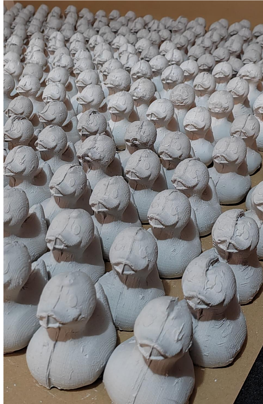
Slika 10 - Odljevi patkica

Kontrastom između individualnosti i pripadnosti društvu vidimo kako društvo ne može funkcionirati bez ovakvih individua koje se razlikuju prema nečemu. One su mu ne samo potrebne za njegovu egzistenciju, već je i individuama potrebno društvo kako bi se i one imale iz čega istaknuti. Upravo taj kontrastni sukob ono je što romantizira cijelu priču koju oni nose. Ta struktura i slojevitost individua potrebni su za kolektiv i dublje promišljanje o tome gdje je zapravo naše vlastito mjesto unutar društva. Vjerujem kako unutar pojedinca koji ga gleda i doživljava može prouzročiti pitanja o osobnom identitetu, kulturalnim razlikama ili pak o njihovoj uključenosti u društvu. No osim vlastitog propitkivanja ono također uzrokuje pitanja možemo li prepoznati i cijiniti jedinstvenost i važnost drugih individua koje se unutar tog kolektiva nalaze.