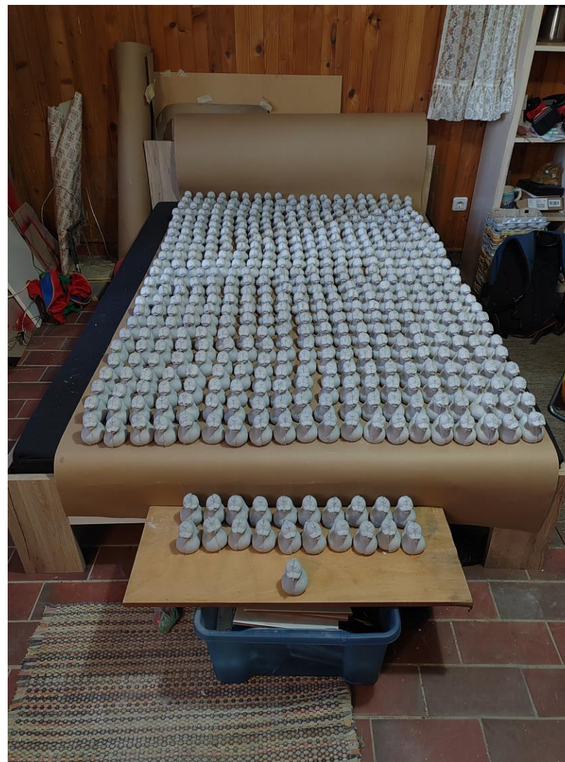
Slika 14 - 501 gipsanih odljeva patkica