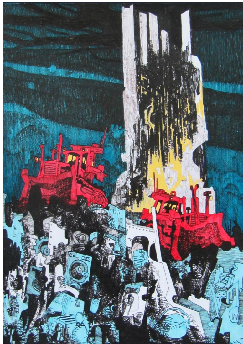
Slika 7: Rana ideja za prikaz na prvoj ploči; okoliš zatrpan smećem dok se u pozadini nazire stablo koje je zbog svoje veličine uspjelo izbjeći sječu

Navedeni pristup koristim kao određeni standard kojeg se držim kako proces crtanja ne bi bio prekinut, a dotok novih ideja te potencijalnih (i potrebnih) poboljšanja zanemaren. Vjerujem kako mi je navedeni način rada, implementiran tijekom čitavog studiranja, izrazito mnogo koristio za usavršavanje te ću se te dinamike nastojati držati i dalje.