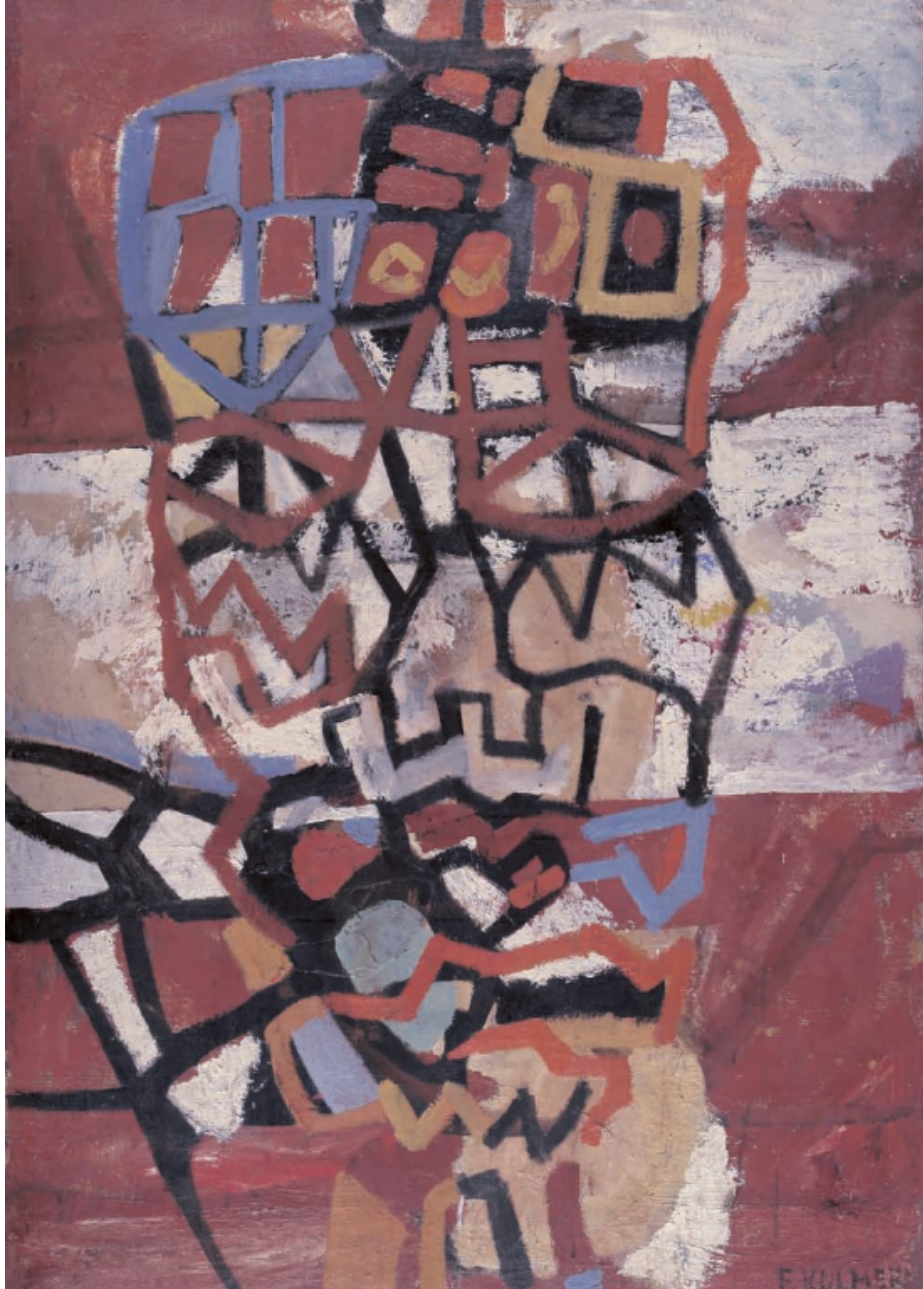
Slika 10. Ferdinand Kulmer, Glava , ulje na platnu, 1955.