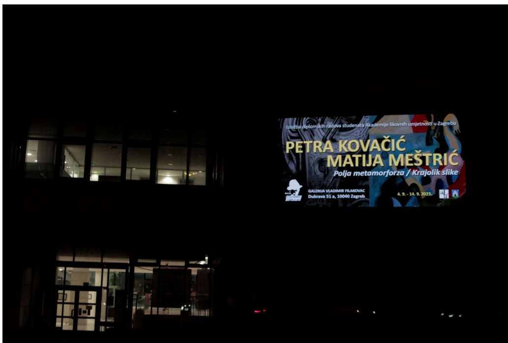
Slika 16. Fotografije s otvorenja izložbe u galeriji Vladimir Filakovac