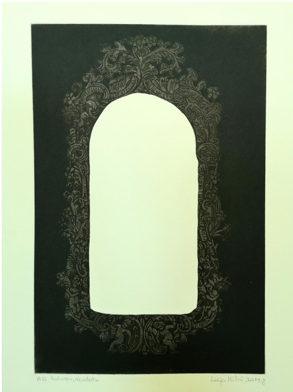
Izadi iz okvira, 2019. bakropis i akvatinta