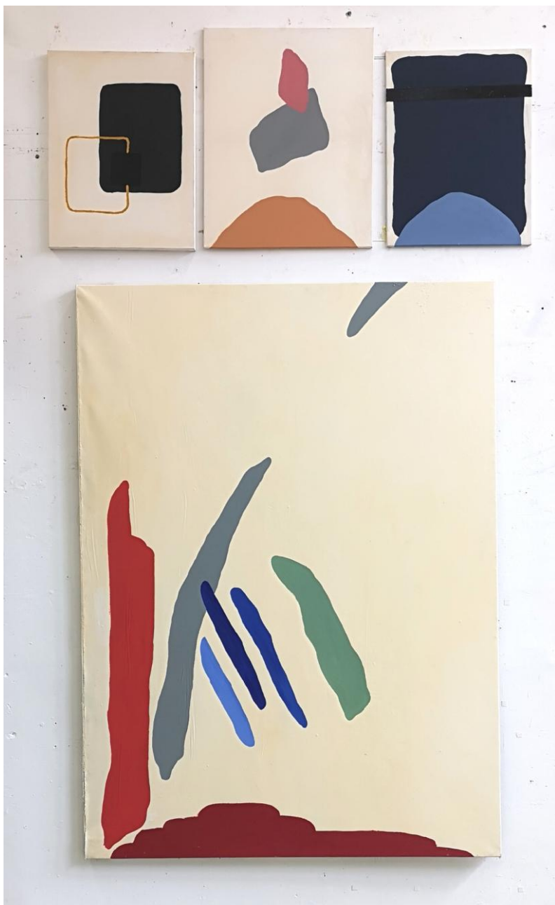
Izadi iz okvira, 2019., akril na platnu