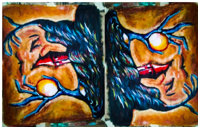
Lica u preriji, 2019., akril na papiru