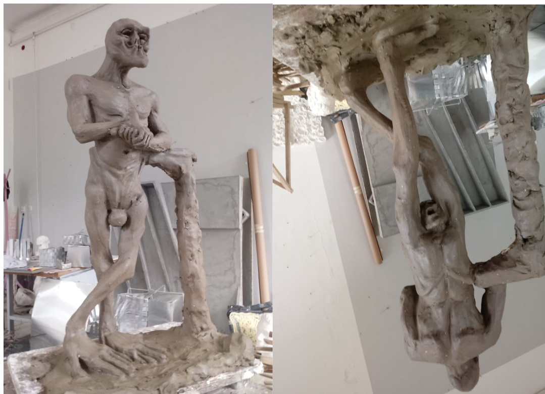
Assface, 2018., glina

Figura koja pokušava biti duhovita i donekle anatomske smisljena, a prikazati jedan od mogućih scenarija bizarne evolucije čovjeka u nekom drugom svemiru je akt glinenog lika Assface, koji je utjelovljeni primjerak kombinacije izrečica da muškarci razmišljaju spolovilo i da su uglavnom "stražnjice"... Doslovnim načinom interpretiranja došao sam na ideju rotacije i zamjene torza i udova do razine privida antropomorfности sa svih strana. Taj je izazov za što idealniju izvedbu zahtijevao voluminoznost koju sam tražio u glini i od koje se nisam još bio spreman razići. Tijekom modeliranja, kroz više pokušaja i promašaja, ukazivala su mi se anatomska rješenja bolja od zamišljene vizije. Stopala su se pregibanjem pretakala u dlanove, koljena u laktove, guzni obrasi u ramena u gornjem dijelu, dok donji, npr. zbog smjernice da su ruke mršavije od nogu, manjak antropomorfne suptilnosti odaje cijelu skulpturu kao iskrivljenu, ali time privlači pozornost na različitost od norme i grozotu. Rezultat je neobičan i nadam se duhovit, a predstavlja uvrnutu analizu vizualne i mehaničke sličnosti udova i pitanja o njihovom evolucijskom uvjetovanju i mogućnostima ishoda.