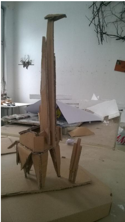
Žirafa maketa, 2018, karton

Uz kartonsku žirafu nalazi se prikaz čovjeka (promatrača) u mjerilu, kao ideja za ostvarenje skice u većim dimenzijama i drugačijem materijalu. Druga fotografija prikazuje žirafu izvedenu u kombiniranoj tehnici. Napravljena je od višeslojnog stiropora koji je ručno zaglađen i oblikovan brusnim papirom. Rubovi su zaobljeni materijal, materijal dozvoljava fino oblikovanje, a samim time karakter skulpture je drugačiji. Kaširanjem (papirom) je potom presvučena cijela figura, te obojana kistom i akrilnim bojama. Razigranim potezima kista stvorena je igra linijama koja vodi oko promatrača.