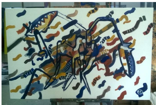
Žirafa 23, 2019., akril na platnu