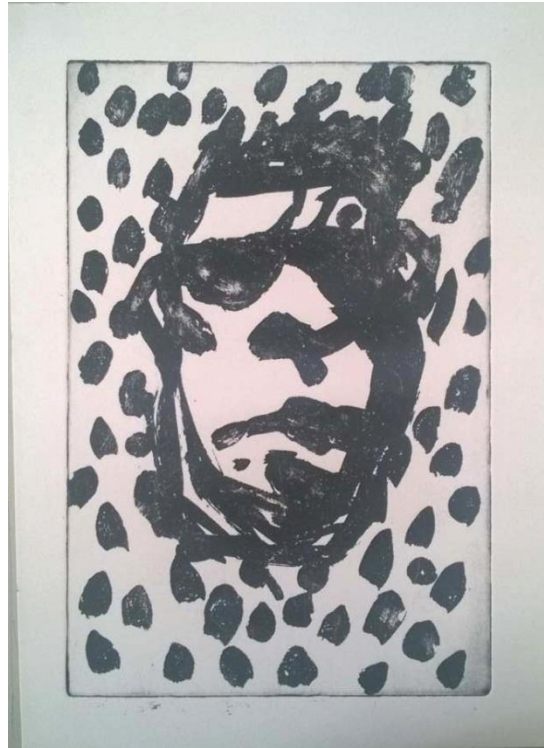
Autoportret, 2019., rezervaš

Fleka! Akronim: Fikcijski labilan element karaktera autoportreta. Fikcijski, nestvaran, neprirodan, nevidljiv. Labilan u smislu promjenjivosti. Element karaktera autoportreta, uzorak koji ponavljajući se stvara ritam. Neujednačeno titra, konstantno emitira energiju, kreće se, preoblikuje, nije jednoličan. Prikazuje autorov karakter, uvrnutost i dubinu očiju u sjeni. Prkosi neživom, a pritom oblikuje živo. Sakriva nepotrebne detalje. Laž prekriva istinom. Bahato crnilo koje odlučno vodi pogled. Suočava se sa bjelinom papira kao čovjek sa crnim nebom. Traži svjetlost u samoj sebi. Sukobljavanje unutrašnjeg s izvanjskim. Implozija misli koja dolazi do eksplozije energije. Fleka.