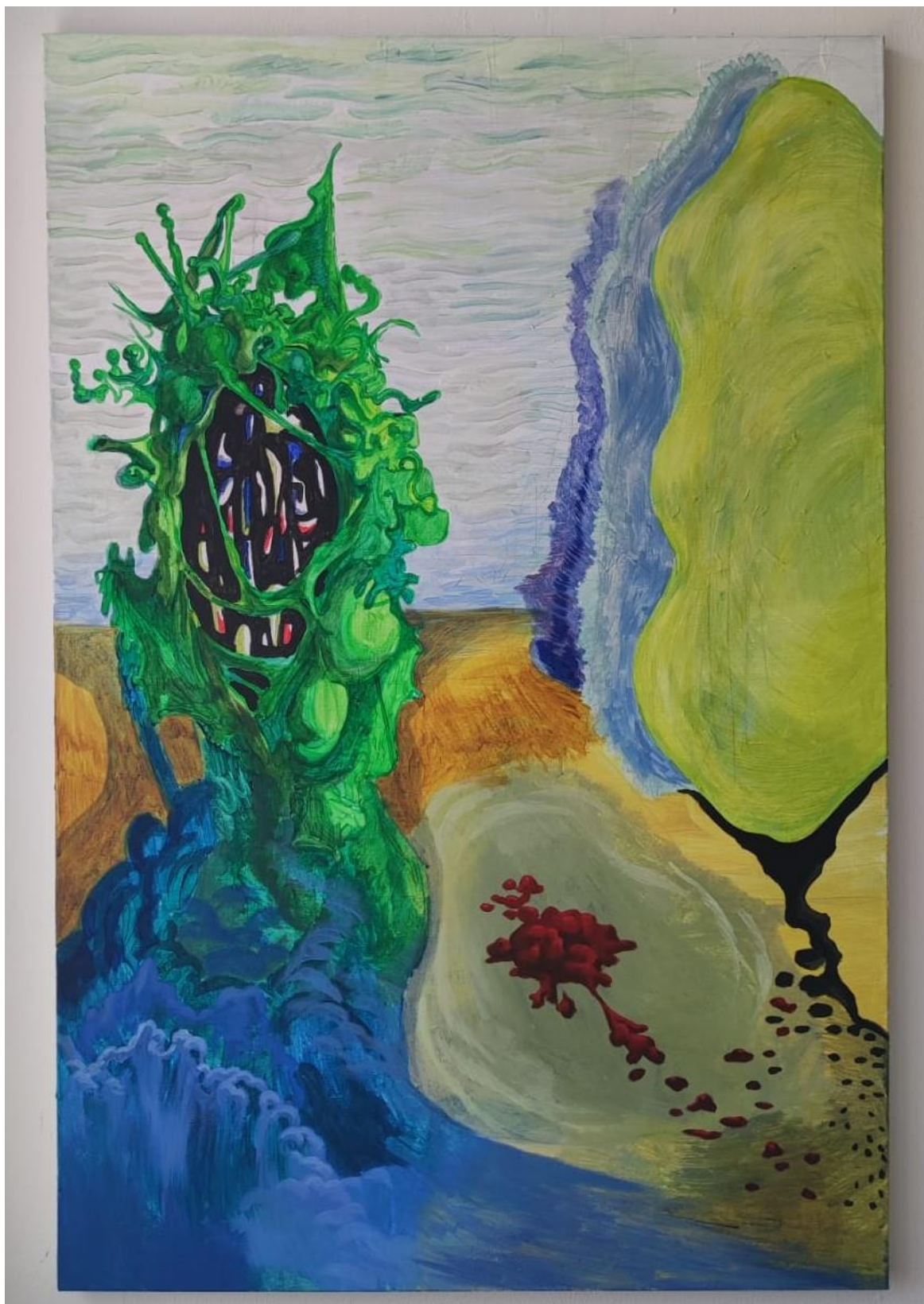
Metamorfoza, akril na platnu, 120x80