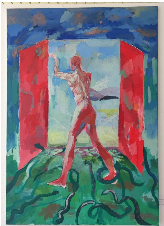
Pogled prema sebi, akril na platnu, 90x60