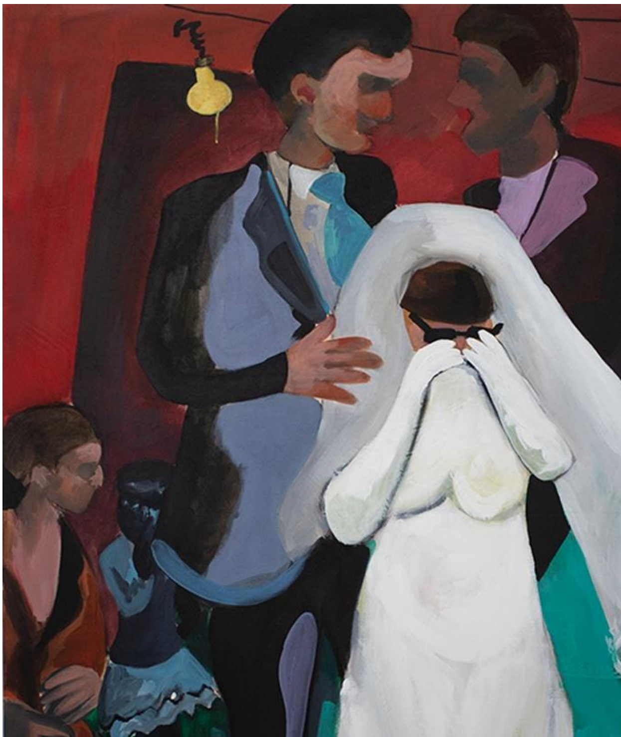
Dobro da smo zajedno , 2023. Akril i ulje na platnu; 166 x 130 cm. Detalj