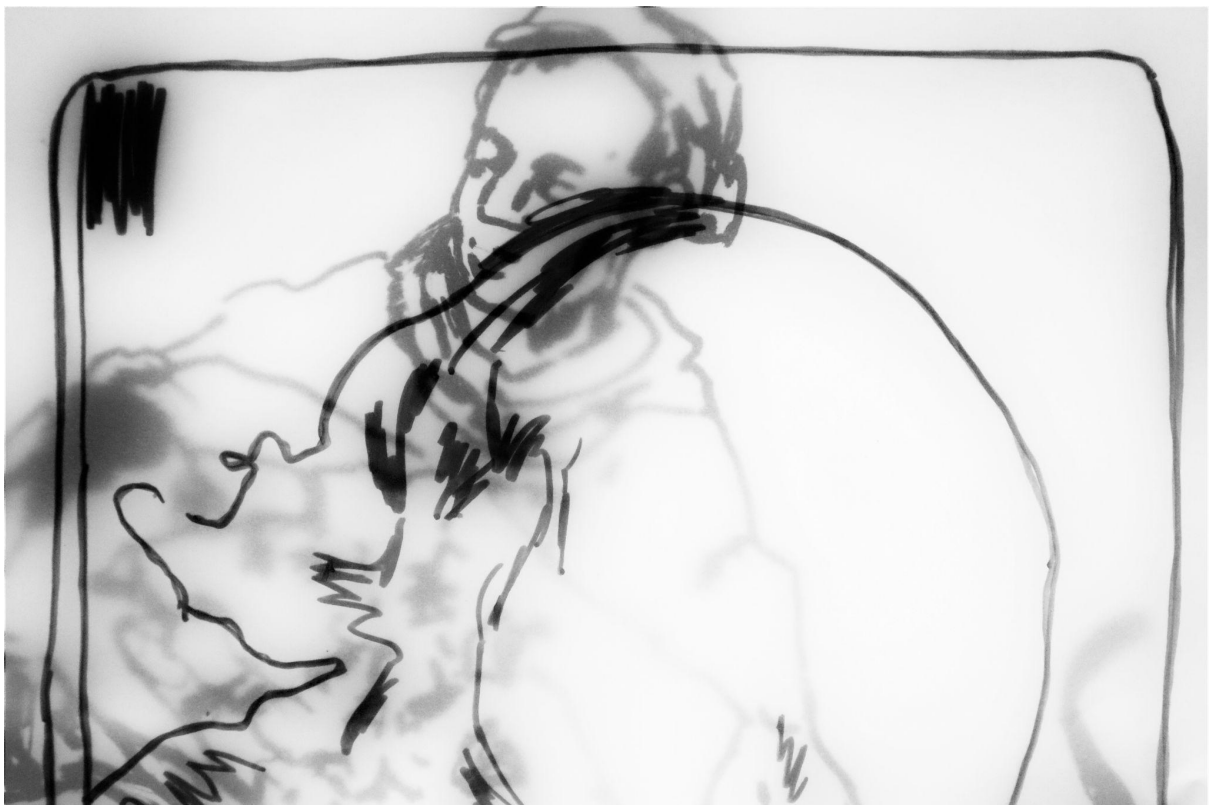
“Sat akta” (detalj), kombinirana tehnika crteža i kolaža na papiru, 270x150cm, 2021./2022.