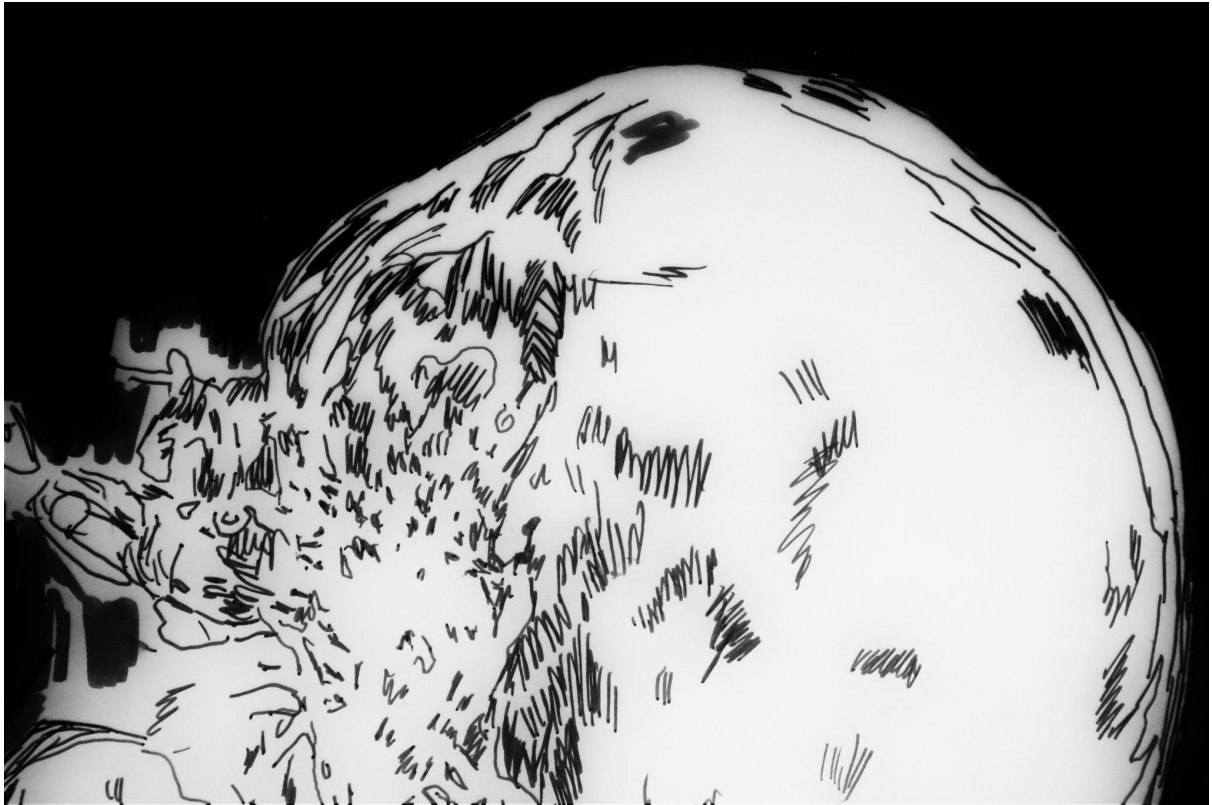
“Sat akta” (detalj), kombinirana tehnika crteža i kolaža na papiru, 270x150cm, 2021./2022.