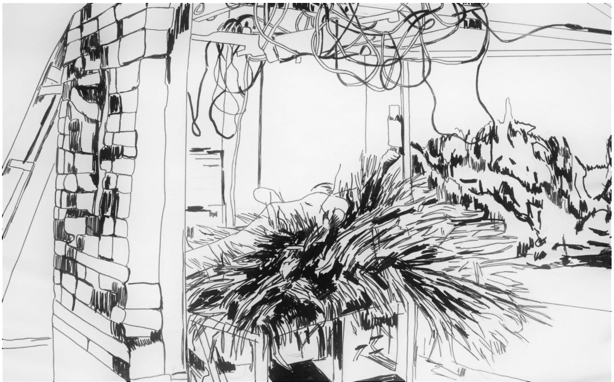
“Sat akta” (detalj), kombinirana tehnika crteža i kolaža na papiru, 270x150cm, 2021./2022.