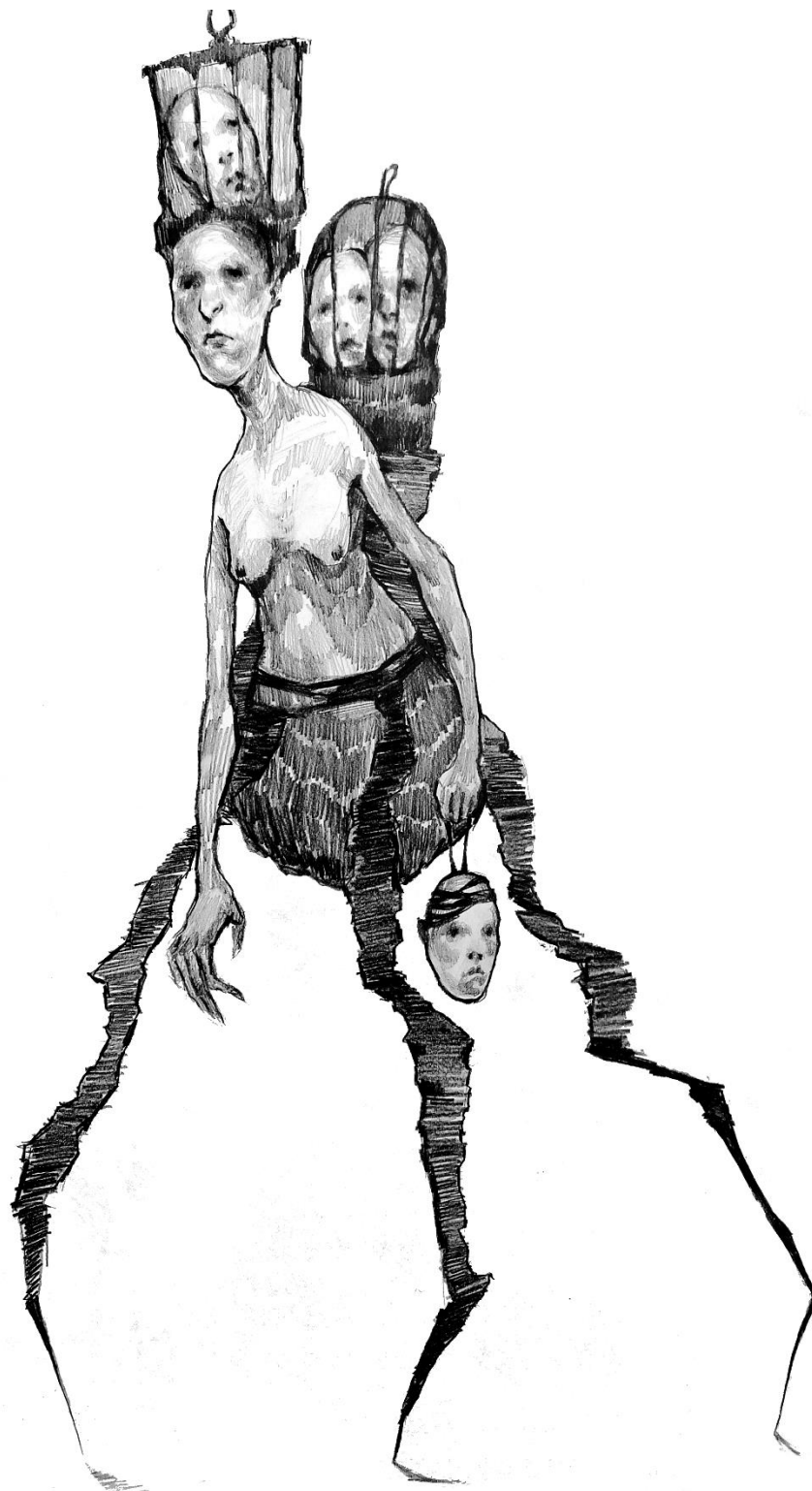
Slika 5, „Untitled“, 2024.