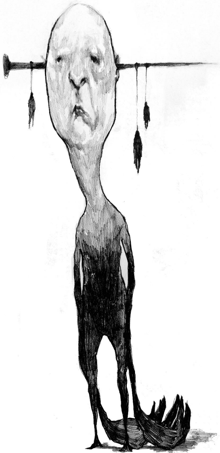
Slika 2, „Untitled“, 2024.