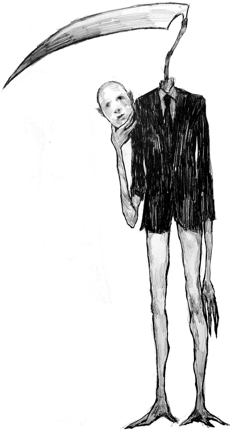
Slika 6, „Untitled“, 2024.