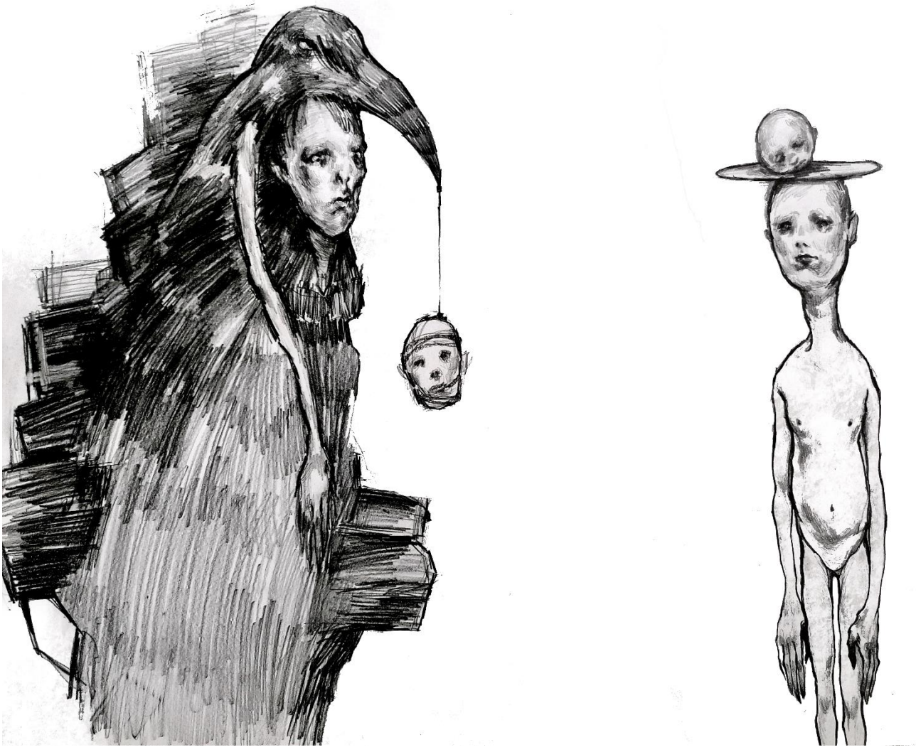
Slika 3, „Untitled“, 2024.