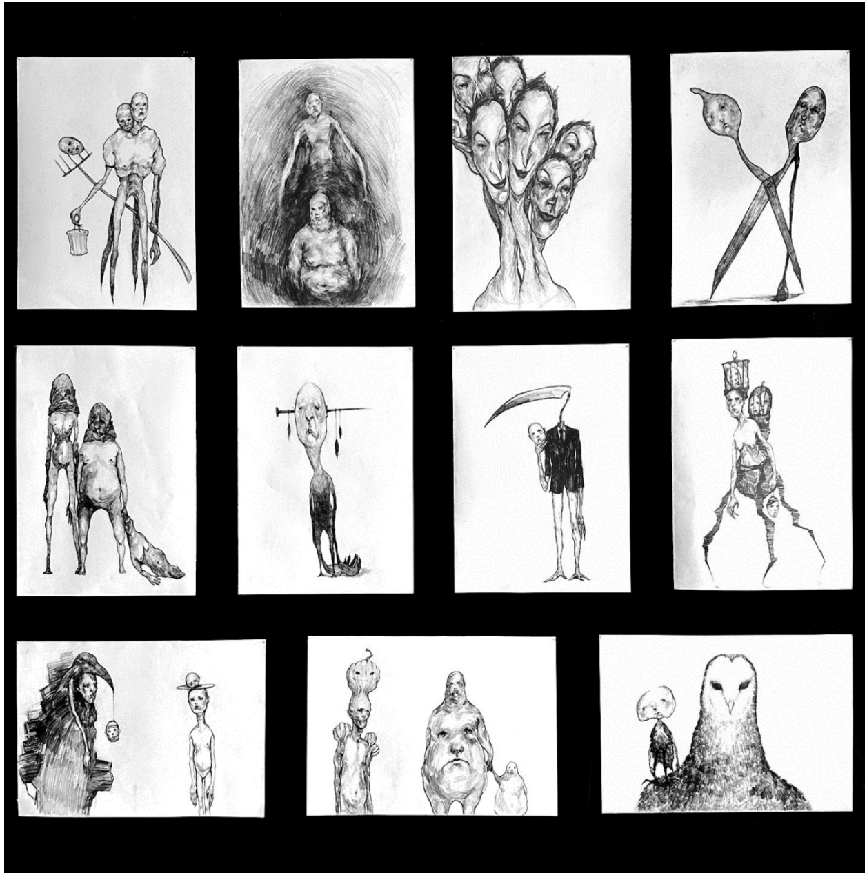
Slika 1, Postav završne izložbe, 2024.