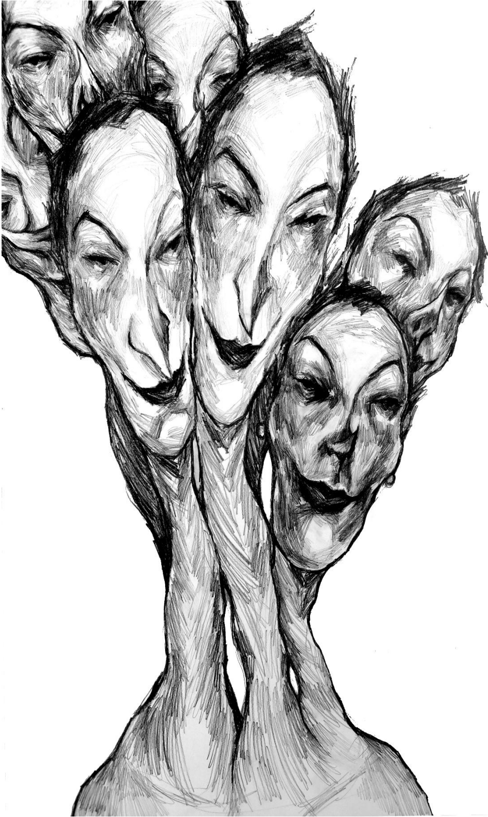
Slika 4, „Obiteljski ručak“, 2024.