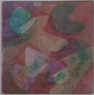
Unutarnji autoportreti, 2024.