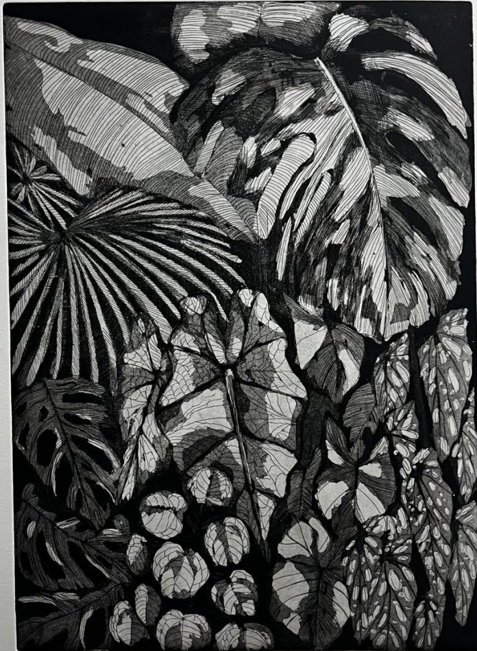
Rahela Šimičić, Biljke , 2024, Bakropis i akvatinta