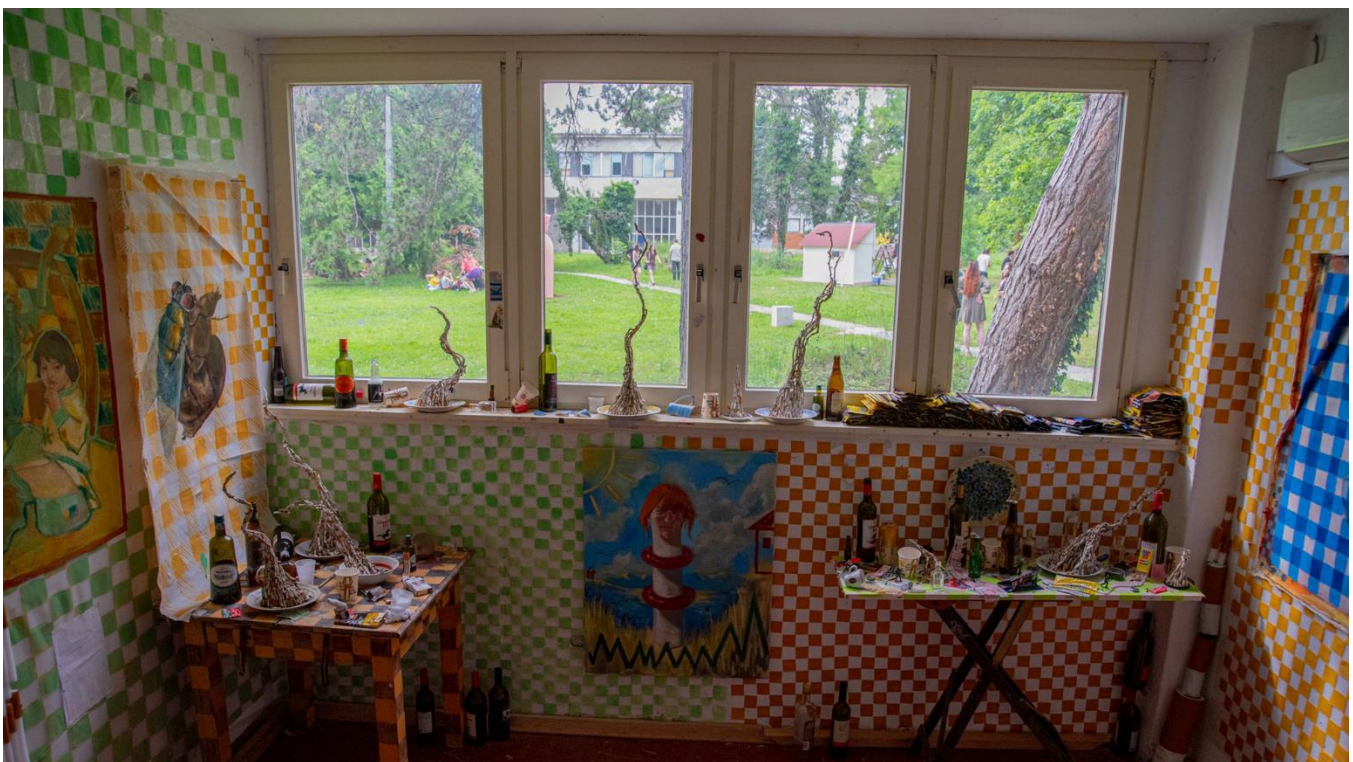
„Stol – portretiranje načina života“

Tematika nereda, zabava i iskrivljene percepcije u međuljudskim odnosima sam povezala sa stolom, koji služi kao podloga prikazivanja vlastite i društvene percepcije po pitanju ljudskih odnosa, navika, ovisnosti i konflikata. Koristim autoportrete kao česti motiv u radu. Sebe direktno postavljam na poziciju subjekta/objekta koji služi primarno da pokažem reakciju, emociju i percepciju vlastitog doživljaja. Cilj rada je potaknuti promatrača na razmišljanje o vlastitim navikama, povezivanje simboličnih predmeta sa vlastitim iskustvima te prenijeti duh zabave koji ostaje prisutan u kaosu i neredu.