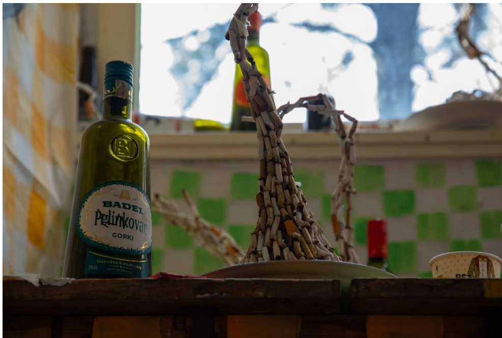
„Pepeljare u pokretu“ – skulpture izrađene od opušaka

Skupljanjem opušaka svih ljudi koje poznajem, izgradila sam skulpture /pepeljare koje portretiraju svakog pojedinca čiji je opušak. Gradim cjelinu i zajednicu svih prikupljenih opušaka koji se pojedinačno razlikuju svojim karakterom te se direktno odražavaju na osobu/vlasnika popušene cigarete.