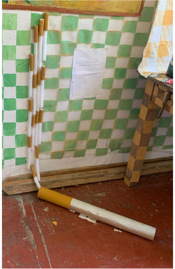
„Jedna za drugom“ - instalacija

Cigarete u prostoru predstavljaju ljude i općenito ljudsku ovisnost. Ovdje je pušenje prikazano kroz cigarete koje rastu te se šire prostorom. Cigarete uvećavam i postavljam u prostor kojim dominiraju kao direktan prikaz utjecaja ovisnosti nad čovjekom.