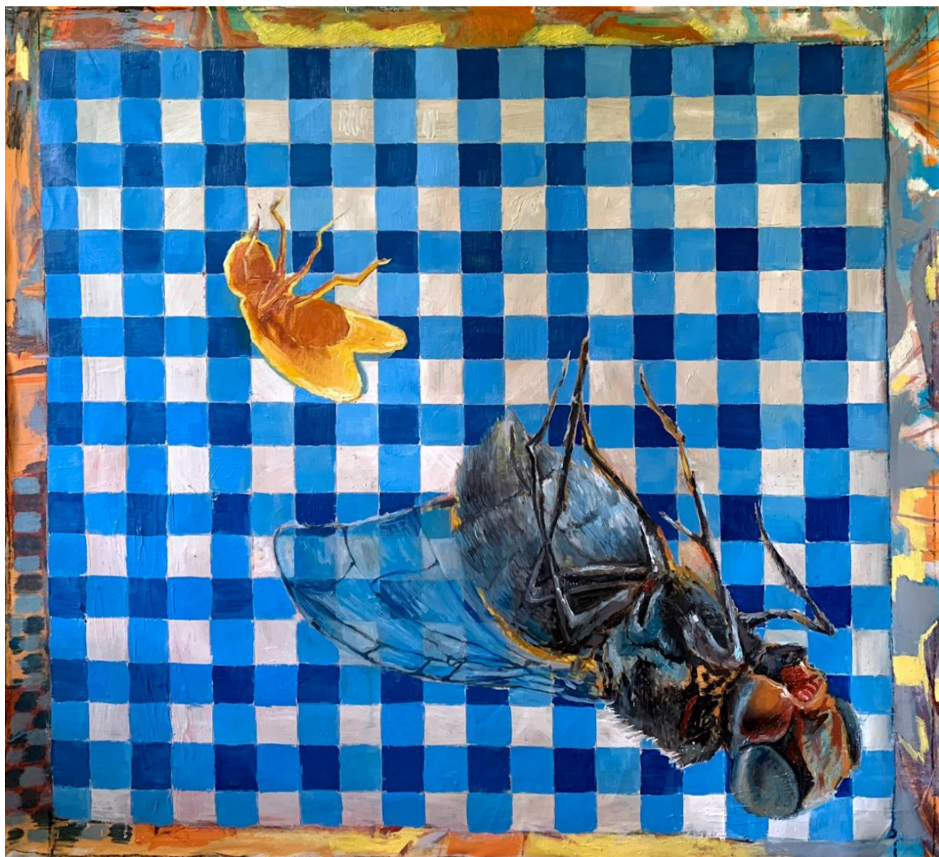
„Dvije muhe jednim udarcem“ (180x180) – ulje na platnu

U prvome punktu direktno projiciram vlastite navike i odnos prema stolovima koje sam ostavila iza sebe. Autoportretima prikazujem vlastitu percepciju prema neredu i lošim navikama te koristim dozu satire kao temeljnu zamisao u temi i likovnom izričaju.