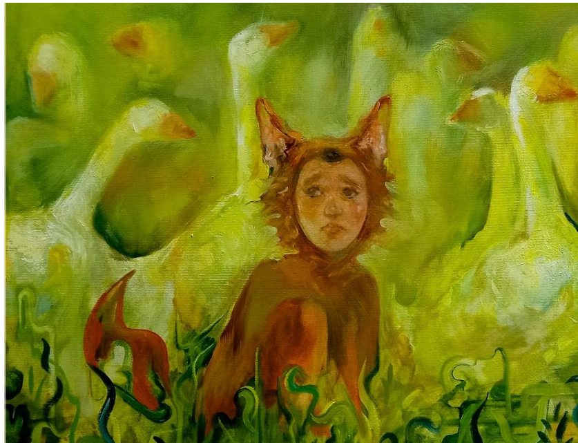
„Don't cry“ 2023.,akril i ulje na platnu