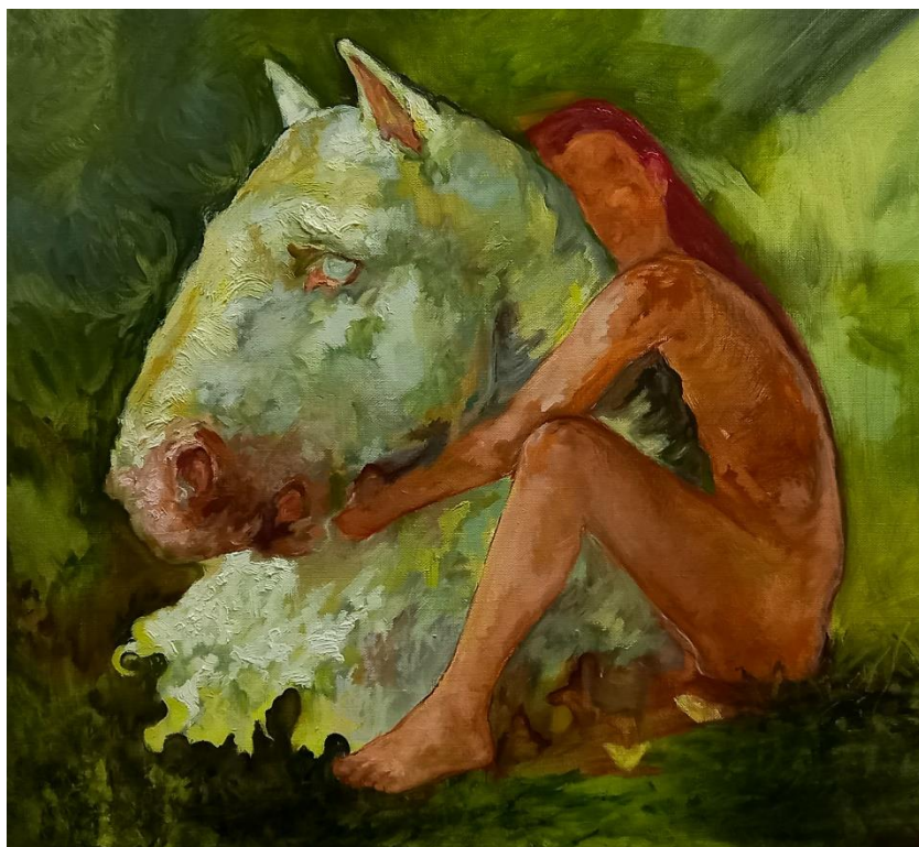
„Fear no more“ 2024.,ulje na platnu